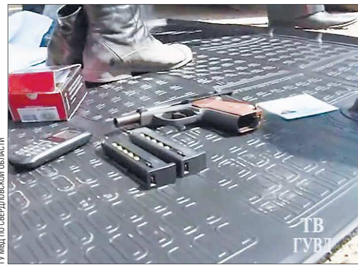
Это оружие было изъято на воровской сходке в нынешнем июле в Екатеринбурге