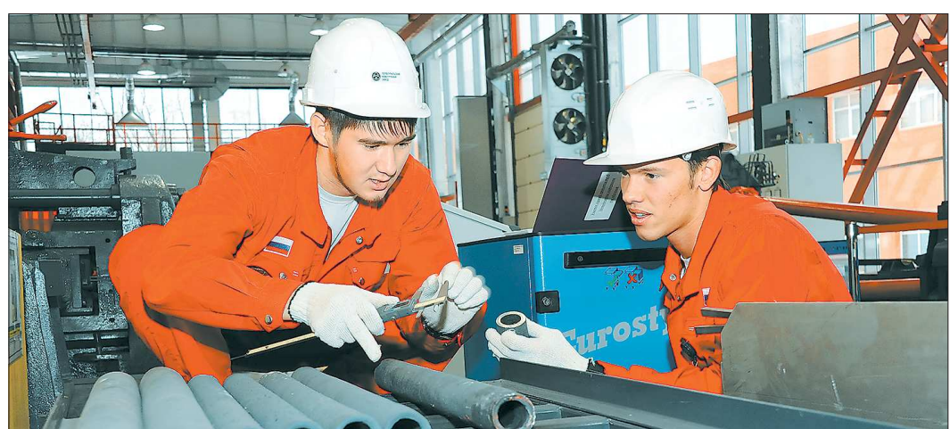
В технических вузах развивается прикладной бакалавриат: студенты готовят для работы на конкретных предприятиях с учётом особенностей применяемых технологий и оборудования