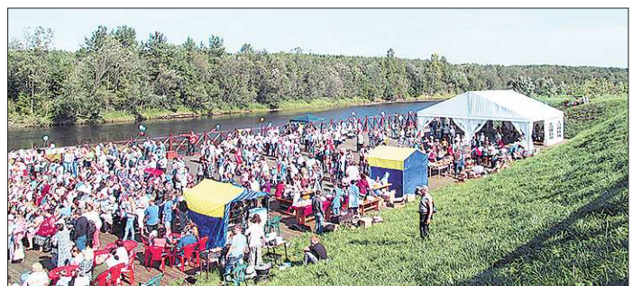
На дощатой набережной Ляли собрались лучшие народные голоса из 19 городов и сёл области — Карпинска, Серова, Гарей, Арамашево, Волчанска, Североуральска, Невьянска...

В конце лета обеспокоенные состоянием путепровода именновские жители провели сход, на котором решили чинить мост своими силами. На субботник вышли 20 добровольцев, среди которых были и дачники. Обширный они обновили (с матерьялом помогли спонсоры), но по надёжности металлоконструкция остаётся вопросом. В будущем в селении запланировано бурное возведение жилья, строительство школы, детсада, учреждений культуры, обновление инженерных и транспортных сетей. В коллективном обращении в городскую Думу селения предлагают начать этот путь с создания благоприятных условий для проживания именновских старожилов.