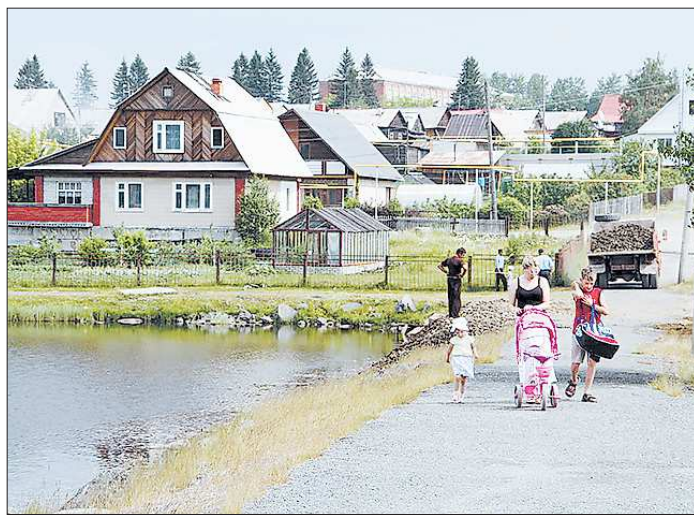
Новую набережную валериановцы получили в подарок на День посёлка. Теперь это любимое место для семейных прогулок

Грандиозный проект спортзала-комплекса разрабатывался на фоне многообещающего докризисного экономического подъёма. В период кризиса о нём пришлось забыть. Ну а теперь появилась надежда, что двухэтажная мечта сможет реализоваться во всём своём великолепии.