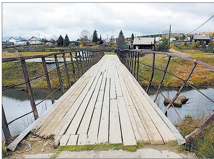
Перила на аварийном мосте в Именновском отогнули специально, чтобы большие машины не цепляли бортами

— Наш посёлок в последнее время заметно помолодел. Население растёт, на улицах полно домов-новостроек, — рассказывает директор местного клуба Альфия Маркелова. — У нас появились хоккейный корт, мы провели генеральную очистку ближайших лесов от крупногабаритного