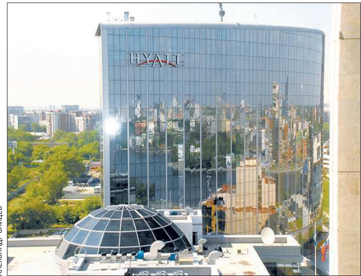
К чемпионату мира по футболу 2018 года даже мировые гостиничные бренды будут вынуждены пройти процедуру классификации

На третьей ступеньке оказалась Санкт-Петербург, где доля отелей высшего уровня — два процента, а количество — 17. Четвёртое место поделили Екатеринбург и Красноярск. Аналитики «2ГИС» утверждают, что у этих городов равенство и по доле пятизвёздочников (два процента), и по числу (четыре).