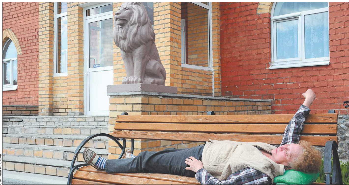
Снять жильё в Екатеринбурге не всем по карману...

То же самое можно сказать и про заграничные товары в наших магазинах. Там даже проще — практически всегда есть отечественная альтернатива. В этом случае нужно больше бояться членства в ВТО, чем колебания курсов валют. По общему уровню инфляции также нельзя сказать, что ослабление рубля как-то существенно влияет на итоговые ценники. Вывод — оснований для паники нет.