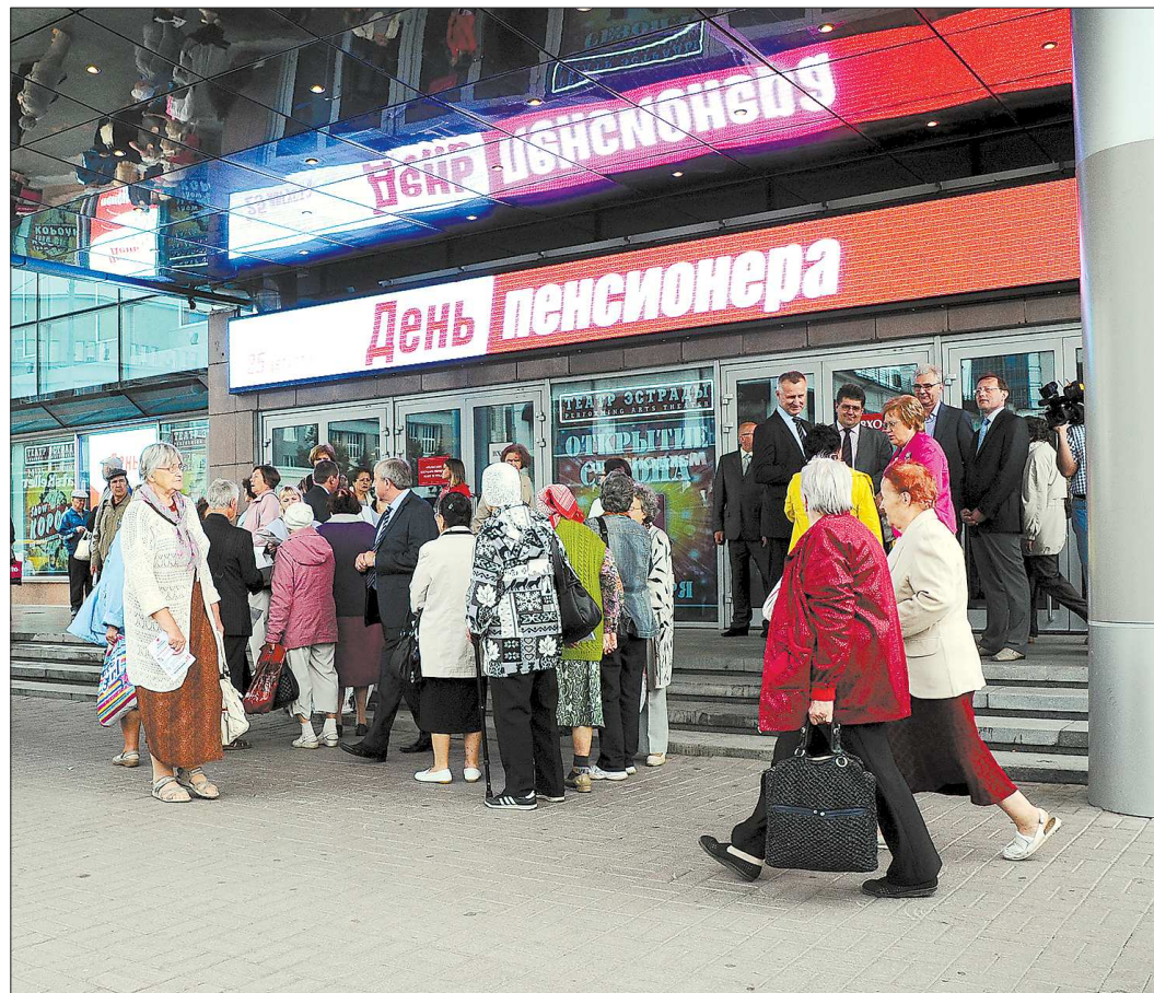
В Свердловской области — один миллион двести тысяч пенсионеров, потому не удивительно, что праздничные мероприятия пользуются таким спросом

С 25 августа и вплоть до 1 октября в нашем регионе для пенсионеров будут проходить бесплатные концерты ведущих творческих коллективов, введена скидка на театральные билеты, предоставлена возможность бесплатного посещения некоторых музеев. Кроме того, будут проходить туристиче-