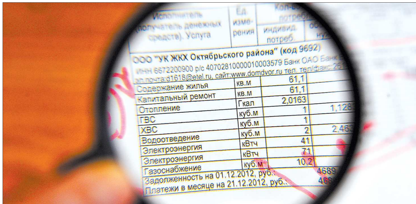
Сейчас вносить средства на капремонт обязаны жильцы лишь тех домов, где на общем собрании было принято соответствующее решение. С января 2014 года платить придется всем