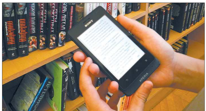
Приложение «ЛитРес: библиотека» поддерживают Apple, Android, Windows Phone, Windows 8

Чтобы на своём опыте убедиться, насколько данная услуга понятна и доступна, я решила воспользоваться новым сервисом. Оказалось, что вариантов получения книг несколько. Например, мне нужна такая-то книга. Захожу в Интернет на сайт «ЛитРес», регистрируюсь и могу читать онлайн с монитора компьютера. Но для этого нужна постоянная связь с Интернетом. Поэтому гораздо удобнее скачать на телефон, планшет или ноутбук приложение «ЛитРес»: библиотекарю и запросить у библиотекаря логин и пароль от личного кабинета, позвонив по телефону или написав личное сообщение на сайте ВКонтакте. В этом случае и без доступа в Интернет можно читать выбранные книги. Одно важное условие: через две недели, когда срок выдачи истекает, книга исчезает с устройства. Продления как такового нет, и если не успел прочитать, то придётся взять книгу снова — такая вот страховка от пиратства.