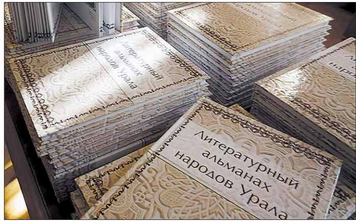
Альманах – первый, но не единственный. Его выпуск должен стать хорошей ежегодной традицией и постепенно охватить творчество всех народов, проживающих на территории области