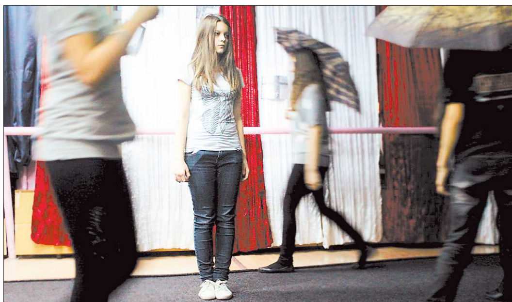
Спектакль «Ты – это я» создавался на основе историй, рассказанных ребятами. Главная героиня чувствует себя одинокой и непонятой, но оказывается, что всему виной – её равнодушие. Несколько раз она проходила мимо тех, кому нужна помощь. И осталась одна