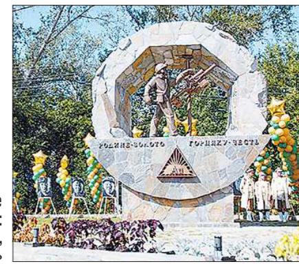
На монументе высечены слова: «Родине — золото, горняку — честь»