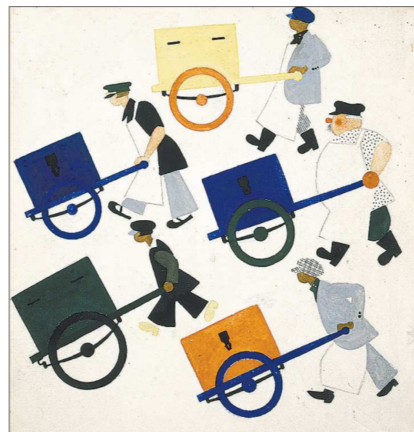
Картинка «Мороженщики» к книге Самуила Маршак «Мороженое»

Владимир Лебедев (1891–1967) — русский советский живописец, признанный мастер плаката, книжной и журнальной иллюстрации, основатель ленинградской школы книжной графики. Народный художник РСФСР, член-корреспондент Академии художеств СССР.