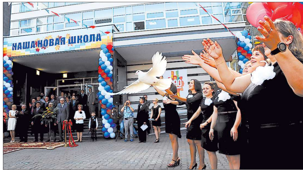
На строительство школы №19 потрачено 677 миллионов рублей, 328 миллионов из них выделены из областного бюджета

Пару месяцев назад «ОГ» рассказывала о том, что Яков Силин наведёлся в Академический с проверкой будущих детских садиков (помним, что и они, и школа строились при активной поддержке со стороны области). Тогда у вице-губернатора возник ряд замечаний к строителям, в частности, речь шла об отделочных работах. Вчера мы убедились лично — все недочёты в итоге устранены и оба детских са-