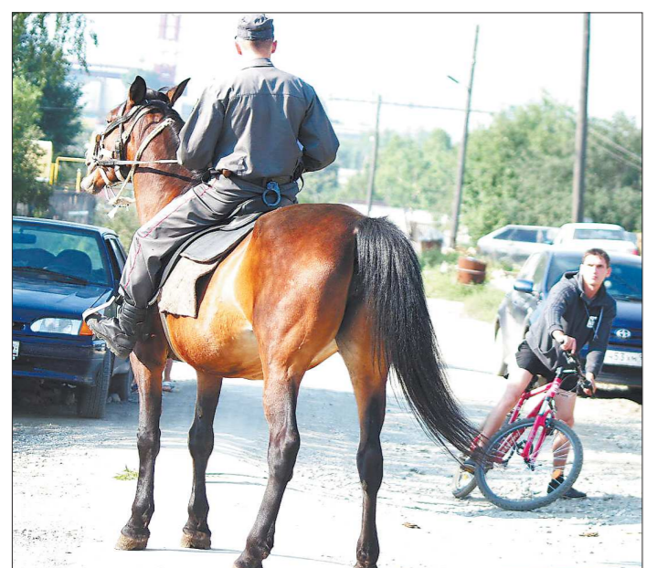
Конное подразделение полиции в Первоуральске — единственное в области. Аналогичное подразделение в Екатеринбурге расформировали в 2009 году. Не потерпились ли? Конные патрули, возможно, пригодились бы на чемпионате мира по футболу

— Событие очень важное, и не только для Екатеринбурга, но и для всей Свердловской области, потому что это наглядный пример того, как у нас в регионе и в наших муниципалитетах реализуется приоритетный национальный проект «Образование», — отметил Евгений Куйвашев, поздравляя педагогов, родителей и учеников.