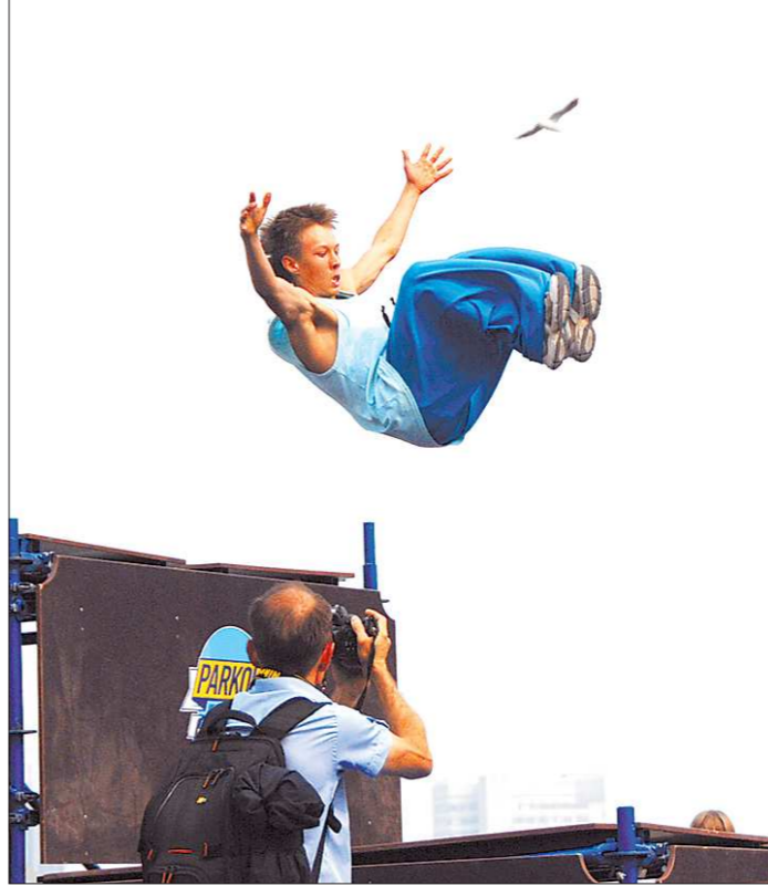
Уровень сложности некоторых упражнений не ниже, чем у профессиональных акробатов и эквилибров в цирке