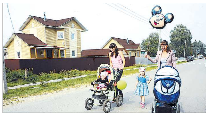
В таких новостройках сейчас живут переселенцы из ветхого жилья и льготники. Не исключено, что вслед за ними подобные домики будут строить и для молодых семей

здешнее мужское население. И зарплата, похоже, не обижает – почти в каждом втором дворе – автомашина. С чёрными от времени деревянными двухэтажными барачками соседствуют новые домики, возведённые по программам строительства социального жилья. — Будем строить четыре двухквартирных дома для бывших детдомовцев-сирот, – говорит глава Таборин-