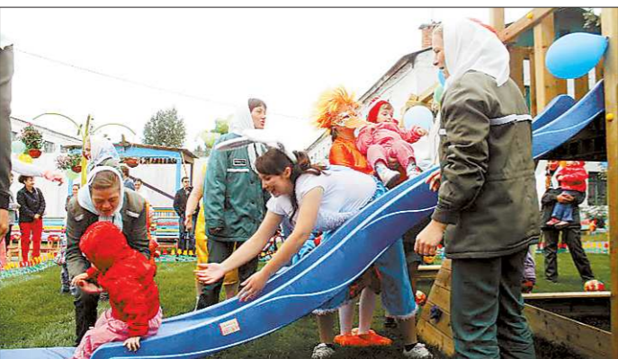
Не все матери в нижнетагильской колонии выходят на ежедневные прогулки со своими детьми. А нередко бывает и так, что от детей при освобождении отказываются вовсе

Прямо на новой площадке малышам показали спектакль «Репка». Место проведения театрализованного представления выдала только одна зелёная форма и белая платки мам. Да ещё их