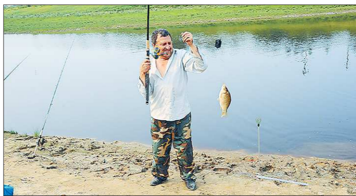
С водоснабжением в Таборах, увы, неважно. А вот отдохнуть и порыбачить можно хоть на Тавде, хоть на впадающей в неё Тавдинке

несколько лет так отказалось от угля и даже не думает вести сюда природный газ, чтобы не пополнять списки должников перед поставщиками. От места будущих новостроек В. Роененко ведёт нас туда, где работают дорожные строители. Сразу на трёх улицах до конца года должно появиться асфальтовое покрытие, а число асфальтированных сельских артерий удвоится – три улицы в Таборах были за-