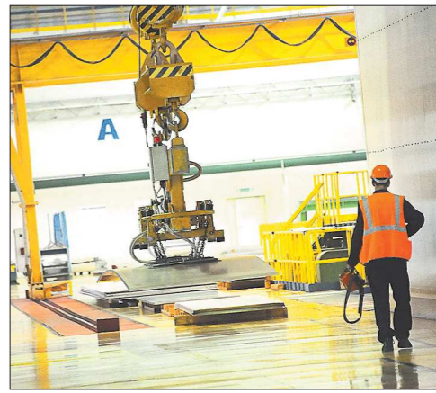
В действующем новом цехе термомеханической обработки листов и плит для авиакосмической отрасли

Расчётные налоговые поступления в бюджет области и муниципального образования город Каменск-Уральский за период с 2016 по 2020 год составят более 9 миллиардов рублей. А министр экономики региона Дмитрий Ноженко уточнил, что конкурсный отбор на получение субсидий предполагал целый ряд критериев. Прежде всего интересные проекты, направленные на развитие технологий, имеющие важное социально-экономиче-