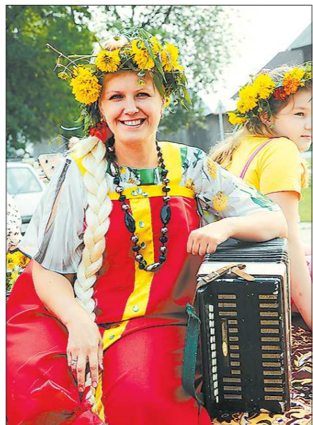
Карнавалы в селе Таборы. Карнавалы сельские рукодельницы шили и мастерили собственноручно