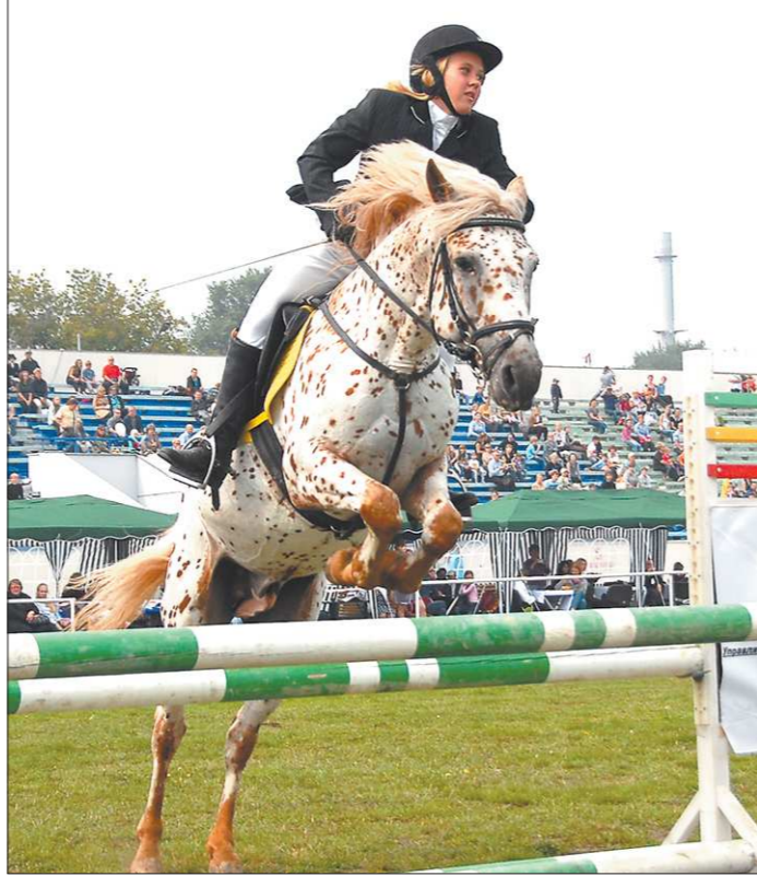
Высота барьеров зависит от разных параметров, например, от опыта, возраста и квалификации наездника и породы лошади

Коротич планировал сделать более двух сотен полных и полуполных иллюстраций, сюжетные заставки для каждой главы. Первые работы были представлены на выставке в Московском архи-