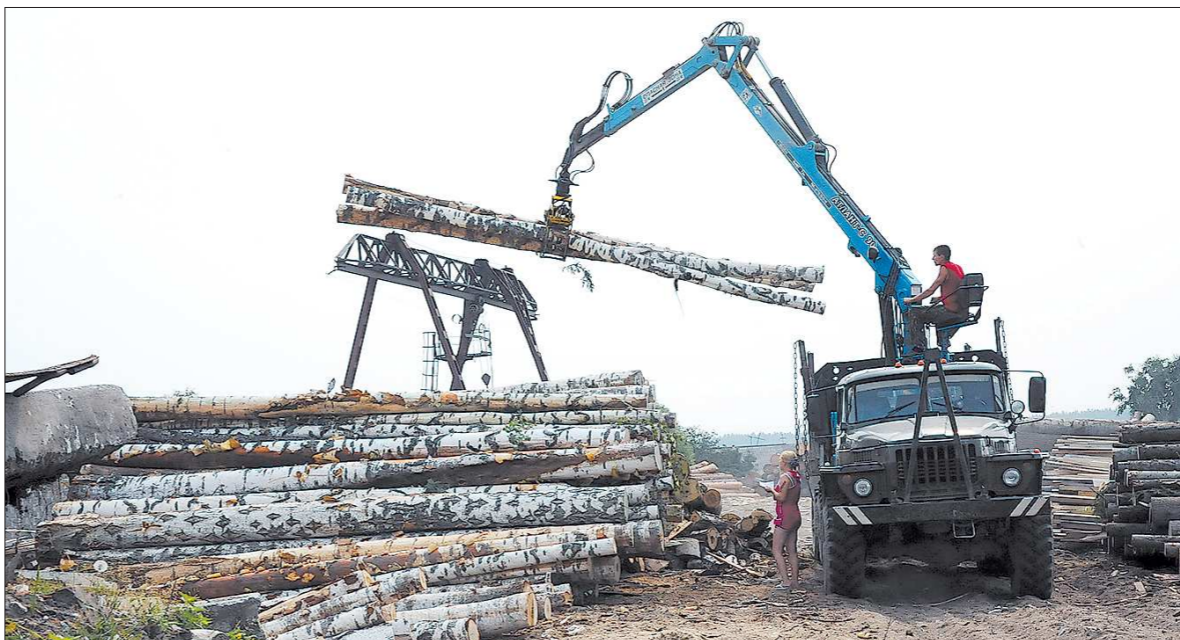
В отличие от женщин, для которых в селе работы практически нет, местные мужчины без дела не скучают. Летом, по словам главы района, зарплата на пилораме – порядка 15 тысяч, а зимой она доходит и до 60 тысяч

здешнее мужское население. И зарплата, похоже, не обижает – почти в каждом втором дворе – автомашина. С чёрными от времени деревянными двухэтажными барачками соседствуют новые домики, возведённые по программам строительства социального жилья. — Будем строить четыре двухквартирных дома для бывших детдомовцев-сирот, – говорит глава Таборин-