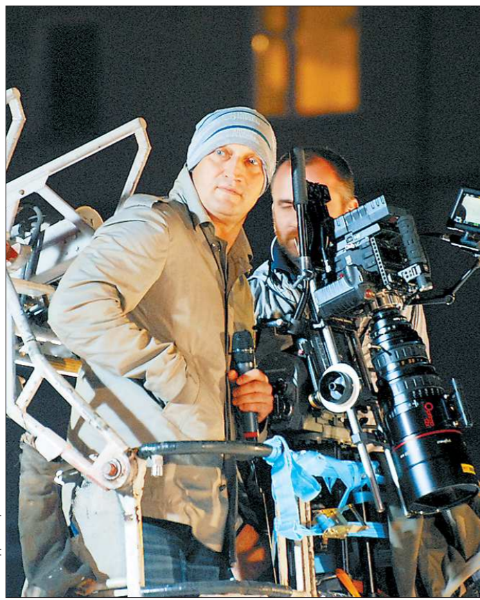
Свести с ума Гошу Куценко могут только красивые уральские женщины

На исходе прошедшей недели в Екатеринбурге снимали несколько эпизодов к фильму «Ёлки-3» (продюсер Тимур Бекмамбетов). Для правдоподобия на площадке перед одним из торговых центров на западной окраине города установили пятнадцатиметровую, как положено, нарядную, новогоднюю ёлку и засыпали близлежащую территорию искусственным (то есть, наобороч, совершенно шуточным) снегом.