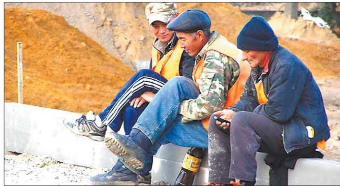
По данным УФМС по Свердловской области, на территории Среднего Урала сейчас находится порядка двухсот тысяч иностранных рабочих

± / - -- рост / падение по отношению к предыдущему показателю