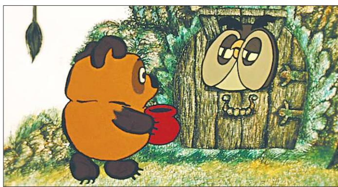
На пасеку косолапого больше не пустят. Придётся попытаться счастья в другом месте

Житель деревни Крюк в Шалинском городском округе был немало озадачен, когда во время очередного визита на пасеку, что расположено в нескольких километрах от населённого пункта, недосчитался трёх ульев. Пропажа была обнаружена неподалёку в лесу. Два улья оказались почти невредимы, а вот третий – напротив разворочен, рядом были разбросаны пустые рамки – мёд из них исчез вместе с воском. Долго гадать, кто учинил разор, не пришлось. Опытный охотник без труда определил, что пчелиные дома утащил медведь (и ведь какой запасливый!). Хозяйству нанесён двойной урон: не досчитались пчели-