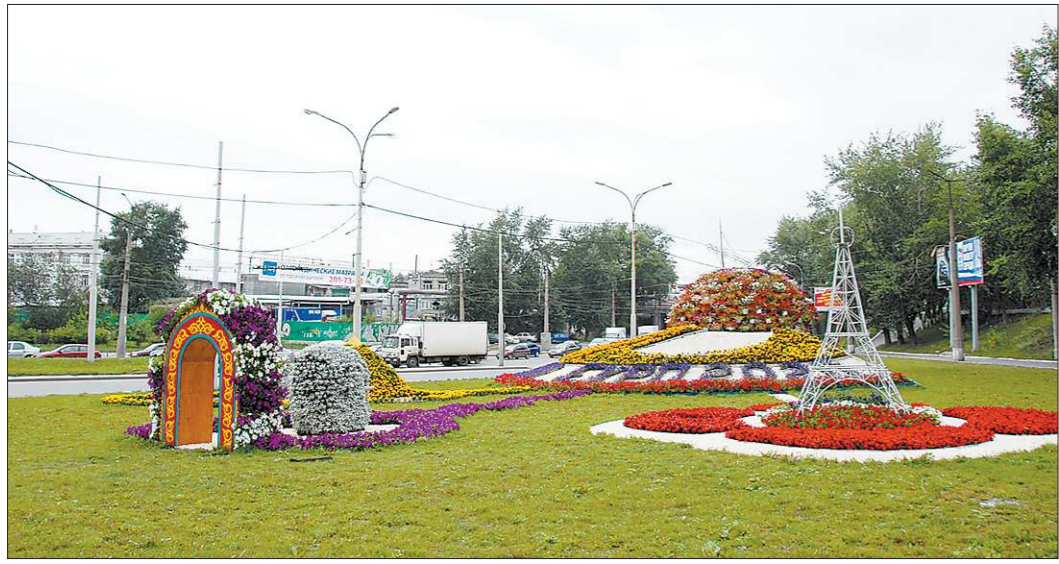
В конкурсе на лучшее цветочное оформление Екатеринбурга, объявленном главой администрации Александром Якобом, участвуют все районы города. Цветники и клумбы могут быть оформлены как руководством района, так и предприятиями, компаниями или частными...