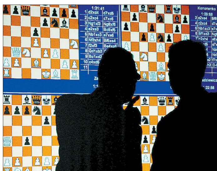
В кулуарах командного чемпиона мира по шахматам среди женщин, состоявшегося в Екатеринбурге. 12 марта 2006 года