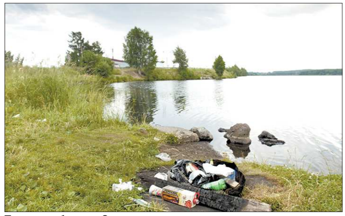
Теперь рыбаки на Северском водохранилище предпочитают не столько рыбу удить, сколько «чисто расслабиться»: мол, это безопаснее для здоровья