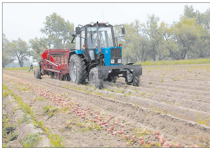
Сейчас картофелеводы мечтают о том, чтобы и в период уборки погода была так же к ним благосклонна