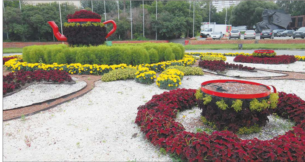
лицами. Правило первое — цветник должен вписаться в окружающий ландшафт. Здесь, кажется, всё в порядке (на снимке справа) — круглой форме площадки Субботников соответствуют окружности цветочных «чашек» и «блюдец»