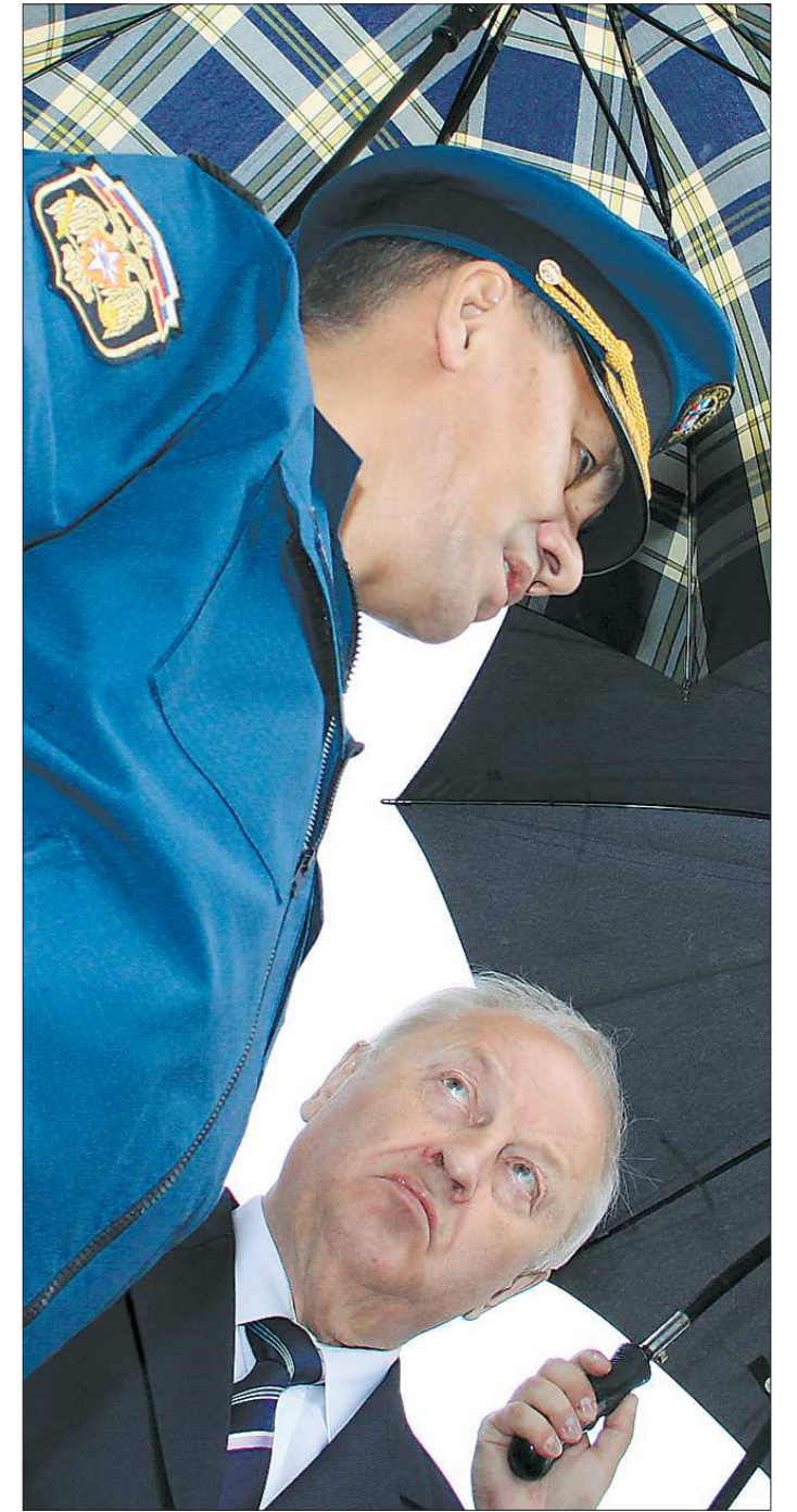
На тот момент глава МЧС Сергей Шойгу и губернатор Свердловской области Эдуард Россель на выставке пожарной техники и оборудования в Екатеринбурге. Июль 2009 года