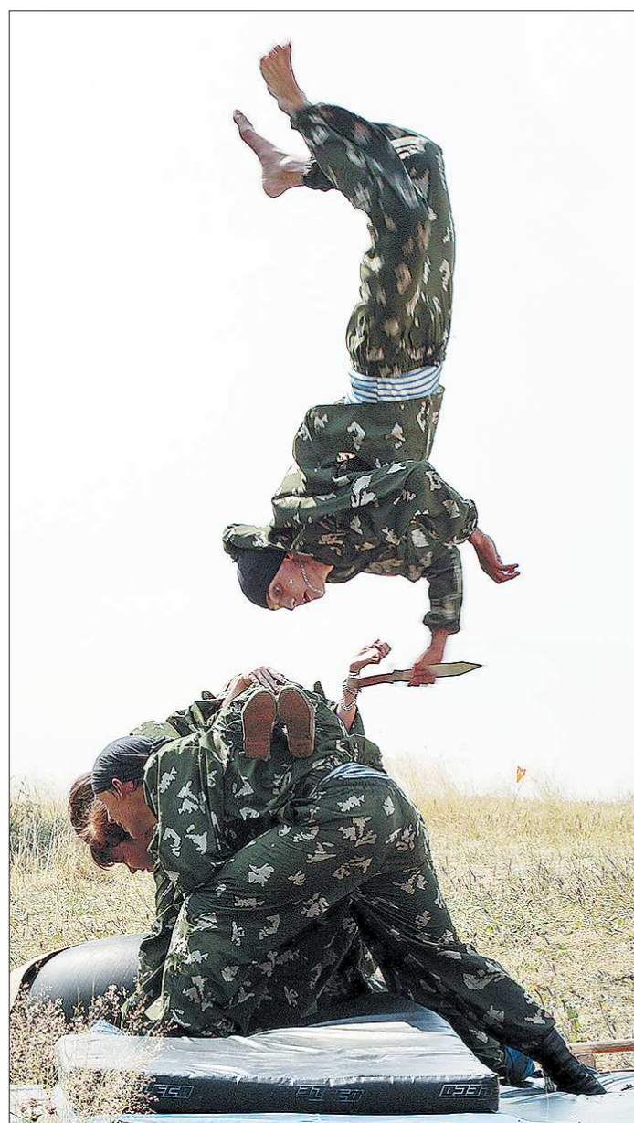
На праздновании Дня ВМФ воспитанник первоуральского подросткового клуба «Саланг», перепрыгивая в лихом салто через группу «однополчан», забирает кинжал из рук девушки, лежащей на спинах своих товарищей