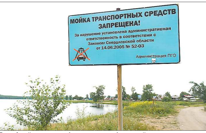
Подобный запрет на фоне катастрофической ситуации с экологией Северского водохранилища вызывает у полечкан лишь горькую усмешку