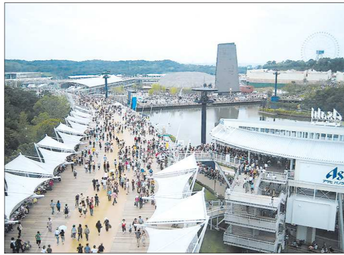
Первоначально рассчитывали, что за полгода работы ЭКСПО-2005 посетят около 15 миллионов человек. Просчитались, итоговая цифра превысила 22 миллиона

Далее, подгруппа задач — взаимодействие со странами-участниками ЭКСПО. То есть надо будет синхронизировать наши локальные проекты с их международными компаниями, которые будут строить свои павильоны и экспозиции. И учесть при этом их порядки и менталитет. Вторая — вся эта созданная для проведения выставки инфраструктура должна жить и давать результат после ЭКСПО. Выставка идёт полгода, что потом делать с этим количеством гостиничного фонда, транспортной системой, общепитом и прочими созданными объектами, как не растерять этот огромный потенциал, который получил город и область? Что делать, например, с тем же малым бизнесом, который ошутит гигантский (но временный!) всплеск туристического нашествия? Третья — надо использовать выставку как большой драйвер развития не только Екатеринбурга, но и всего региона. Полгода внимания всего мира (в том числе,