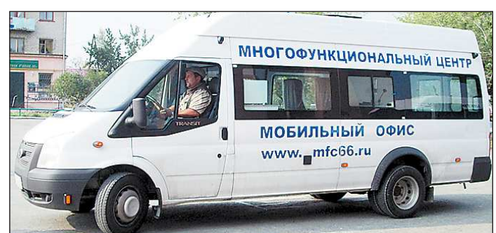
В отдалённых территориях области госуслуги можно получить с помощью мобильных офисов МФЦ

Для того чтобы информация от органов регионально-государственного управления стала более открытой и доступной, была разработана тестовая версия сайта «Открытое правительство», а также запущен в эксплуатацию портал «Открытый бюджет Свердловской области» info.mfural.ru/ebudget .