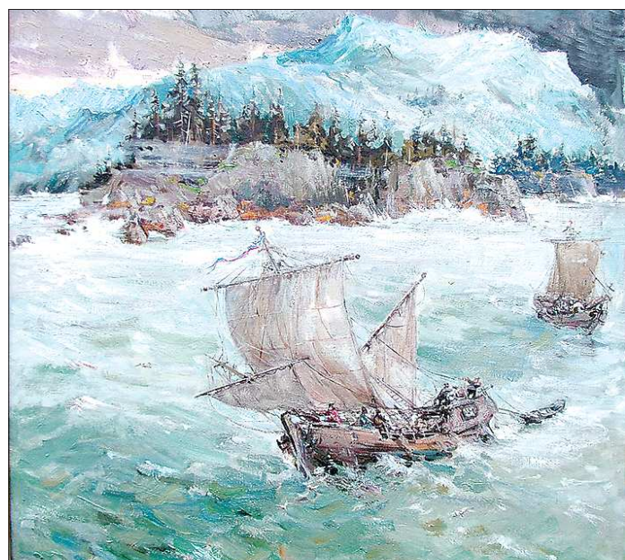
Купеческие корабли у берегов Аляски

даёт подробные ответы на многие из этих вопросов. Свод романов – прекрасное художественно-познавательное исследование, полезное и «юноше, начинающему жить», и взрослому читателю. Диву даёшься, сколько же надо было иметь времени и терпения автору, недавно ставшему к тому же доктором культурологии, чтобы в архивных фондах отыскать и изучить желаемые первоисточники, расшифровать многие загадочные документы, и не побоюсь сказать, ещё и сделать при этом собственные исторические открытия, освещающие белые пятна в истории пребывания русских на Аляске!