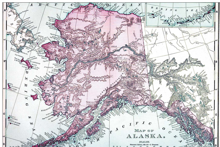
Карта Аляски. XIX век

метка» (роман, завершающий свод книг о Русской Америке, посвящён как раз тому непростому периоду, когда Россия впервые в своей тысячелетней истории добровольно уступила свои земли другому государству).