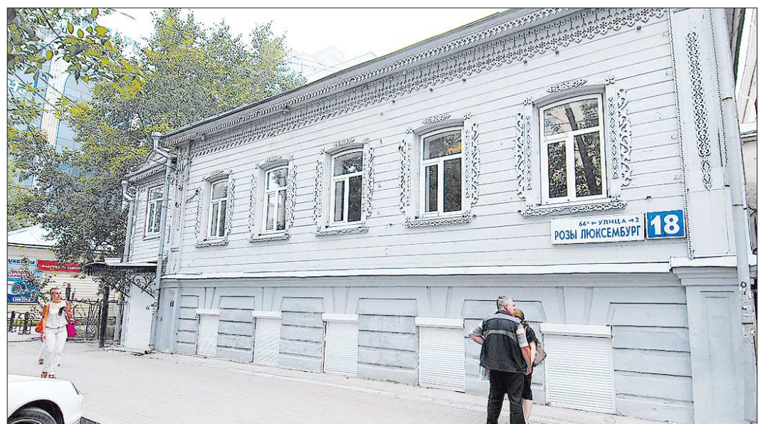
Здание на ул. Розы Люксембург, 18 прекрасно сохранилось. Попадание в реестр поможет поддерживать его исторический облик

«Многоплановое историческое полотно густо населено самими разными героями: это представители нескольких поколений, различных социальных слоёв. Люди многих национальностей. Цари, господа, солдаты, генералы. Учёные, священники, матросы, отважные сыны России. С другой стороны – камчадалы, алеуты, индейцы, корсары, перекулишки мехов... У каждого из них свои интересы и стремления, зачастую противоречивые. Казалось бы, в этом хаосе совершенно невозможен единый вектор общего движения. Но могучая историческая логика развития государства, «поверх головы», а точнее, поверх судеб действующих лиц, слетает весь этот хаос в единый пассионарный поток, по-