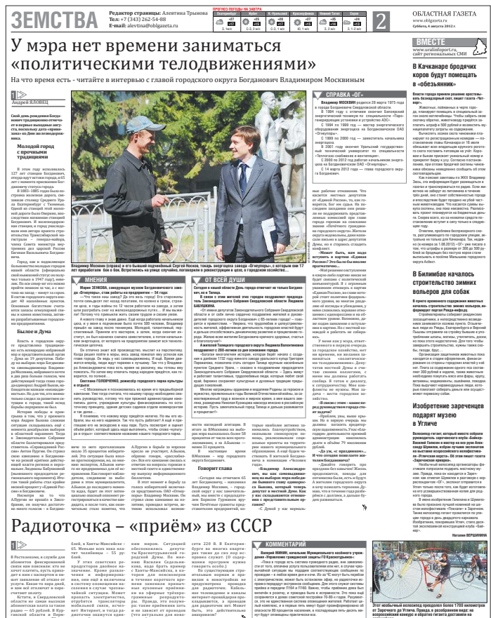
4 августа 2012 года – полоса «Земства» впервые вышла в свет. Днём раньше эта страница называлась «События»

– «Земства» – дело новенькое, интереснее. На фоне официальной, деловой газеты эта страница выделяет-