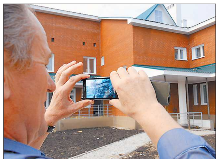
«Ручной» контроль уже в следующем году должен стать историей