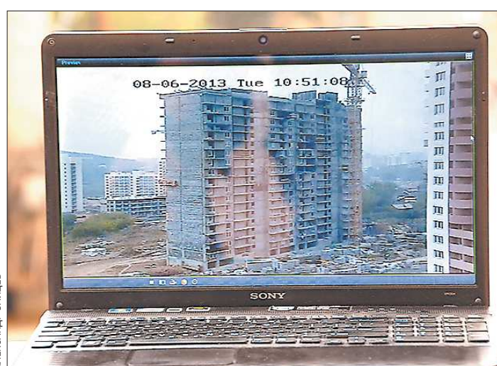
Эта стройплощадка Екатеринбурга уже не нуждается в еженедельном приезде контролирующих органов