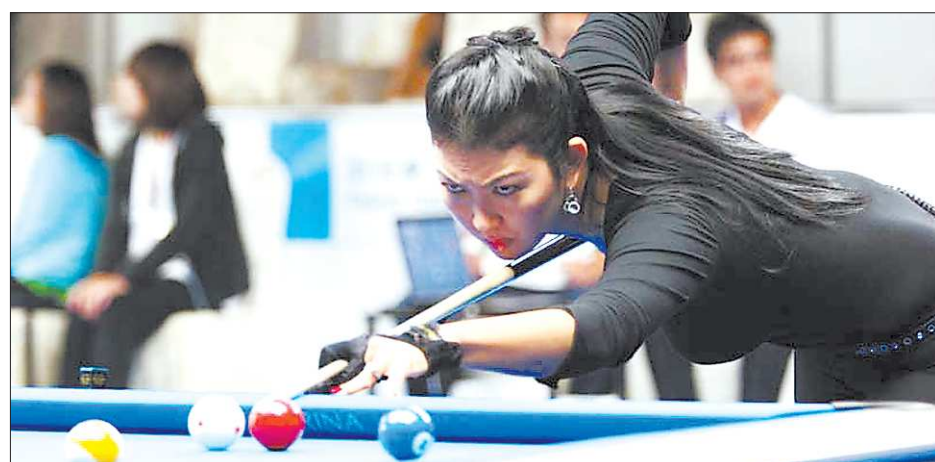
В программу Всемирных игр входит несколько дисциплин, которые многие и за спорт-то не считают: например, перетягивание каната или бильярд

– В лазании на трудность чемпион мира среди юно-