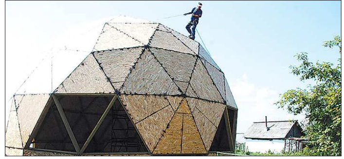
Говорят, аура здания будет схожа с той, что создают пирамиды