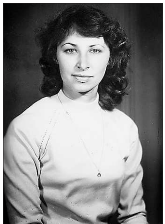
Ирбит. Юность. Всё только начинается...

Она и представить не могла, какой тяжёлый воз на себя взвалила, став заместителем директора. Это не только производство, экономика и финансы, но и социальная сфера. Фактически пришлось