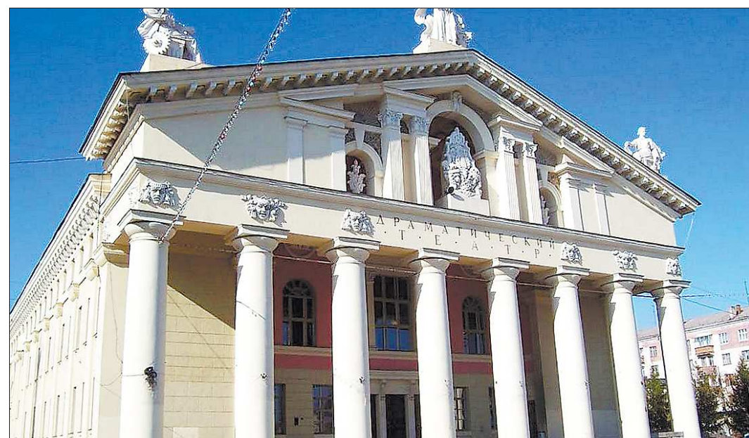
Шестьдесят лет назад государство подарило рабочему городу театр за трудовую доблесть в военные годы. Новый подарок тагильчане получат уже за мирный труд