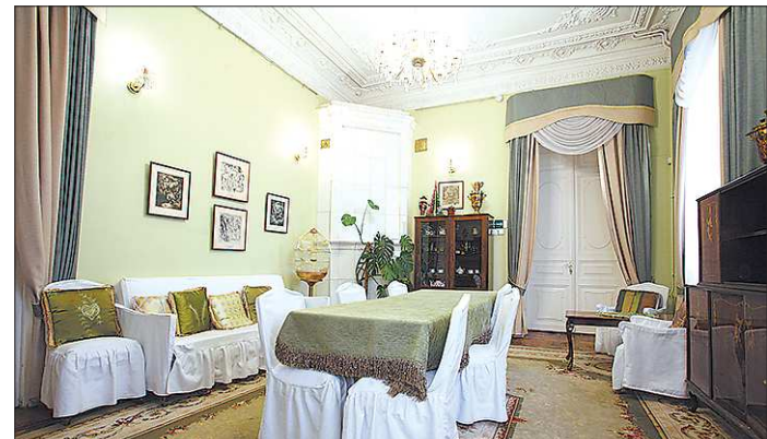
Современный интерьер Салатной гостиной Дома актёра. Фото 2013 года