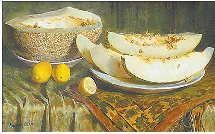
Даром, что рисованная