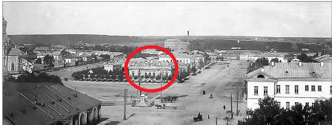
Вид Уктусской улицы (ныне – 8 Марта). Дом Тупиковых без верхнего этажа. Обратите внимание – памятник Александру II уже снесли, а постамент остался. Значит, фотография сделана в промежутке между годами 1917-м и 1920-м

* Проект выходит ежедневно по четвергам. Начало в № за 25 июля