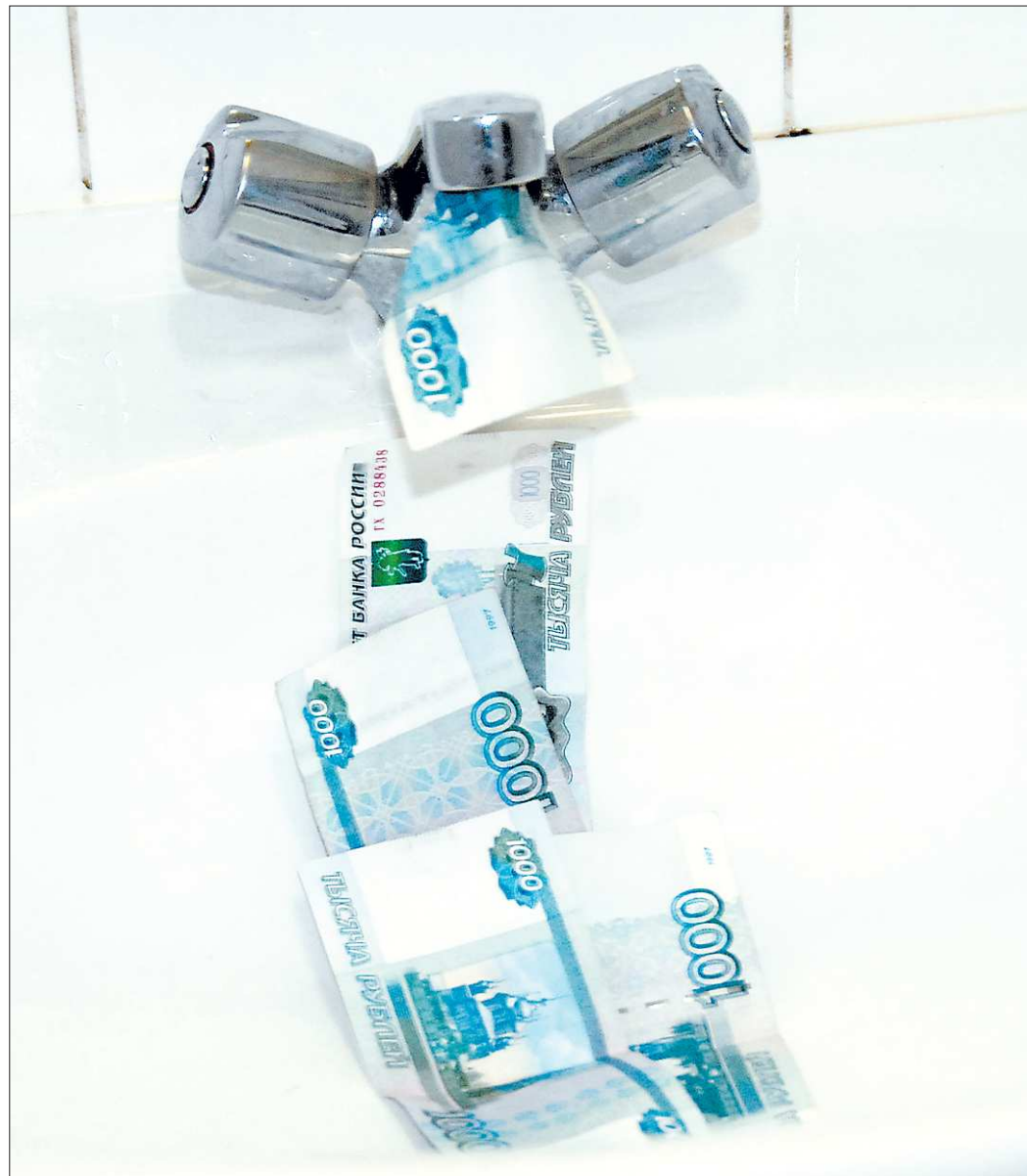
Порой вместе с водой утекают наши деньги: завышение тарифа на услуги водоснабжения — одно из типичных нарушений

Так, на кулинарную продукцию собственного производства наценка, вместо 60 процентов, составляла от 68 до 134 процентов. На покупные товары размер наценки составлял 60 процентов вместо 20. К примеру, чай «Грифино» поступил на склад по цене 1,66 рубля за пакетик, при реализации цена составляла 2,66 рубля. Сумма