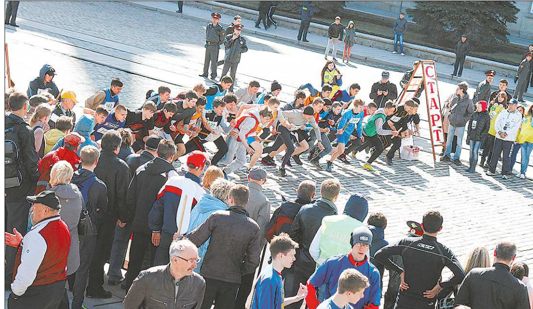
Легкоатлетическая эстафета «Весна Победа» – одно из знаковых событий Свердловской области, превращающее в спортплощадку центральные улицы Екатеринбурга

Во-вторых, если обратиться уже непосредственно к делам местным, министерство физической культуры, спорта и молодёжной политики Свердловской области только ленивый не упрекнул в чрезмерном увлечении спортом высших достижений в ущерб детско-юношескому спорту. Однако цифры говорят об обратном.