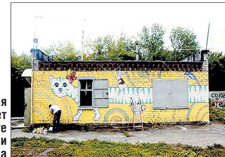
Эта симпатичная кошка теперь будет «гулять» вместе с воспитанниками детского дома