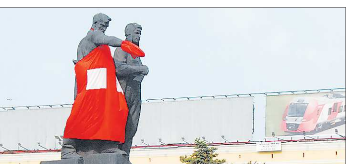
За всю историю этого известного монумента такого с ним ещё не случилось

Первым рассказал о планах своего ведомства министр социальной политики Андрей Злоказов, подчеркнув, что указывался на Широкореченском кладбище. Общественники отвергают такое предложение, считая что площадь Обороны исторически связана с погибшими на полях сражений.