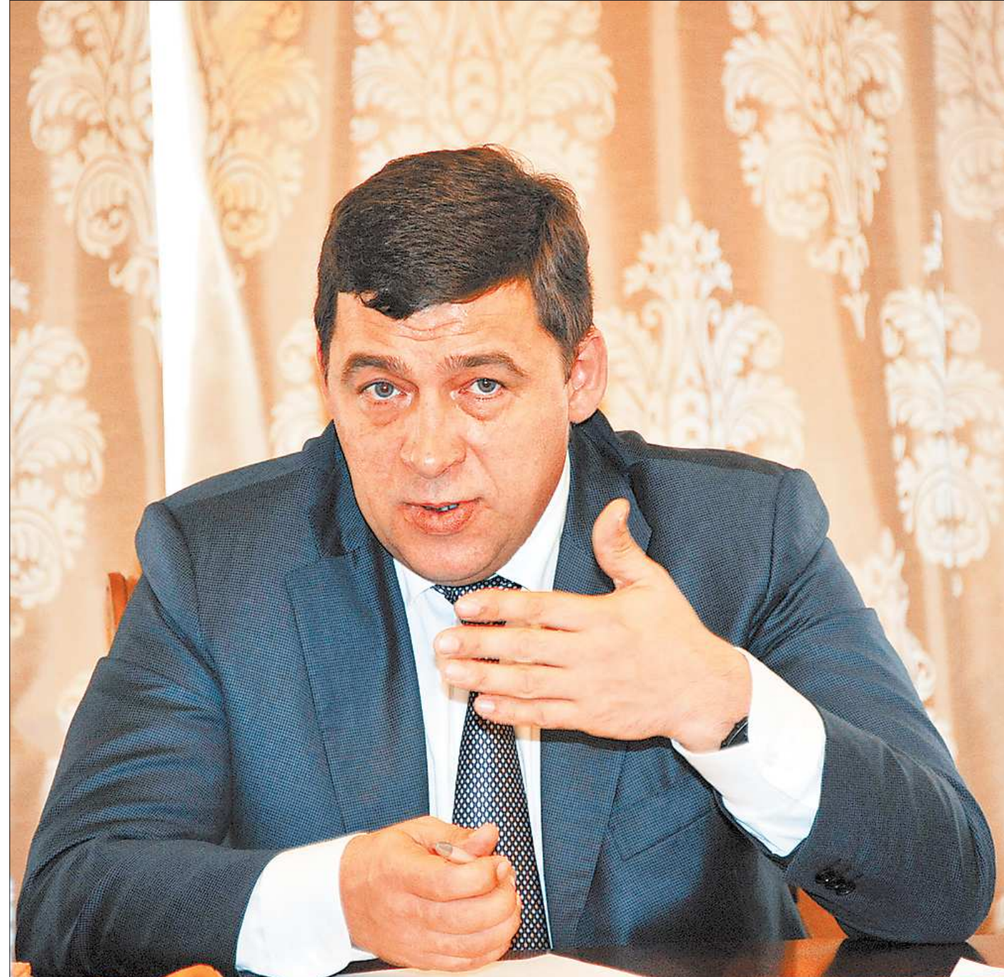
С последней аналогичной встречи Евгения Куйвашева и журналистов прошло около трёх месяцев - беседы с главой региона за чашкой чая уже стали традицией. Показательно, что участие в них принимают представители СМИ, самых разных по своему отношению к власти