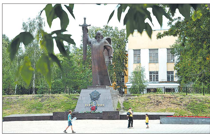
Памятник «Седой Урал» стоит на площади Обороны в полном одиночестве