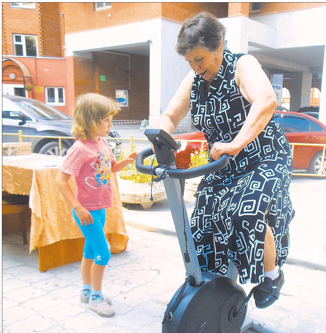
Спортивные и оздоровительные мероприятия стали очень популярны среди пенсионеров Екатеринбурга. Во время проведения месячника к спорту прибывают и жители глубинки

нарушений в сфере обеспечения жильём детей-сирот и детей, оставшихся без попечения родителей. В целях их устранения принесено 142 протеста, внесено 36 представлений, в суды направлено 973 иска. Только Серовской городской прокуратурой в прошлом году предъявлено 45 исков в интересах этой категории граждан, которые не имели закрепленного жилья и были вынуждены арендовать жилые помещения или проживать где придётся. Надеюсь, законодательные изменения будут способствовать наведению порядка в этой области. По крайней мере, условия для этого созданы. Прокуратура же по-прежнему будет жёстко контролировать исполнение закона, отстаивая права сирот.