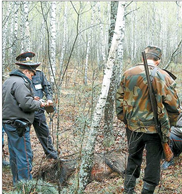
Картина ясная — браконьеры пойманы с поличным

А если серьёзно, то нарушений выявлено много. Всего составлено 759 протоколов об административной ответственности, из них 310 — за различные нарушения правил охоты, 204 — за пребывание в угодьях без разрешительных документов, 104 — за прегрешения помельче, вроде провоза незачехлённого оружия, охоты на утку, скажем, с подхода, а не из укры-