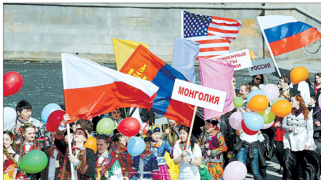
Свердловская область ежегодно принимает более 300 тысяч зарубежных гостей

Отмечалось, что Средний Урал — это один из самых многонациональных регионов России, здесь проживают представители около 160 национальностей. В муниципальных образованиях Свердловской области созданы и работают 108 национально-культурных объ-