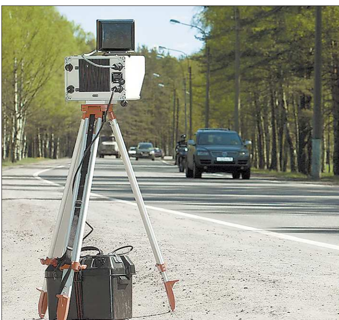
Выносные радары сотрудники ГАИ-ГИБДД ставят на самых аварийно опасных участках и лихам от их зоркого объектива ни скрыться