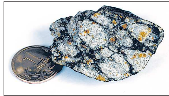
Полированный срез обломка метеорита

и не обнаружили, метеоритного вещества тоже не найдено, да и взрыв был в воздухе такой, что от взрывной волны деревья были повалены на площади около двух тысяч квадратных километров... Но именно падение Челябинского метеорита доказало, что всё это возможно и с обычным метеоритом: там тоже была мощная ударная волна и никаких кратеров также не найдено... Что же касается метеоритного вещества, которого в случае с Тунгусским метеоритом так и не нашли, то это теперь тоже можно объяснить: состав метеоритов