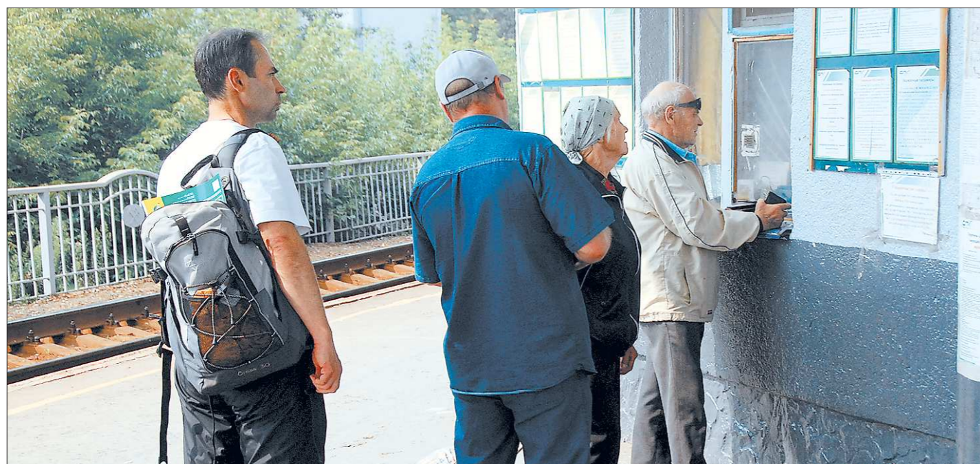
Когда железнодорожники наконец составят свой реестр, на удостоверение каждого льготника нанесут персональный штрихкод. И больше никаких талонов!