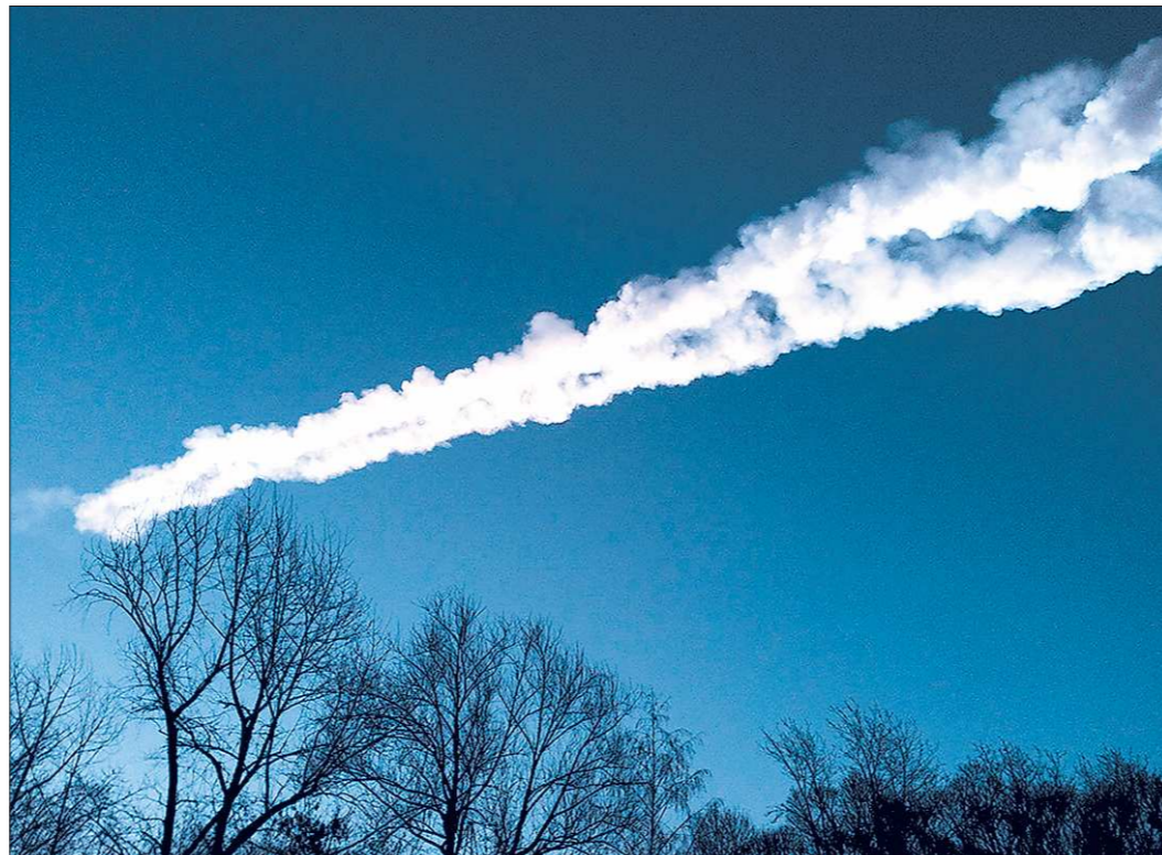
Болид в небе отчётливо был виден на территории Свердловской области

– Видели большую поляну. Предполагают, что на дне Чебаркуля лежит обломок весом 20 или 30 килограммов. Попытались его достать, но оказалось, что там, на глубине, донный ил