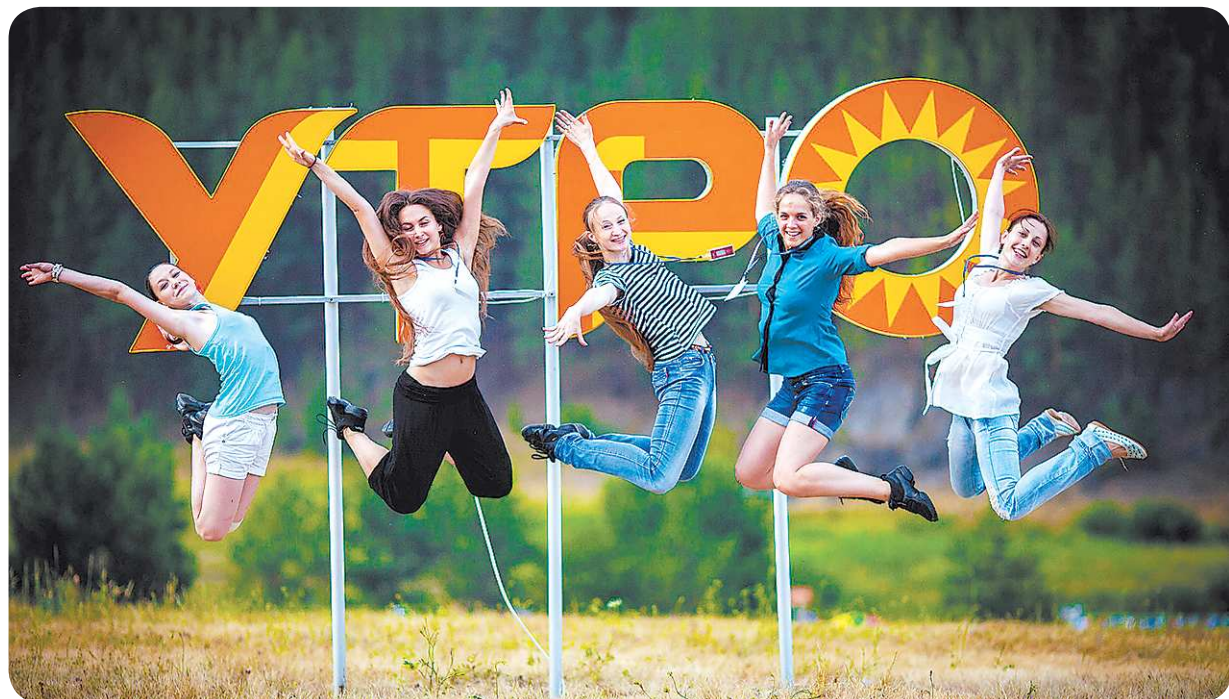
Логотип форума – огромные буквы в центре поляны – стали на эти десять дней популярным местом для фотосессий

Городок, развернувшийся на поляне, масштабнее, чем просто палаточный лагерь. Здесь есть умывальники, душевые кабины, энергетические шкафы,