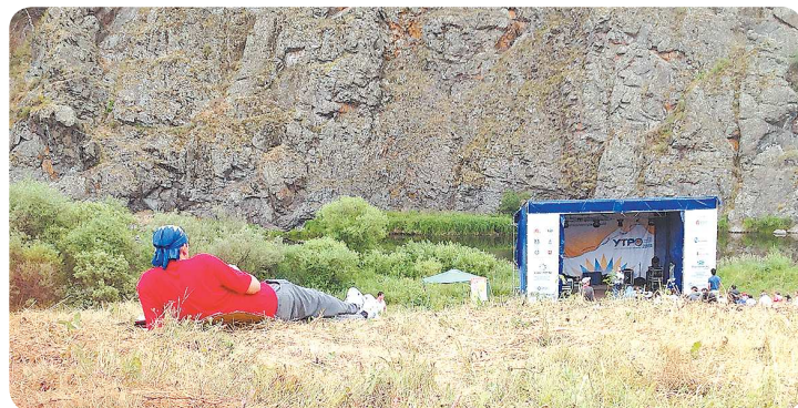
Когда форум проходит на природе, зрительские места можно найти повсюду

– На форуме собрались не просто молодые люди, эта молодёжь прошла конкурсный отбор, и она понимает, куда и зачем приехала. К тому же образовательная программа интересна и насыщена, думаю, валять дурака будет просто некогда. На каждые двадцать человек назначен свой куратор, который не даст спать до обеда