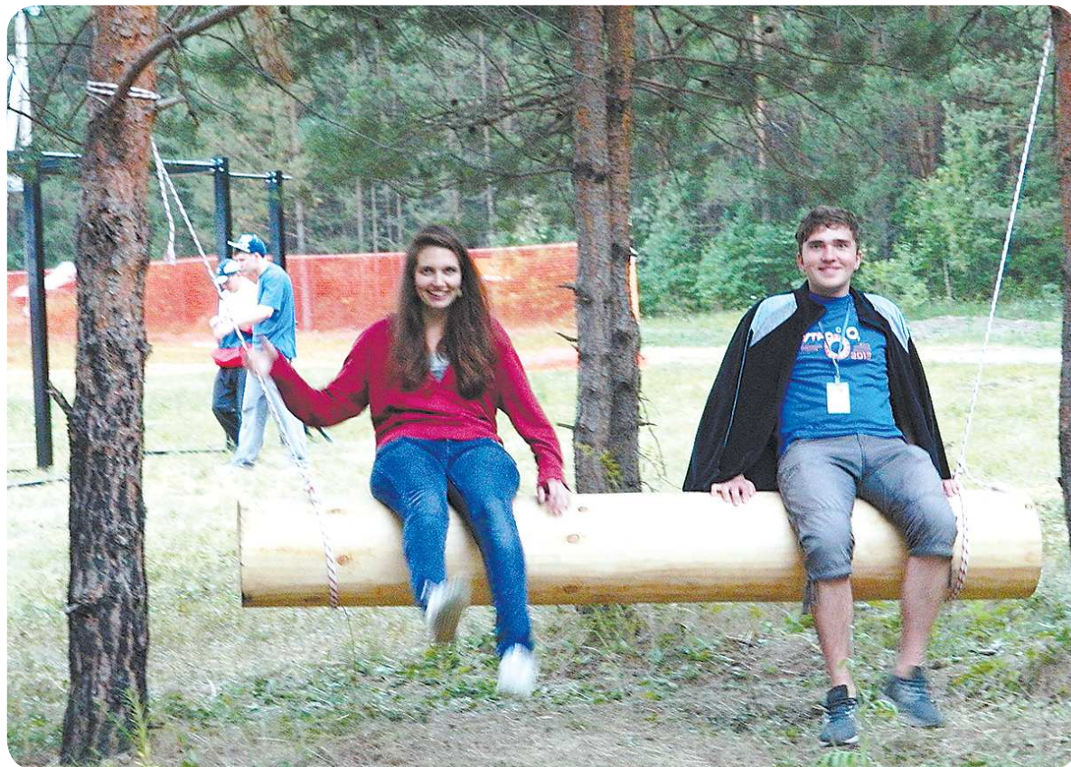
Висящее бревно, на котором должен проводиться донбайский бокс, сразу облюбовали «сладкие парочки»