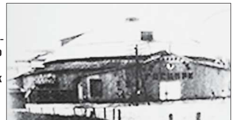
Расположение цирка на берегу реки местным властям показалось неудобным

В 1930 году на Хлебной площади был открыт стационарный цирк. Это был первый государственный цирк в Свердловске.