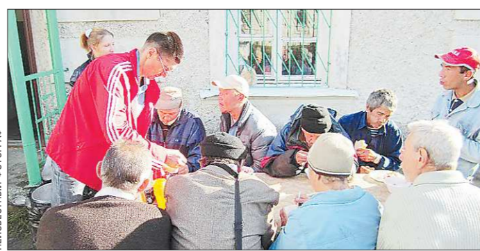
В последнее время на обед в этот центр приходят и малообеспеченные ревдинцы

Это не к столу, конечно, будет сказано. Но, с другой стороны, разговоры под благотворительные пельмени вряд ли ведутся о высоких материях. Скорее всего, о рубашке, которая ближе к телу.