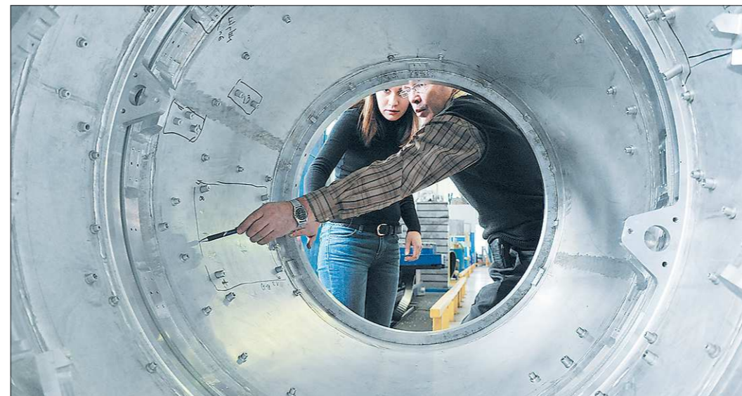
Государство обязуется за свой счёт готовить металлургов, электротехников, энергетиков — поэтому и конкурс на эти специальности будет ниже

В целом, нововведение на общее количество бюджетных мест в свердловских вузах не повлияло. Примерно 10 600 новых бюджетных студентов поступят нынче учиться за счёт го-