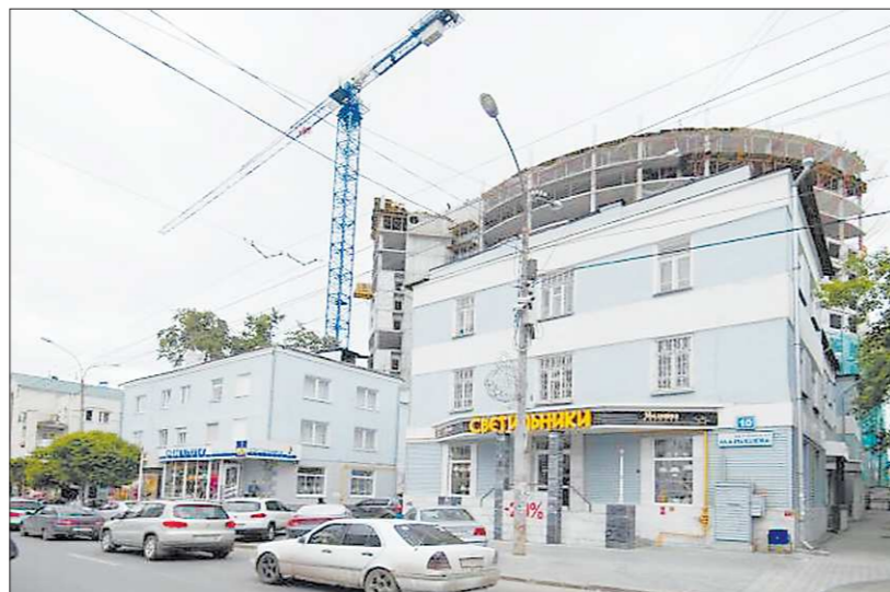
Претенденты на снос — аккуратные трёхэтажки на улице Малышева. Если их уберут, улицу, скорее всего, задавят очередная высотка

Вчера, ознакомившись с программами развития городского округа, которые представили кандидаты, депутаты должны были вновь выбрать главу администрации. Но... Не решились? Не захотели? Сложившаяся ситуация, иначе как кризисной, не назовёшь.