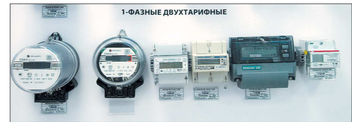
После 1 ноября многотарифные счётчики, запрограммированные на зимнее и летнее время, превратятся в однотарифные

Перепрограммировать прибор учёта могут завод-изготовитель или региональный центр стандартизации,