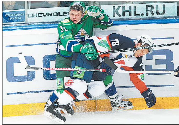
По размеру зарплатных ведомостей «Слован» и «Салават Юлаев» находятся на противоположных полюсах, но противостояния между этими клубами в последнем сезоне закончилось ничью: каждый выиграл по одному матчу

А теперь... последует утверждение, прямо противоположное предыдущему.