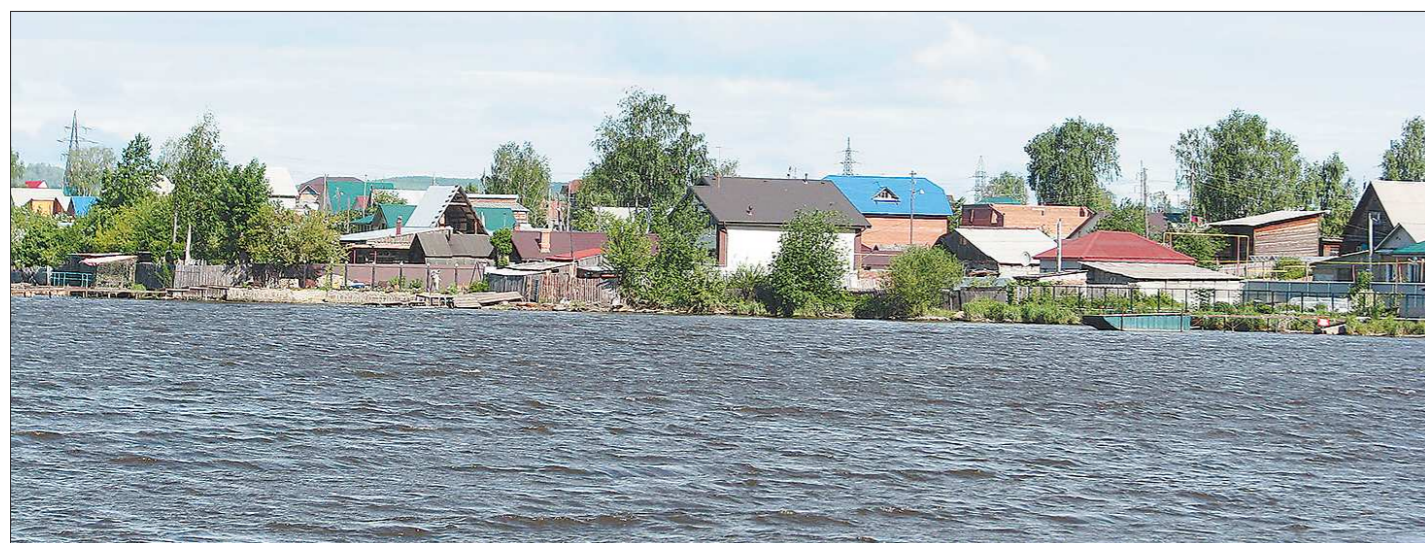
Всё северное побережье Выйского пруда застроено без учёта рекомендаций специалистов управления архитектуры. Иметь дом с собственной пристанью, конечно, заманчиво, но небезопасно

Сейчас он готовит материалы для обращения в прокуратуру с целью «вернуть на доработку» решение народных избранников. И планирует также уточнить, что же является многоквартирным аварийным жилым домом. Несмотря на то, что первый этаж одного из спорных домов занимает агентство недвижимости, верхние квартиры действительно обитаемы. Подходит ли старому особнячку определение «многоквартирный», будут выяснять специалисты.