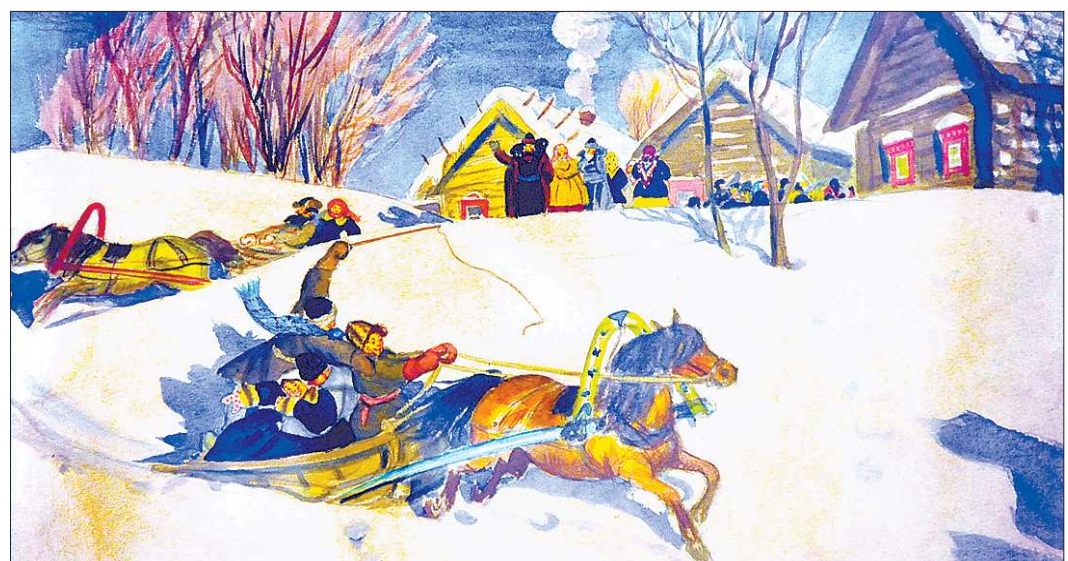
«Масленица» написана в традиционной манере. Открывшаяся выставка показала – Кустодиев может быть другим...

– В съёмочный процесс я не вмешивался – был пару раз на площадке, и всё. Считаю, что задача писателя – создать книгу. Кино – это самостоятельный продукт. Тем более, что я абсолютно доверяю вкусу Велединского. Я даже ещё не видел весь фильм целиком, но те отрывки, которые удалось посмотреть, мне очень понравились.