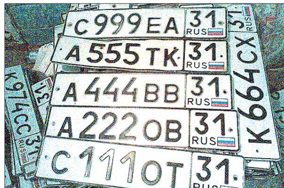
Депутаты предлагают даже больше чем продавать вот таких номеров. Они ратуют за право автолюбителя самому делать спецзаказ на любой знак, только бы в нём не было ругательства

Кстати, во всём мире «крутые» номера продаются легально уже давно. Собранные таким образом средства идут в благотворительные фонды, на лечение детей. В Объединённых Арабских Эмиратах, например, самые элитные номера выставляются на аукцион. Совсем недавно там один молодой человек