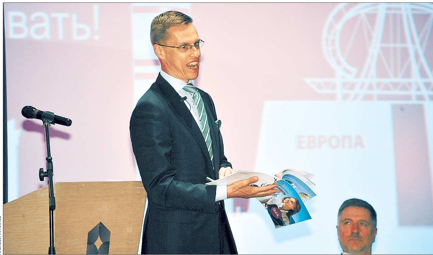
Александр Стубб: «Я впервые привёз на Средний Урал бизнес-делегацию, в которой собраны представители наших компаний самого высокого класса»

Рейтинг Фонда «Петербургская политика» составляется при информационной поддержке агентства «Регнум» и публикуется с осени 2012 года на ежемесячной основе. В его рамках оценивается уровень социально-политической устойчивости во всех субъектах Российской Федерации.