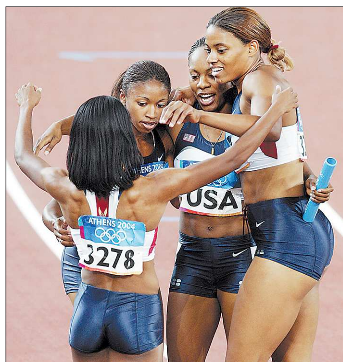
Эстафетная команда США образца 2004 года одержала вторую победу — на сей раз в зале «суда»

— А как вы думаете? — ответ, не требующий комментариев.