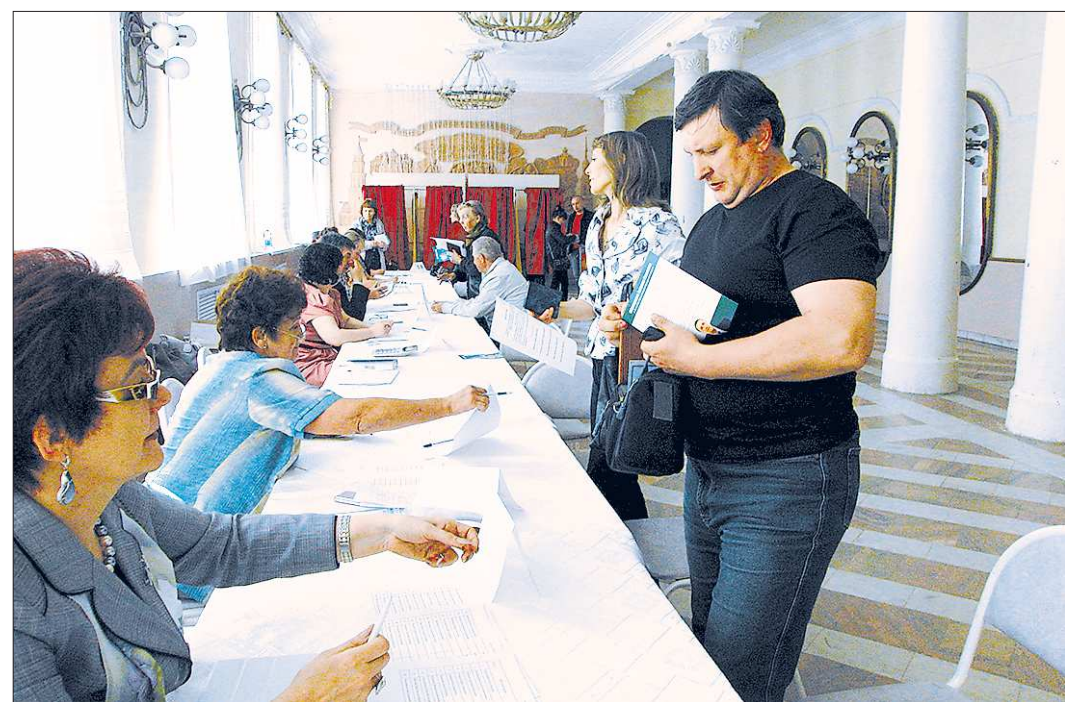
В Невьянске праймериз проходили в будний день, люди пришли проголосовать после смены

Между прочим, в рамках форума «Финский бизнес в Екатеринбурге» уральцы рассказали об ещё одном амбициозном проекте: член Совета Федерации Аркадий Чернецкий представил конкурсную заявку Екатеринбургa на проведение в нашем городе Всемирной международной выставки «ЭКСПО - 2020». А финская сторона провела презентацию своего нового визового центра, который открывается в Екатеринбургe.