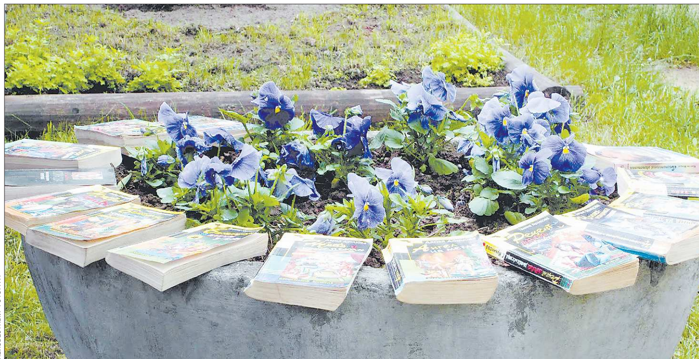
Нередко люди, желая избавиться от ставших ненужными книг, оставляют их просто на улице. И вскоре те обретают новых хозяев

Областная оздоровительная комиссия особо акцентирует внимание на том, что нынче, как и в прошлом году, родители смогут получить компенсацию за собственную организацию летнего оздоровления детей. На эти цели выделено 22 200 тысяч рублей. В зависимости от уровня доходов, семья получит компенсацию от 25 до 90 процентов затрат на путёвку (подробнее читайте об этом в «ОГ» на нашем сайте www.oblgazeta.ru ).