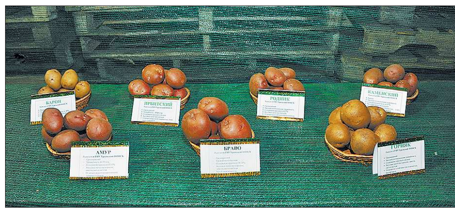
Помимо сортов Барон, Каменский, Ирбитский, предназначенных для возделывания на личных подсобных участках, в арсенале уральских селекционеров есть сорта и для комбайновой уборки — Горняк, Амур, Браво