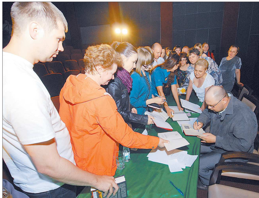
Во время автограф-сессии читатели продолжали задавать вопросы и общаться с писателем. «После ваших книг я не могу читать ничего другого», – сказала одна из поклонниц творчества

– Какие, например? – Меня поразила такая история. Вагоны для метро закупали заранее. И, пока метро строилось, они несколько лет просто стояли на рельсах. А это для них – хуже, чем ездить! Чтобы поезда не рассыпались, рабочие таскали их на верёвке туда-сюда несколько