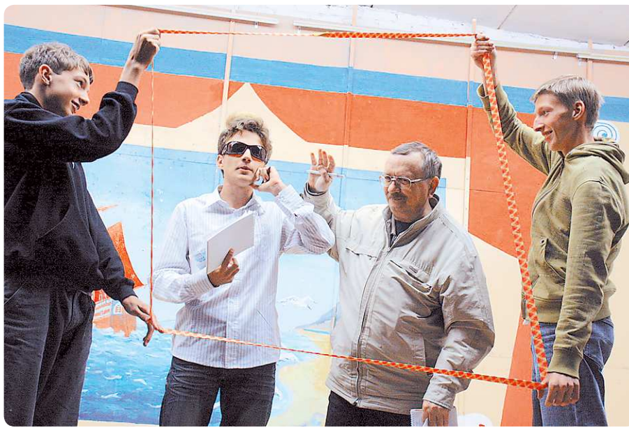
На сборах школьники разыгрывают прямые эфиры. Гости в студии — преподаватели

Сборы предназначены для школьников 12-18 лет, которые интересуются журналистикой. Направление интересов может быть любым: теле- и радиожурналистика, СМИ в Интернете, печатная и гляцевая пресса... При этом обязательно иметь публикации. Надо просто отправить свою заявку на электронный адрес soyuz-junkorov@mail.ru . Финансирование сборов идет через программу областного министерства физической культуры, спорта и молодёжной политики, но также присутствует оргвзнос. Подробности можно узнать в Союзе юнкоров.