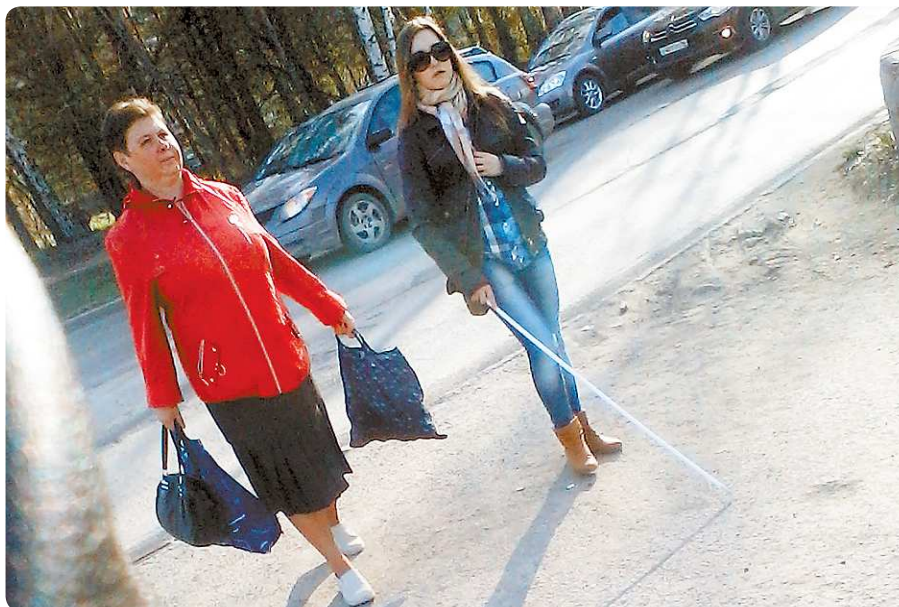
Автор эксперимента пыталась понять, как чувствует себя человек, недавно потерявший зрение

Больше всего я боялась светофоров и пешеходного перехода. Мимо с рёвом мчались машины, всё звенело и брякало, представляя собою неразборчивую какофонию. Не понимая, что делать дальше, я стояла у зебры несколько минут. На помощь мне пришла пожилая, судя по голосу, женщина. «Девушка, может, вам по-