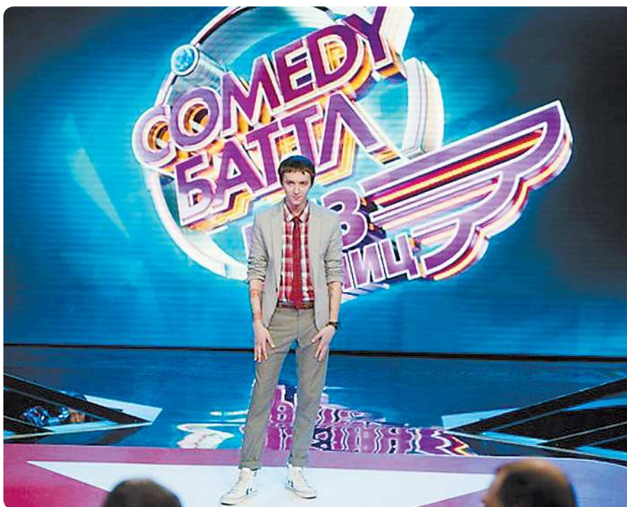
Денис признался, что во всех творческих начинаниях его поддерживает любимая девушка

На съёмках передачи у Дениса появилось много друзей из разных городов. У них разная манера шутить.