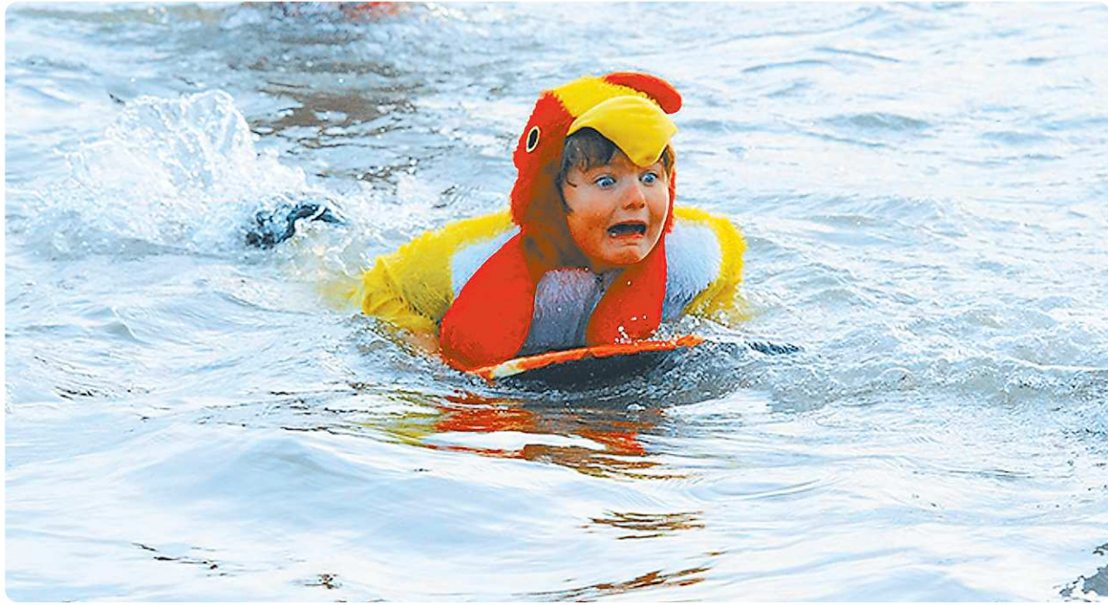
На воде в случае паники не забывайте правильно дышать

Если вы плаваете только по собакам, но уверенно и вас всё устраивает, то не надо ничего менять. Да, с точки зрения спорта такое плавание неэффективно – вы плывёте медленно и тратите много сил. Но для удовольствия вполне достаточно. Если у вас панический страх и вы изо всех сил делаете движения, чтобы удержаться, и быстро устаёте, надо работать над собой.