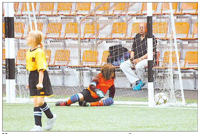
Мяч в воротах – это повод для спортивной злости. «Цас мы вам!»