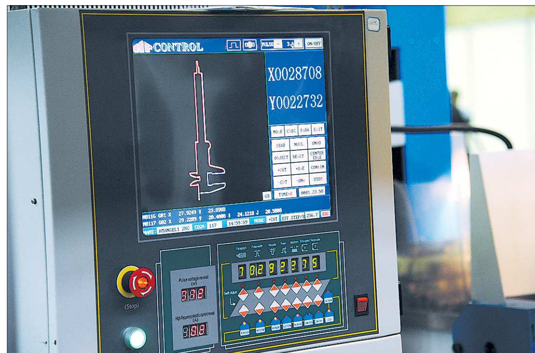
Новое высокопроизводительное рабочее место в промышленности стоит 7 миллионов рублей, оно обеспечивает выработку 5 — 8 миллионов рублей на одного работника

струменты для достижения поставленной задачи, сделан расчёт ресурсов (в том числе, естественно, финансовых), которые необходимо привлечь из различных источников для достижения целевых показателей.