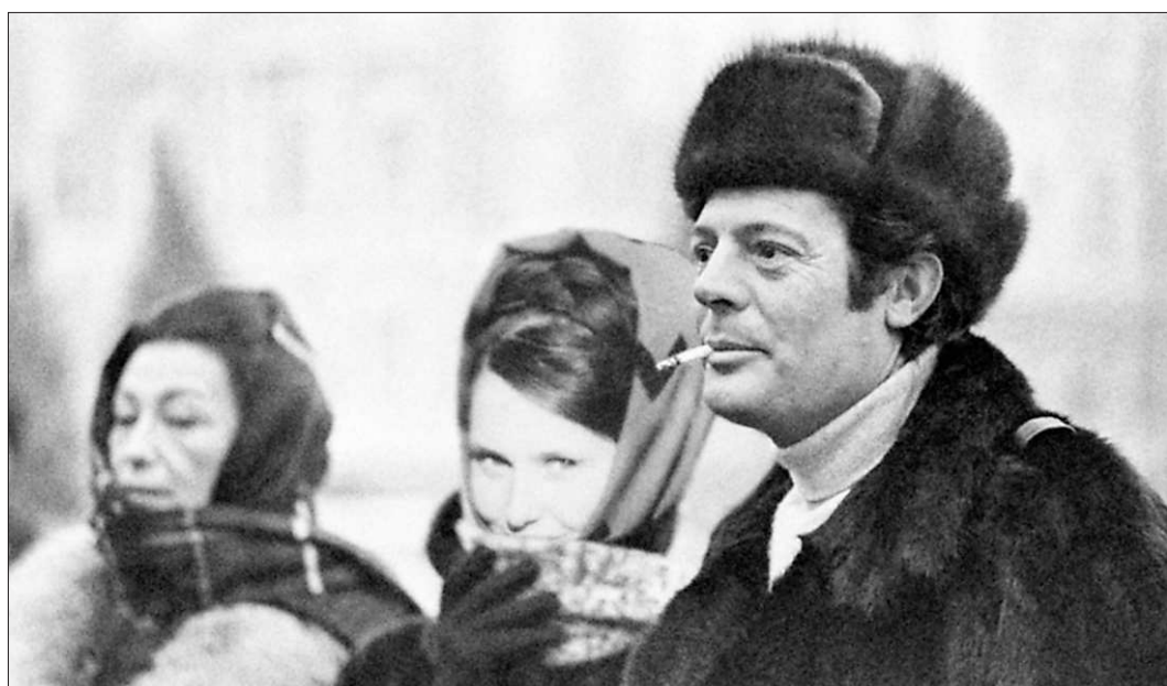
Забывтые в недрах памяти и старых фотоальбомах кадры обрели на выставке новую жизнь