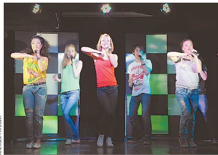
Артисты продемонстрировали, что эстрада – действительно синтез жанров. Сценическому движению их тоже обучают в арт-студии

Стажёры на отчётном концерте порадовали не только уровнем вокала, но и актёрскими способностями. Артисты не просто выходят, поют и уходят, они проживают песню. Каждый номер связан с предыдущим – продуманы связи и переходы, актёры работают в контакте друг