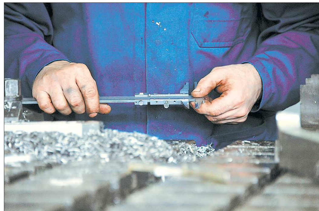
Производительность труда в промышленности Свердловской области в 2011 году составила 2,9 миллиона рублей на человека

«Согласно майским указам Президента страны в России до 2020 года должно быть создано 25 миллионов высокопроизводительных рабочих мест. Перед Свердловской областью поставлена задача создания 700 тысяч мест, из них 438 тысяч в промышленности. На момент подписания указов, если подсчитать согласно принятым методикам, уже 325 тысяч мы имеем. Ещё один фактор — создание рабочих мест в промышленности влечёт мультипликативный эффект и создаёт рабочие места (порядок цифр — 2,5 на одно в индустрии) в непромышленных смежных секторах, это законы экономики. Если учесть все эти цифры, то реально нам надо создать 35 тысяч рабочих мест с нуля и 92 тысячи модернизировать. Вот как подойти к созданию и модернизации такого огромного количества рабочих мест, поскольку у нас примерно такой же порядок цифр уже есть в промышленности, то есть, по сути, нам надо создать и модернизировать вторую промышленность. Это стратегическая, очень глобальная и масштабная задача. Она предполагает сосредоточение всех усилий власти и бизнеса. Проект программы ОЦП предлагает конкретные меры и ин-