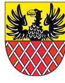
Герб города Хеб