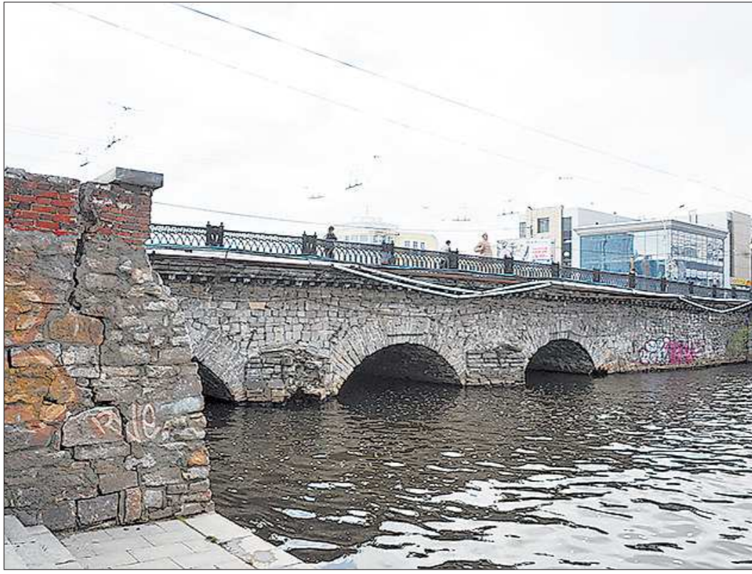
Под этим мостом на улице Малышева собираются прокладывать пешеходные дорожки. Есть надежда, что изменения затронут и непосредственно мост, рассыпающийся на глазах