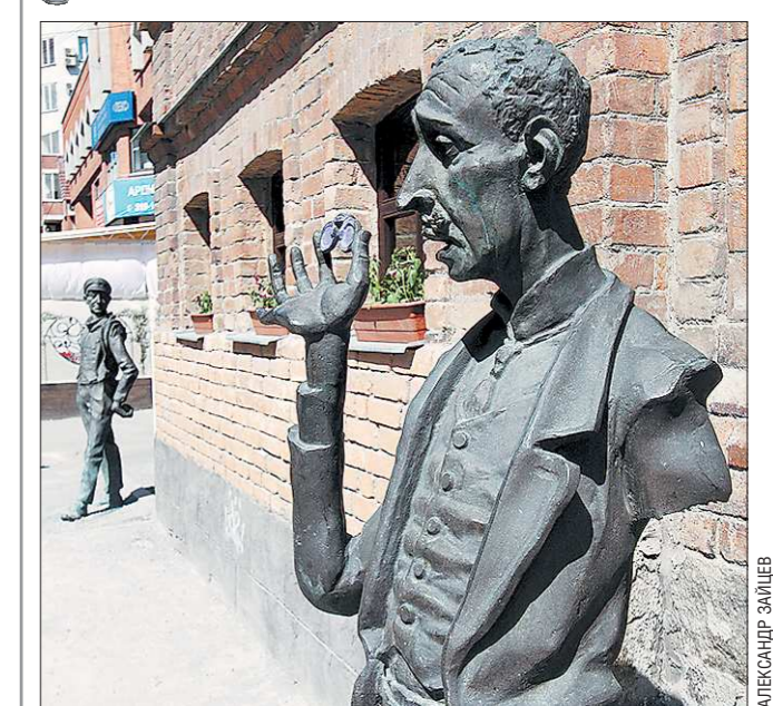
Памятник герою «12 стульев» Кисе Воробьянинову, установленный в 2007 году в Екатеринбурге на улице Белинского, пострадал от рук незвестных вандалов. Под покровом ночи преступники, орудуя автогенном, отрезали металлической фигуре левую руку, в которой литературный герой держал свою шляпу. Стоящий рядом памятник Остапу Бендеру не пострадал