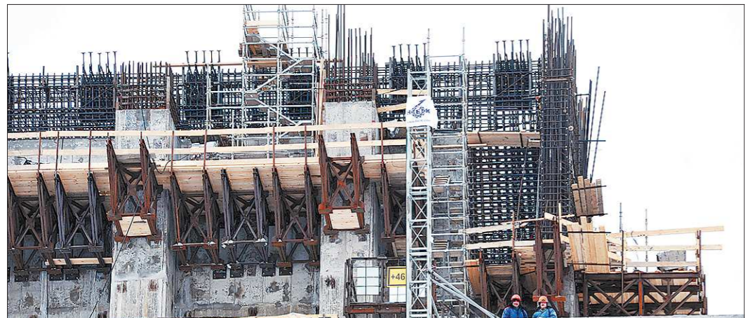
Размеры строительства БН-800 впечатляют, чего пока не скажешь о «масштабности» социальной инфраструктуры в Заречном

в сквер со стороны улицы Малышева. Пока эти объекты в планах не значатся. Что Виктор Юровицкий смог твёрдо пообещать, так это то, что на Плотинке появится светодиодный фонтан. — Фонтан появится на Плотинке уже к концу этого года, — добавил он.