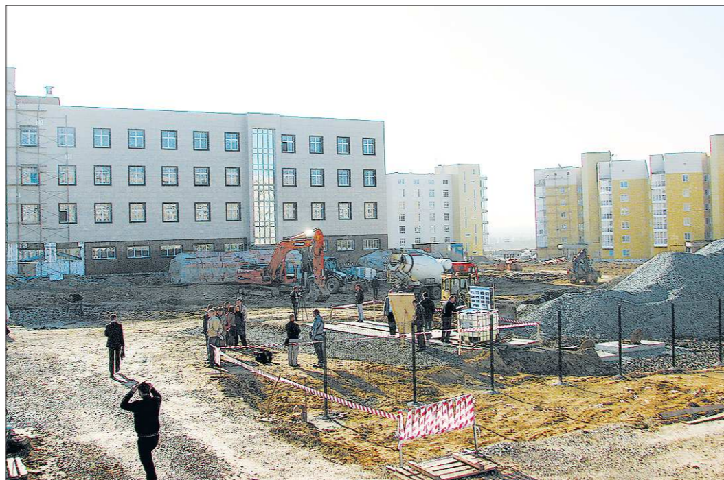
Местные жители, наблюдая, как стремительно растут здания госпиталя, мечтают о таких же темпах на стройке детской больницы, которая возводится двадцать лет

* День тезоименитства — это день памяти какого-либо святого, праздник для человека, который при крещении получил имя этого святого.