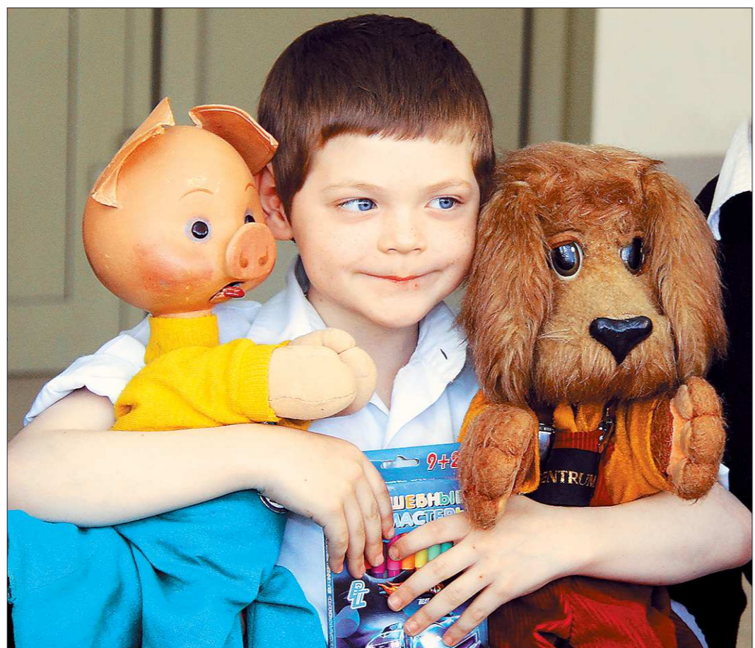
Куклы, которых актёры привезли с собой в Екатеринбург, сохранились со времён советского телевидения, им уже более 20 лет