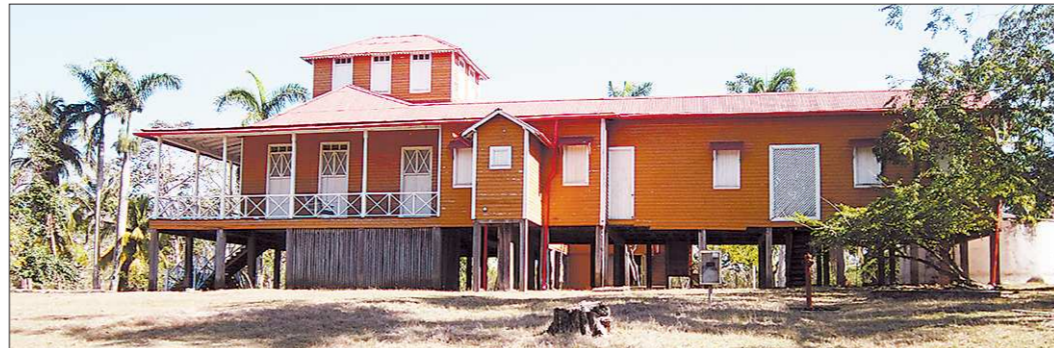
Это здание в Биране – копия того, в котором 13 августа 1926 года родился Фидель Кастро (строение сгорело в 1954 году). Говорят, увидев новодель, вождь кубинской революции поразился тому, насколько точно воспроизведён его отчий дом

«Либеральный реформатор Михаил Горбачёв, коммунистический диктатор Николае Чаушеску, пламенные революционеры братья Кастро... Все эти столь разные политические режимы объединяет одно: невероятные усилия, которые должны прилагать простые люди, чтобы обеспечить себя и свою семью элементарными вещами.