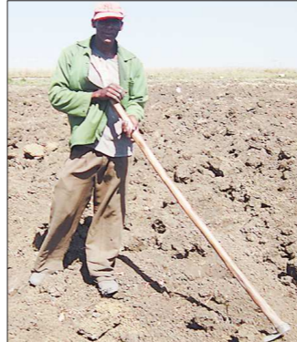
Раньше эта земля принадлежала отцу Фиделя. Теперь всем тут заправляет государство. Но не похуже, чтобы это сильно облегчило труд крестьян

можно, и была вполне естественной, а вот для представителей советской номенклатуры – не более, чем элементом политического этикета. Известно, что прибыв после Свердловска в Ленинград, кубинский гость не сдержался и высказал всё, что думает по поводу устроенной в городе на Неве выставки. Но задумываясь ли руководитель Острова свободы над тем, что засыле бюрократии – не случайность, а закономерность для страны, где почти всё принадлежит государству?