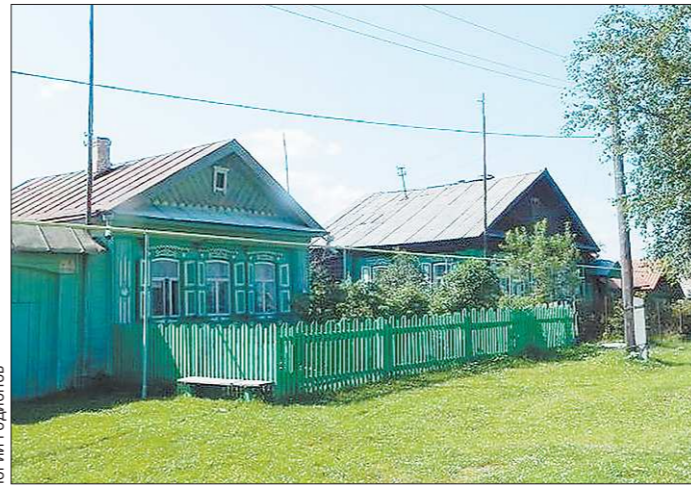
Когда-то Нейво-Рудянка была населённым пунктом с шеститысячным населением, заводом и клубом. Теперь даже о чужих хороших новостях жители посёлка узнают по слухам

Действительно, покупка новой антенны — дело не одного часа, ведь съездить за ней надо в один из специализированных магазинов, которые базируются в крупных городах. Да и средствами на такую покупку располагают не все жители (стоимость антенны порядка 1300 рублей плюс дорожные расходы). Для пенсионеров и других жителей, считающих каждую копейку, это траты серьёзные. Дата прекращения вещания — 29 апреля — внесла в дело о смене антенн дополнительные обиды.