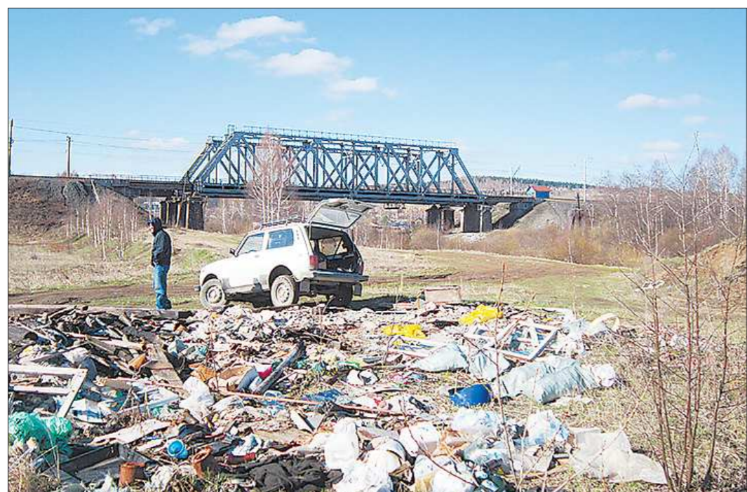
Свалка стихийно растёт в прибрежной защитной полосе Чусовой. Мусор сюда чаще привозят на машинах