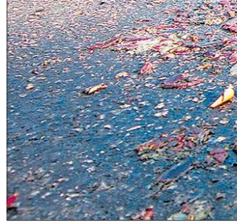
Эта экологическая катастрофа повторяется каждую весну: шоссе из Тринидада в Сьенфуэгос усеяно тысячами раздавленных крабов

Газета «Уральский рабочий» отмечала, что встреча Фиделя с местным руководством отличалась исключительной искренностью, сердечностью и товарищеской непринуждённостью. Однако так ли это? Для лидера революции искренность, быть