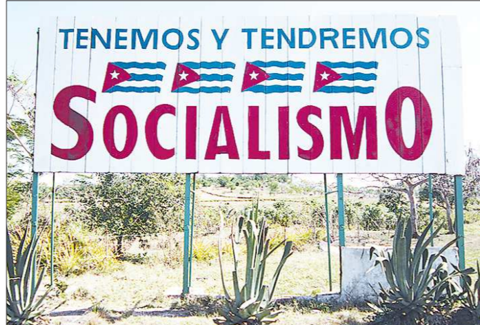
Лозунг у въезда в родную деревню Фиделя Кастро гласит: «У нас был и будет социализм»