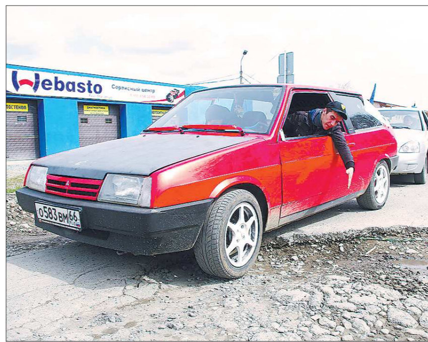
участие в автопробеге: «У меня две стойки пробиты на ревидинских ямах! Теперь их замена обойдётся дороже, чем на вазовской «девятке». К самой опасной выбоине на улице Ярославцева активисты общественной организации «Эко-Забота» надели вызвали полицейских, которые «зафиксировали» безобразие