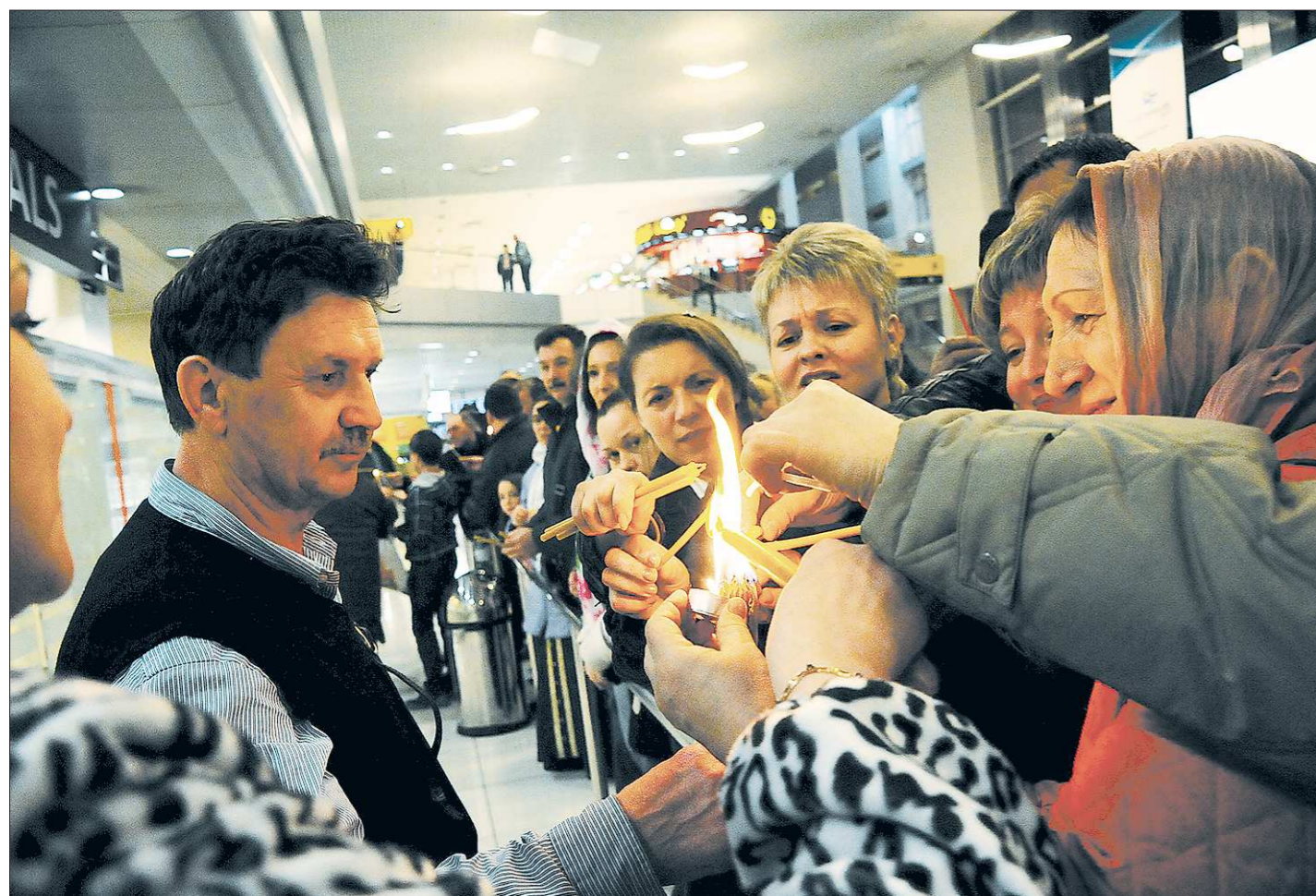
В Великую субботу в екатеринбургском Свято-Троицком кафедральном соборе прошли праздничные богослужения