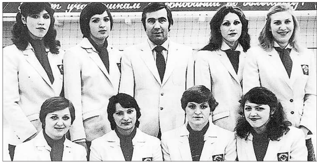
Сборная СССР – чемпион Олимпиады 1980 года

Волейбольный зал славы, расположенный в американской Халкиоке, считающейся родиной волейбола, я помню первый вопрос, который у меня возник: «А что, разве Карпиль до сих пор там не был?». Возможно, также считали и идеологи этого проекта, а когда поспрашивали, быстро исправили свою оплошность.