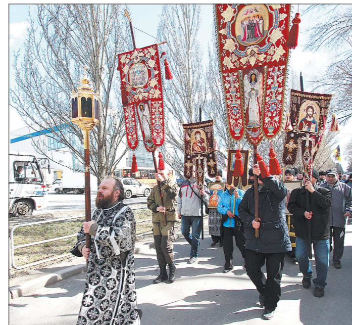
Крестоходцы проделали по городу путь в несколько километров

Маршрут крестного хода повторил путь, по которому следовали Романовы (приведены современные названия): железнодорожная станция Шарташ, улица Куйбышева, затем Восточная, Челюскинцев, вокзал, Свердлов, Карла Либкнехта, Храма-Крови. По пути верующие