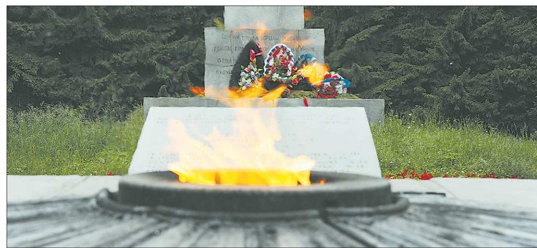
Почётный караул будет действовать в Камышлове, Заречном, Арамили, Ревде, Лобве, Шале, Тугульме и ещё в 36-ти городах и посёлках области. Всего в акции примут участие более 150 юнармейских отрядов и 50 военно-патриотических клубов. Ребята также приведут в порядок все памятные знаки войны