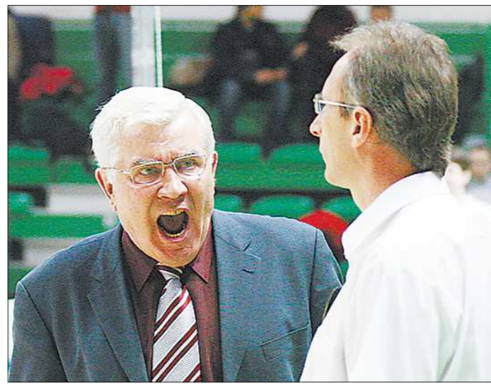
Тренер в игре – эмоция бьет через край

С командой «Уралочка» (Екатеринбург): чемпион СССР (1978–1982, 1986–1991), серебряный (1984, 1985) и бронзовый (1977, 1983) призёр чемпионатов СССР, обладатель Кубка СССР (1986, 1987, 1989), чемпион России (1992–2005), бронзовый призёр чемпионатов России (2008, 2009, 2012), обладатель Кубка европейских чемпионов (1981–1983, 1987, 1989, 1990, 1994, 1995), обладатель Кубка кубков европейских стран (1986).