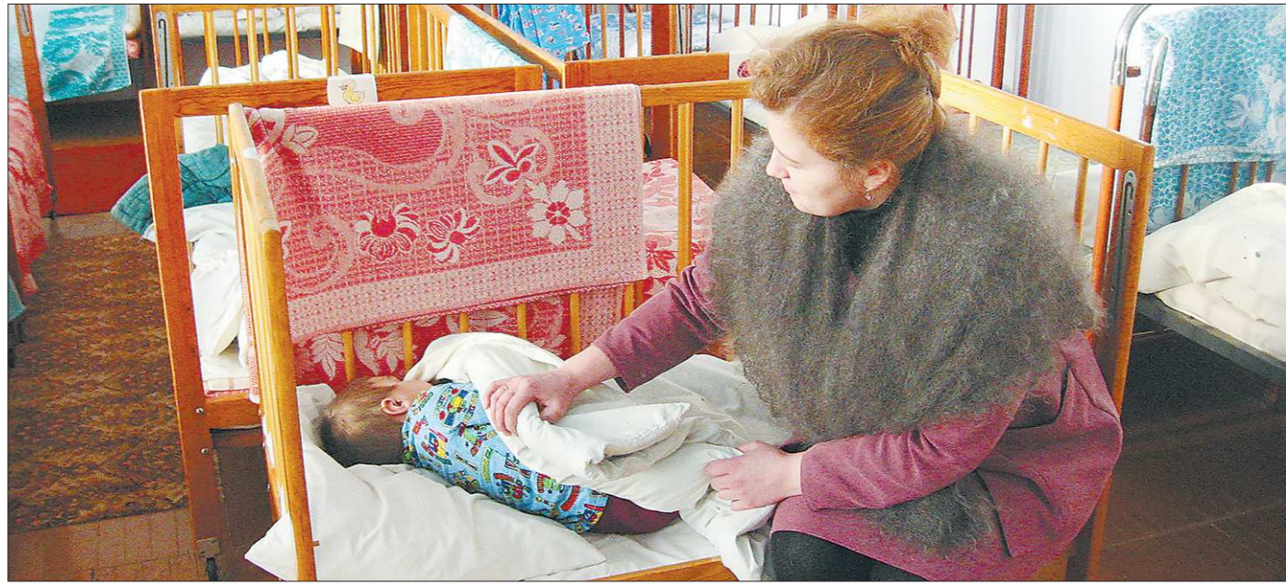
В группах негосударственных детсадов, как правило, по 20 детей. Но сейчас санитарные нормы изменились, количество малышей разрешено увеличить

Пожалуй, коммунальщики в Артёмовском встали на тропу войны, которую прекратить может либо здравый смысл, либо прокуратура.