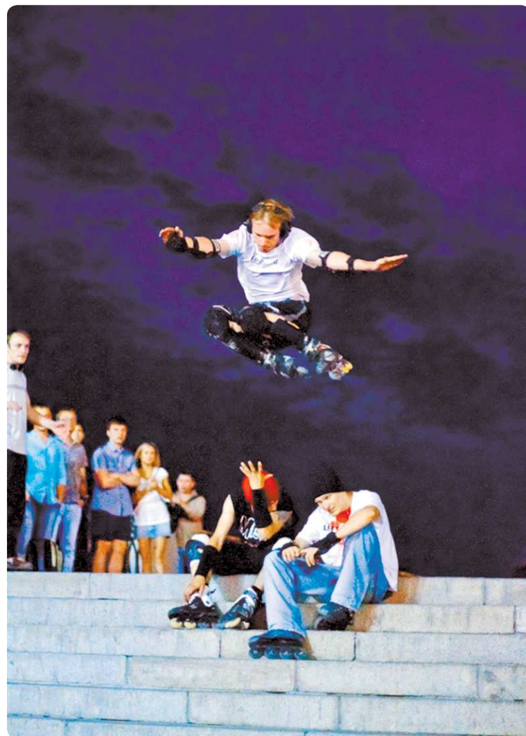
Если точно следовать «Закону о митингах», массовые мероприятия должны проходить до 23 часов. То есть под запретом окажутся ночные покатушки