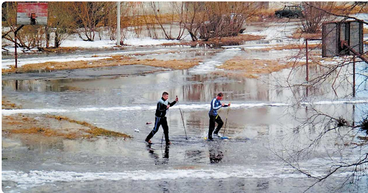
Фото и видео студентов-лыжников сделал из окна своей квартиры обычный житель Северодвинска. За первый час на сайте «ВКонтакте» его снимки набрали около 600 лайков

–Однажды наш физрук умышленно закрыл девочек, отлынивавших от занятий, в школьной раздевалке. Мы тут же принялись придумывать игры и решили, почему бы не вызвать пиковую даму. Накрылись одеждой и принялись повторять: «Пиковая дама выходи, пиковая дама выходи». Сначала ничего не изменилось, но потом какая-то умница истошно принялась орать, все остальные испугались. В мгновение ока вся наша команда уже была у закрытой двери и громко стучала и плакала, чтобы нас открыли. Минут через десять появился физрук