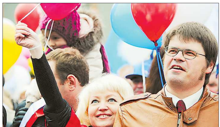
Только в Екатеринбурге, по предварительным данным, на праздник Первомай выйдет 25 тысяч жителей