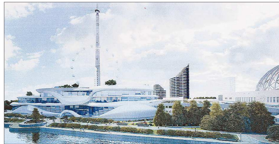
Возможно, именно так будет выглядеть «Цирколэнд» через пару лет

Сейчас хоккеисты, перед тем как уйти в отпуск, продолжают тренировки. С ведущими игроками «Спутника» занимается вместе и тагильская молодёжь. Кто-то из них пополнит команду уже в следующем сезоне.