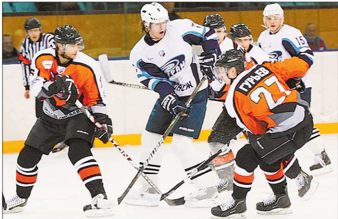
Мечтам хоккеистов «Спутника» о «Братине» не суждено было сбыться — в четвертьфинале команда попала под воронежский «Буран»

В первом раунде плей-офф «Спутник» со счётом 3:1 в серии (результаты матчей — 3:2, 3:0, 3:4 (от), 6:2) обыграл «Динамо» из подмосковной Балашихи. Остроосаженным полуфиналом против воронежского «Бурана». «Спутник» выиграл первый матч дома (4:3 в овертайме), уступил