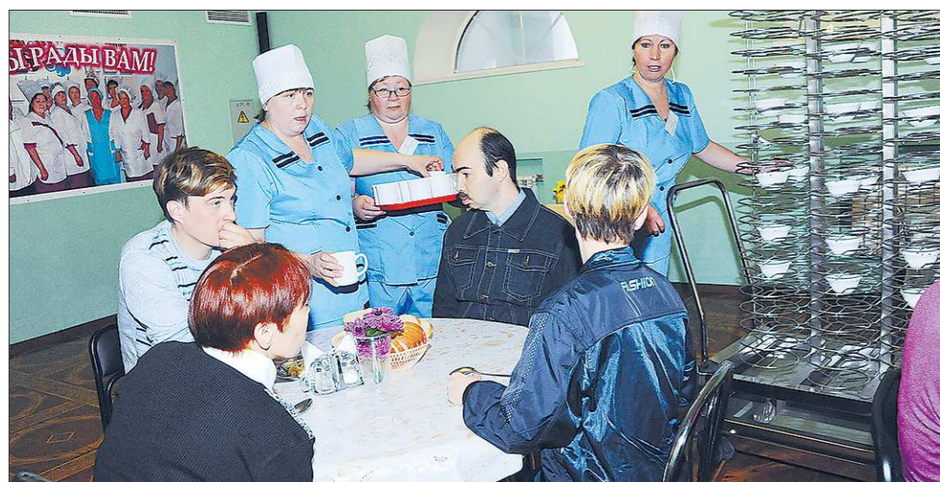
На инновации в организации питания в Берёзовском интернате потрачено порядка одного миллиона 700 тысяч рублей, выполнена реконструкция по комплексной программе «Старшее поколение»

Финансово-экономическое обоснование проекта оговаривает создание и бюджетное содержание всероссийской сети информационно-навигационных центров – одного федерального и семи региональных. К ним в придачу откроют 72 региональных коммутационных узла и круглосуточные центры, принимающие и фильтрующие информацию о ДТП. Региональный центр по УрФО будет работать в Екатеринбурге.