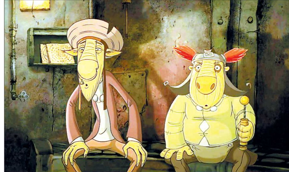
Пацак Би и чатланин Узф, сыгранные в оригинале Юрием Яковлевым и Евгением Леоновым, возвращаются на большой экран в виде двух гуманоидов

Сюжет завязан на проблеме малого предпринимательства, которое в России априори невыгодно (выгодно, как заме-