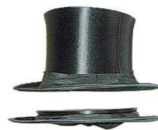
На французском языке слово «шапокляк» пишется так – chapeau claqué

Слово «шапокляк» Эдуард Успенский не придумал, а взял из русского языка. В XIX веке шапокляком называли мужской головной убор, разновидность цилиндра, который мог складываться благодаря специальному механизму. Первый шапокляк был изготовлен в Париже в 1830 году. В помещении шапокляк носили сложным, под мышкой. После Первой мировой войны шапокляк, так же как и цилиндр, вышел из употребления.