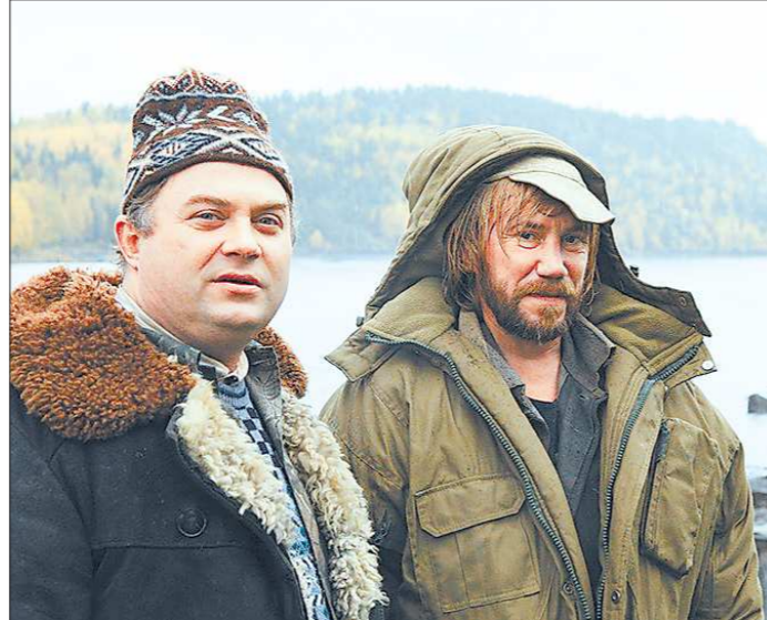
Мужики преданы своему Александру Сергеевичу как дети. И по-детски испуганно его предают

Но это — всего лишь мелочи. Георгий Данелия в точности воссоздал ту неповторимую атмосферу, что царил в фильме, сохранил спокойный, медитативный темп, и фирменный юмор всё так же тонок. В итоге «Ку! Кин-дза-дза» вызывает примерно те же эмоции, что и оригинал. Поэтому возникает вопрос — стоило ли вообще всё это затевать? Несмотря на забавно нарисованных персонажей и смешную озвучку, мультфильм получился совсем не детским, а взрослые скорее посмотрят изначальный фильм — хотя бы из-за великолепного дуэта Леонова и Яковлева, которых не заменят никакие рисованные чуд-