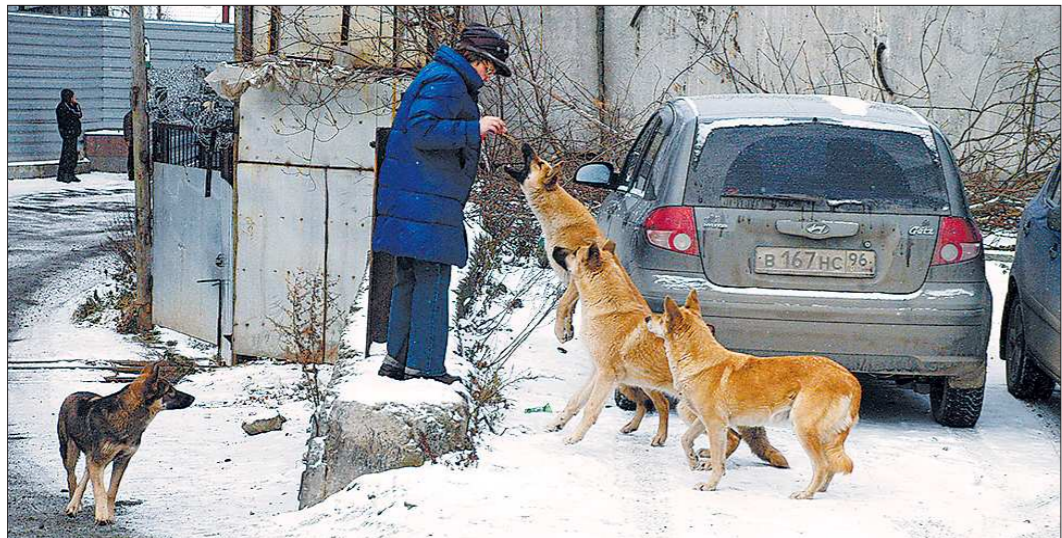
Сначала прикармливаем, а потом прчемся...

Случалось, уже на пенсии, не выдерживал «дорожных профессоров» — подходил к халтурщикам и делал замечание, мол, что же вы творите? Самое вежливое, что слышал в ответ: «Не твоё дело». Небось, заказчику бы так не сказали. Да только заказчикам, похоже, всё нравится.