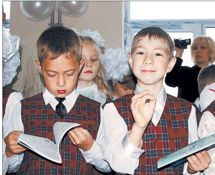
ФАБЕТА «ИЖИНСКИЙ ЧЕТВЕРГ»