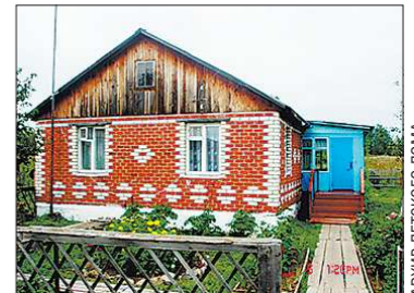
Вместимость коттеджей «Домовёнка» — 60 детей. Сегодня там проживают 52 ребёнка

20 лет назад (в 1993 году) в деревне Займка (пригород Верхотурья) семейный дом детства «Домовёнок» принял первых детей: 19 ребятшек в возрасте от 2 до 12 лет.