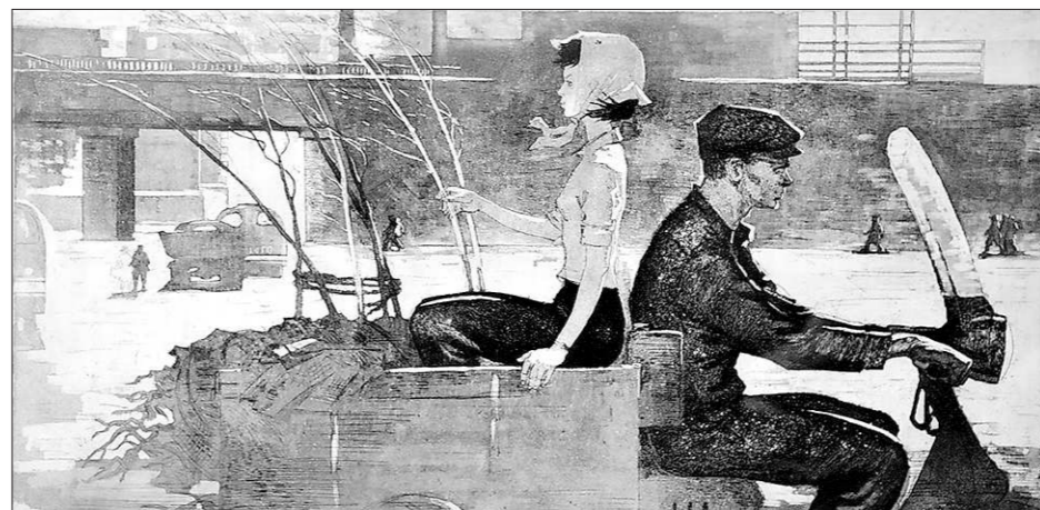
Серия «Мой современник» – о простых человеческих буднях, в которых есть лирика и чудо. Надо только его увидеть

– Спартак прожил немного, но бурно – по характеру он очень открытый, добрый, от-