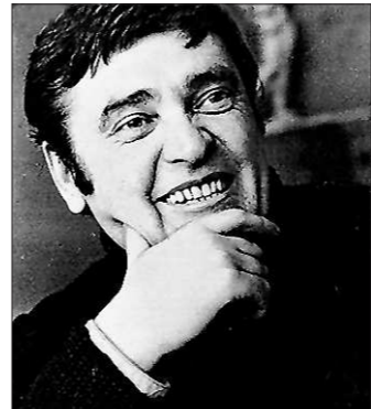
Коллеги и друзья художника говорят, что он был солнечным человеком. Жаль, что рано ушёл