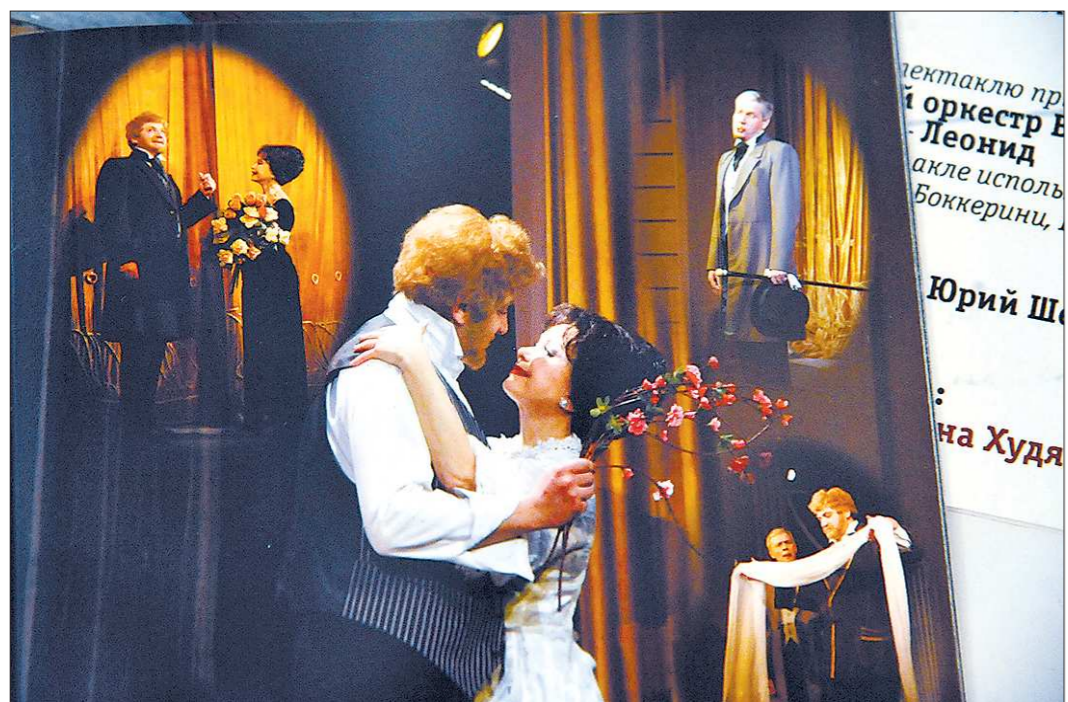
Спектакль «Тургенев и Полина Виардо. История любви» стал визитной карточкой екатеринбургского Камерного театра