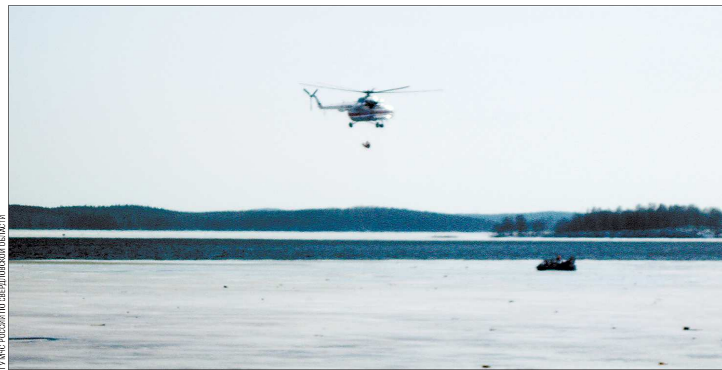
ГУМПС РОССИИ ПО СВЕРДЛОВСКОЙ ОБЛАСТИ

6 апреля для вызволения из беды 18 человек понадобилась помощь 59 спасателей, 18 единиц техники и вертолёта. Самим рыбакам за их глупость наказание не полагается