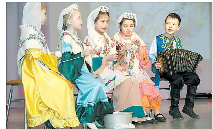
Образцовый детский ансамбль татарского народного творчества «Чулпан» исполняет песню «Вечёрка»