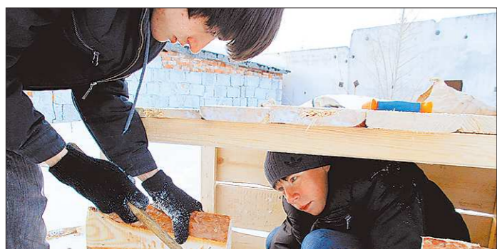
Одна из последних «молочных» инициатив – строительство приюта для собак в посёлке Белокаменный

С 6 апреля стоимость проезда для всех категорий граждан снизилась с 18 до 15 рублей самые крупные местные перевозчики – УК «Пассажирские транспортные перевозки» и «Экспресс-Сити». На социальном маршруте № 4 УК «ПТП» и вовсе снизил цену билетов до 10 рублей. При этом льготы для пенсионеров отменены. Уместно вспомнить, что за 15 рублей до недавнего времени возил пассажиров в своих туристических автобусах лишь один каменский перевозчик – предприятие «Стрела». Точнее – до тех пор, пока не заключил с мэрией официальный договор о городских пассажирских перевозках. Сейчас и он вновь вернулся к 15-рублевой тарифу. Горожане, с недоумением наблюдающие «транспортную революцию», опасаются, как бы «каменский социализм» не завершился в итоге кардинальным удорожанием услуг всех местных перевозчиков.