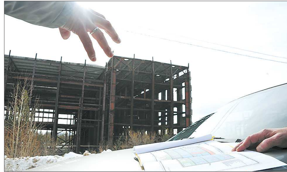
ститут Менделеева и УрФУ обеспечили напиться его преподавателями кадрами. Кроме того, вынашиваются планы для дальнейшего передела продукции. И тут можно снова использовать плюс данного проекта – наличие сырьевого производства позволит привлечь в индустриальный парк предприятия, которые используют его для дальнейших переделов (высокоочищенные оксиды, гранулят для производства керамики и тому подобное).

Как бы оправдываясь, что не так много рабочих мест, добавил, что «это достаточно сложная химия», и для обучения специалистов будет создан обучающий центр, а Ин-