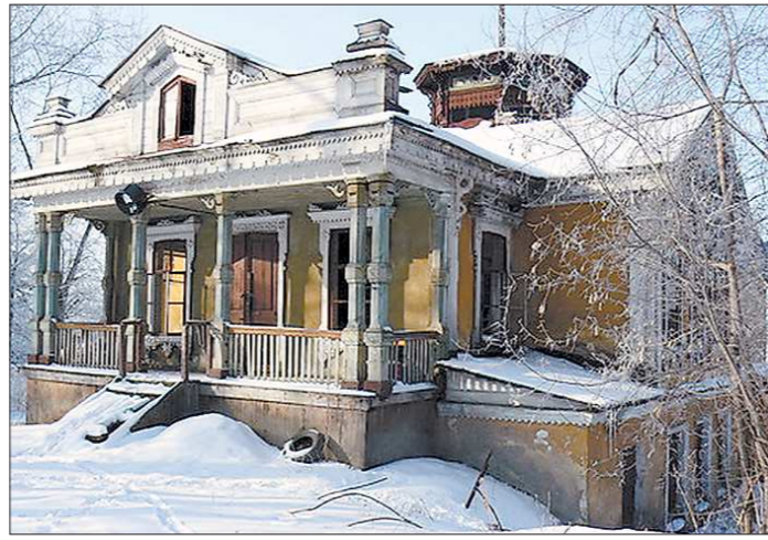
Жители Нижнего Тагила надеются, что новое здание сохранит все черты стиля двухвековой давности