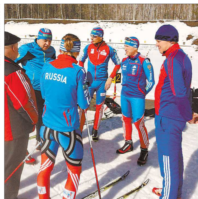
«Совещание» на свежем воздухе