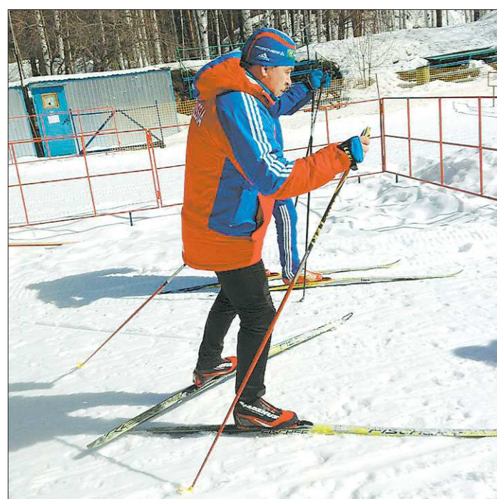
На биатлонной трассе губернатор чувствовал себя уверенно