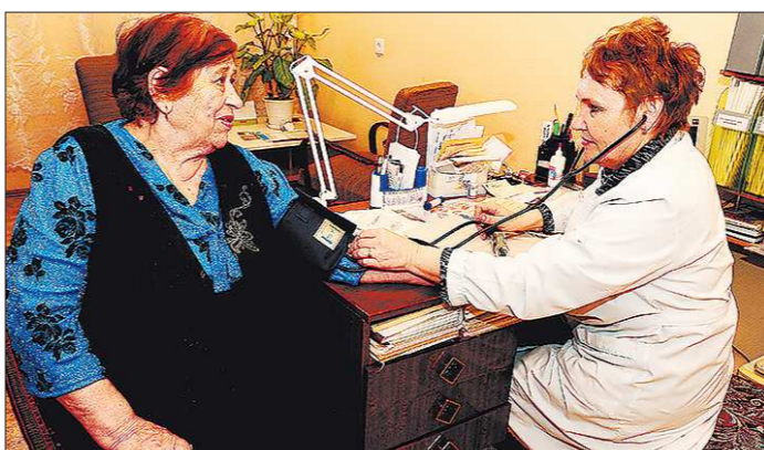
Гипертония сокращает срок жизни у женщин почти на пять лет

Записали Ольга ИВАНОВА, Лариса ХАЙДАРШИНА