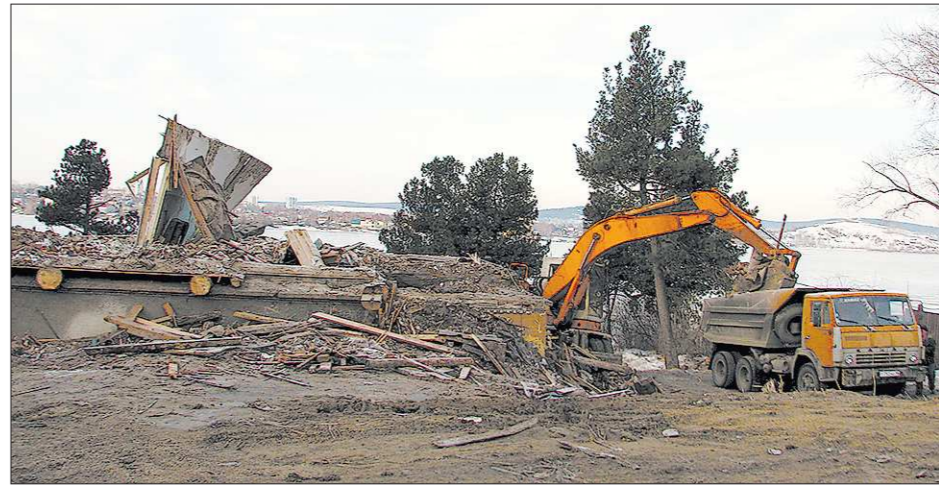
Жители Нижнего Тагила надеются, что новое здание сохранит все черты стиля двухвековой давности

К даче-фантому тагильчане привыкли, о ней редко кто вспоминал. Но вот на местных сайтах появились фотографии: на террито-