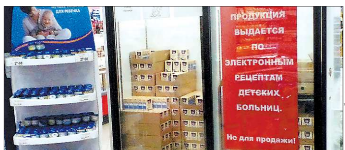
Так выглядит пункт выдачи детского питания в одном из магазинов Екатеринбург