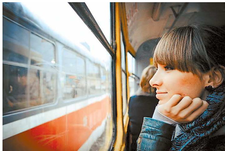
Что бы ни происходило, смотри на жизнь с улыбкой.