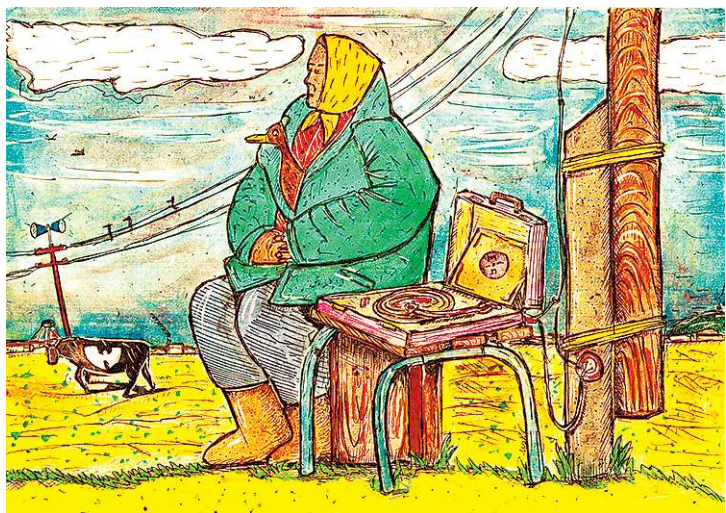
Из серии «Бабушка хип-хоп».