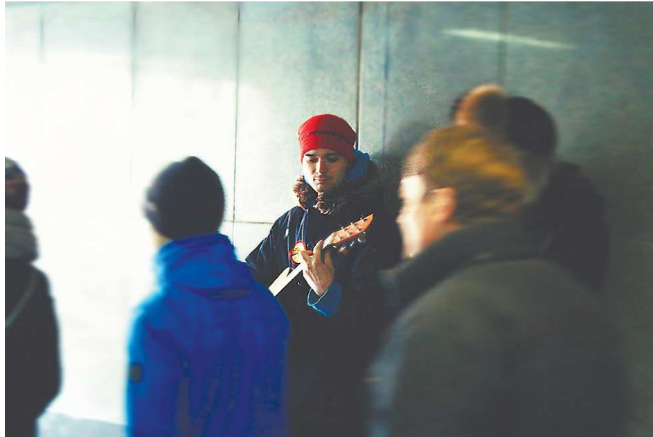
Они играют, а все проходят мимо.

Музыка лёгкая, ненавязчивая. Её можно слушать долго, она точно врежется в память, и ты будешь её напевать. Вот останавливается молодая пара. Парень в очках, его лицо выглядит строго. Девушку не успеваю разглядеть, она быстро разворачивается и идёт дальше. А парень остаётся стоять! Улыбается, просто слушает музыку. Проходит примерно две-три минуты... Де-