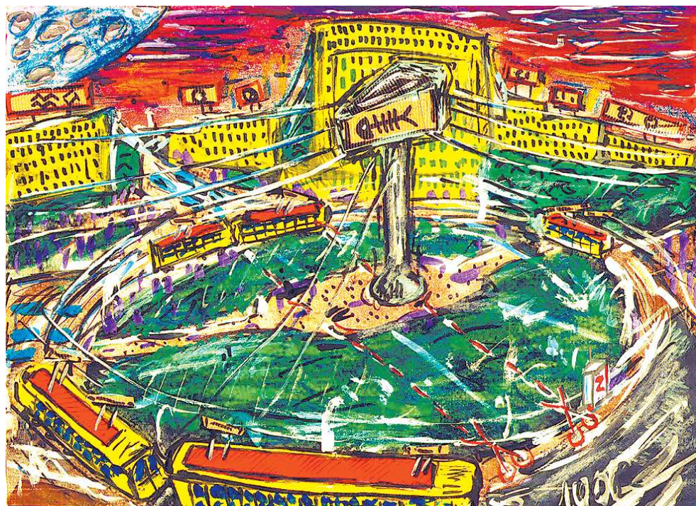
Памяти транспортного кольца на проспекте Ленина в Екатеринбурге посвящается.