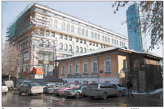
Здание по Гоголя, 7 построено во второй половине XIX века для семьи коллежского асессора Козьмы Антоновича Вандышева