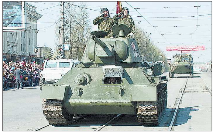
Уникальный экспонат музея бронетанковой техники Уралвагонзавода — огнёмётный танк — по традиции открывает в Нижнем Тагиле майские парады

По данным фактам главу администрации несколько раз вызывали на допросы в качестве подозреваемого. У него дома даже прошли обыски, но никаких доказательств найдено не было.