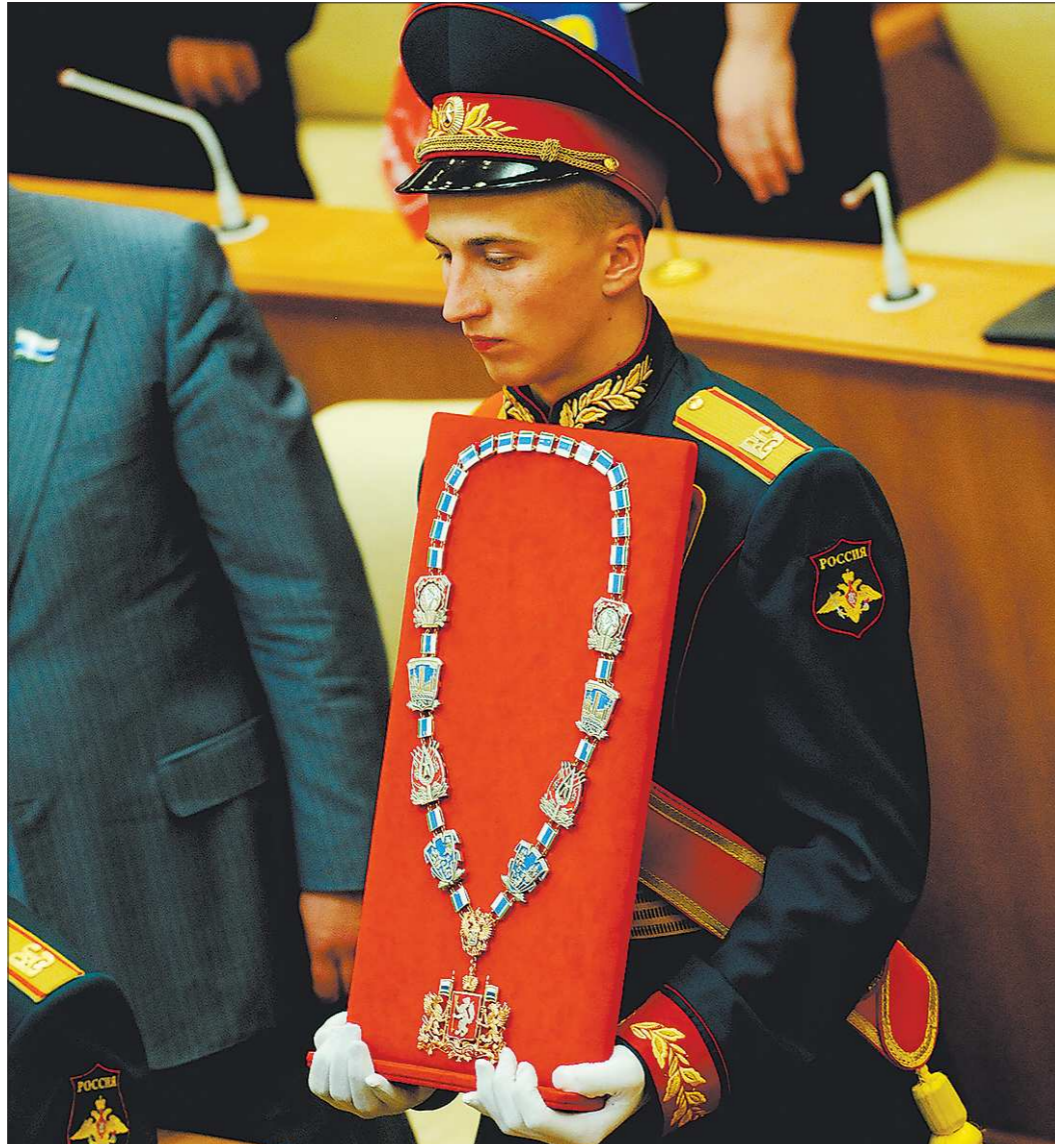
В следующий раз губернаторские регалии, скорее всего, достанутся победителю всенародного голосования

Какой именно из двух вариантов наиболее удобен для того или иного субъекта, решать будут региональные депутаты, в случае Свердловской области — члены Законодательного Собрания.