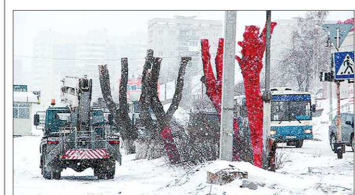
В Первоуральске срубили тополя, которые были покрашены в красный цвет. Неизвестные лица покрасили несколько тополей возле Старотрубного завода в Первоуральске накануне визита на Урал Владислава Суркова 26 марта 2013 года.