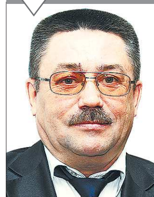
Игорь МОРОКОВ, Уполномоченный по правам ребёнка в Свердловской области