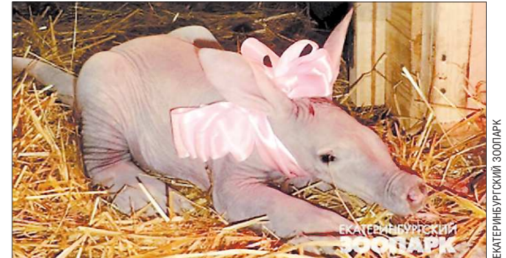
Трубокозубы — довольно неуклюжие животные. Чтобы с новорождённой ничего не случилось, на ночь её отсаживали от мамы