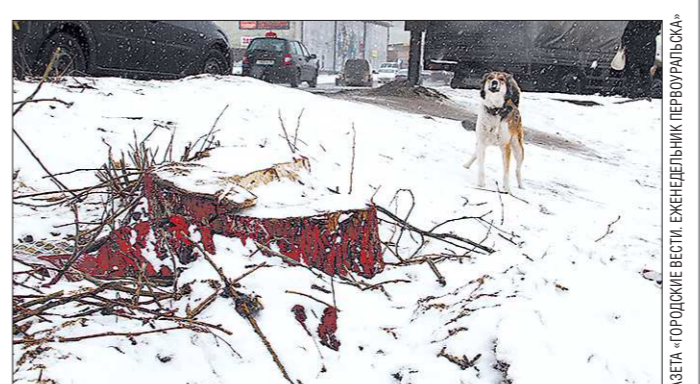
«Городское хозяйство» Юрия Попова, сначала новотрубники попытались отмыть деревья, но красная краска настолько въелась в кору, что избавиться от нее, не причинив ещё больший вред тополлям, не представляется возможным.