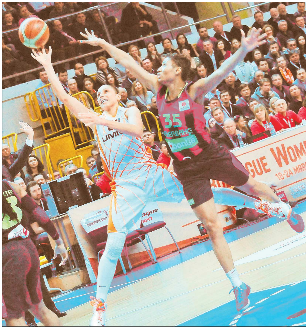
Из 82 очков, набранных баскетболистками УГМК в финальном матче, 80 команде принесли иностранки, в том числе 14 очков – Дайана Таурази (слева)

Открывав программу последнего дня «Финала восьми» матч за третье место. Словацкие «Добрые ангелы» за время турнира успели обрести в Екатеринбурге своих поклонников. С их поддержкой они попробовали повторить тот трюк, который дважды удавался им в группе и почти удался в полуфинале. Невероятно, но игроки «Гуд Энджелс» всякий раз создавали комфортное преимущество благодаря тому, что у них залетали в корзину