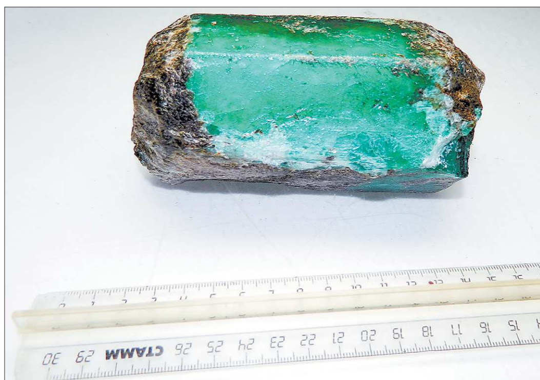
Весит неочищенный кристалл 1011 граммов. В длину он около 12,5 сантиметра, в ширину — 6,5. К слову, это примерно одна шестидесятая часть всей годовой добычи (в 2012 году от месторождения было получено 60 кг 142 г изумрудов)

ство развития регионов. Планируется, что подготовка к выставке драгоценностей должна закончиться к 1 мая (а пройдёт она в доме Севастьянова). По крайней мере, как нам сказал Аркадий Соколов, заместитель директора обособленного подразделения «Малышева», именно вчера руководство получило предложение выставить свои камни на будущей экспозиции. Однако решение пока не принято.