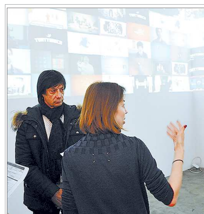
Московская креативная фирма «Ростмедиа» предложила сделать Первоуральск одной из трёх площадок в стране для размещения современного культурного проекта ДНК — Дом новой культуры