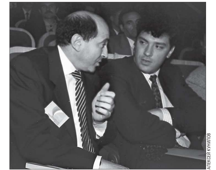
Борис Березовский (слева) и Борис Немцов на экономическом форуме в Екатеринбурге в 1996 году