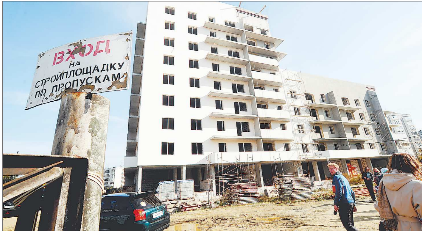
Жилищно-строительные кооперативы могут обрести второе дыхание