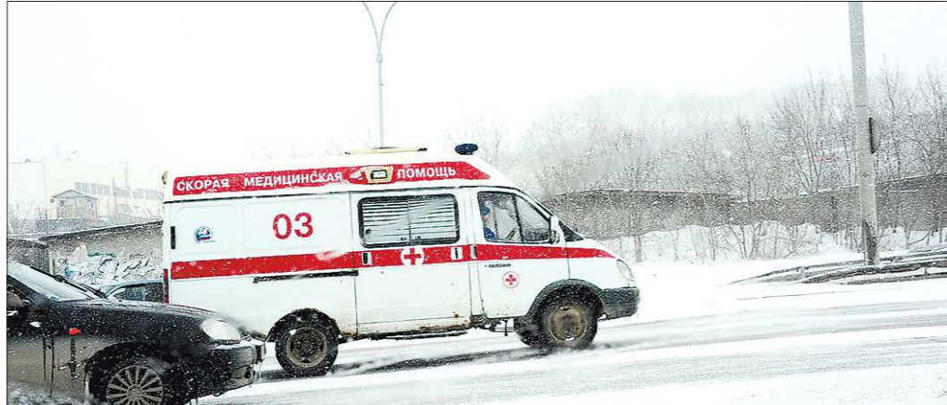
Около 30 процентов вызовов не относятся к функциям скорой помощи