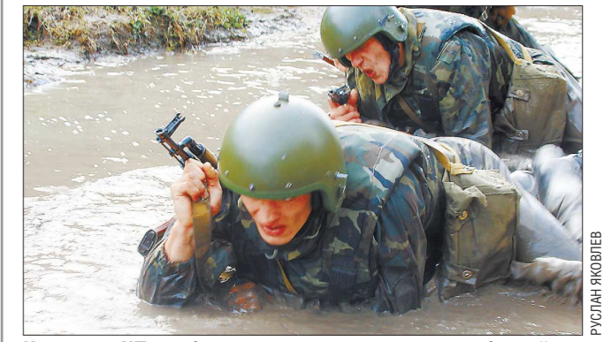
Когда нет ЧП, «собольята» усиленно занимаются боевой подготовкой

20 лет назад (в 1993 году) на базе Тавдинского управления лесных исправительно-трудовых учреждений (УЛИТУ) МВД России был создан отряд специального назначения «Соболь».