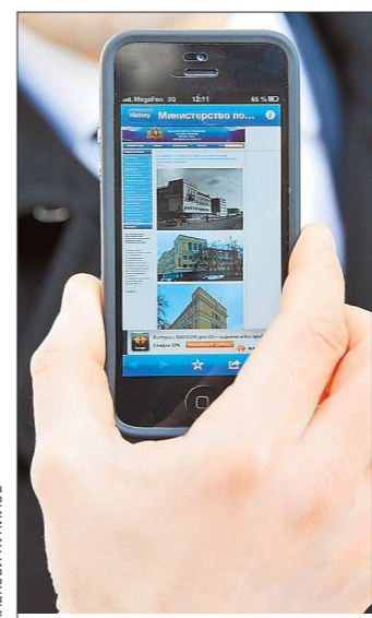
Технология проста: телефон сканирует QR-код и даёт ссылку на сайт МУГИСО. На нём для каждого объекта культурного наследия есть своя веб-страница

Мы планируем установить такие таблички на всех пешеходных маршрутах к июлю этого года, - рассказал замминистра Артём Богачёв. - К октябрю планируем оснастить кодами в общей сложности 400 объектов. При сканировании кода пользова-