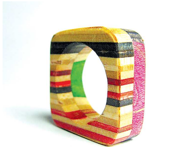
Это кольцо и комплект украшений (на фото ниже) сделаны из старых скейтбордов.