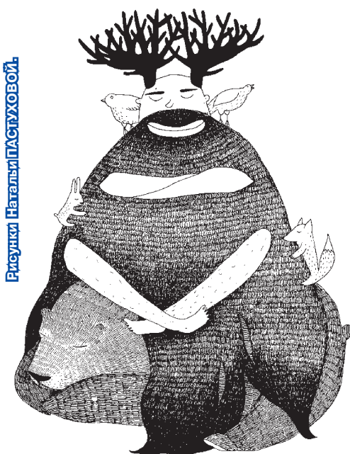
Принт из серии про бородатых мужчин.

Вы можете сделать эскиз рисунка на бумаге, но в итоге его нужно представить в электронном виде. Впрочем, так рисунок проще дорабатывать.