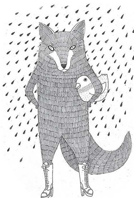
Принт из серии «Дню влюблённых».