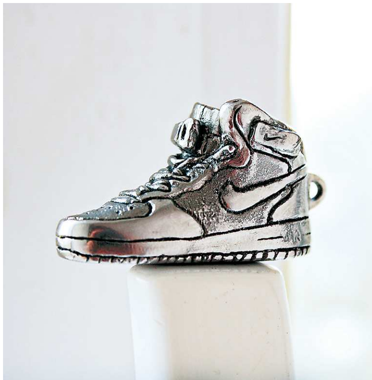
Бюджетное кольцо на все случаи жизни.