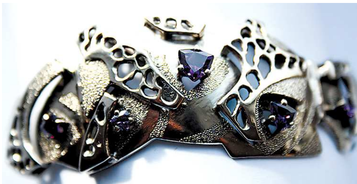
Камни — один из любимых материалов ювелира.