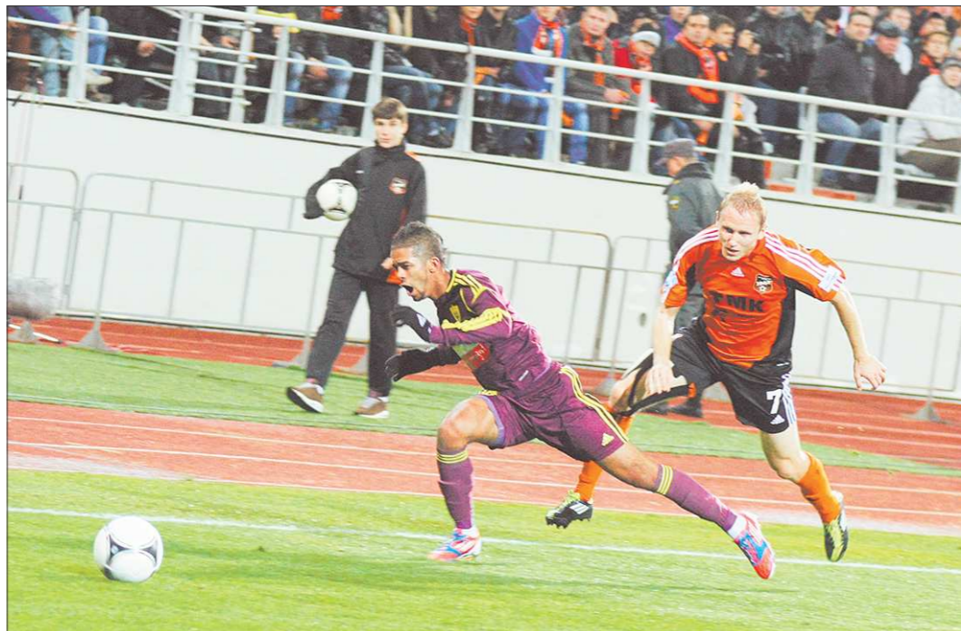
В турнирной таблице «Урал» пока второй. Но для выхода в премьер-лигу и этого достаточно