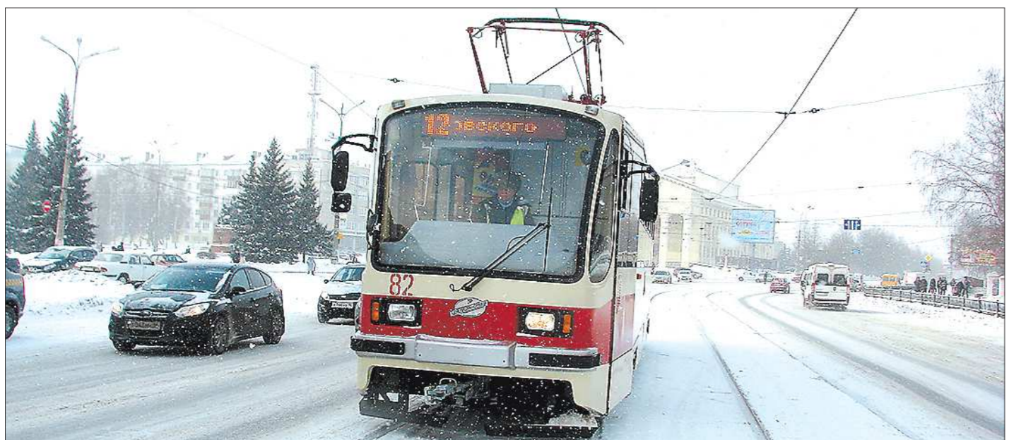
При разработке транспортной схемы Нижнего Тагила предлагалось заменить электротранспорт на автобусы. Поддержки горожан такая идея не получила: трамвай мил тагильчанам своей вместительностью и экологичностью