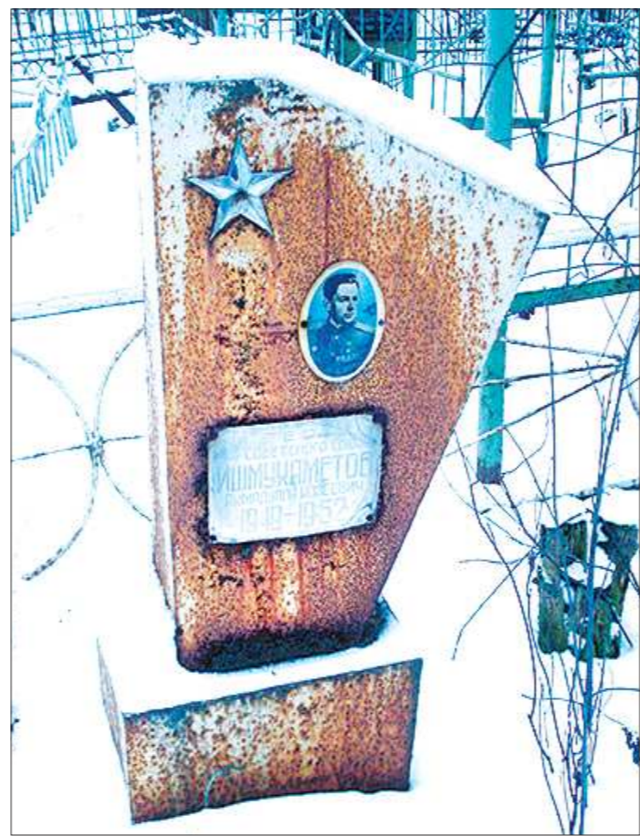
Вот так мы чтим наших героев?..