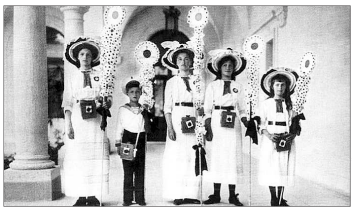
Это самая известная фотография, связанная с историей появления праздника в России. На фото – княжны Ольга, Татьяна, Мария, Анастасия и царевич Алексей. Ливадия, 1912 год

Рядом со старым бревенчатым домом хозяин строил двухэтажный кирпичный. В результате взрыва обрушился крытый двор и перекрытия нового строения, а старый при пожаре был повреждён огнём и восстановлению не подлежит