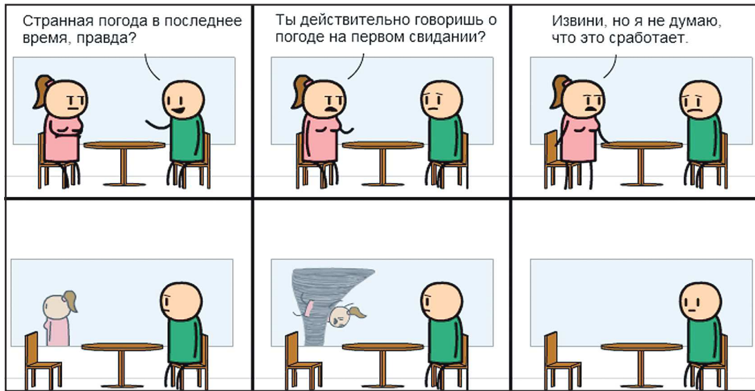
Советы наших авторов не надо расценивать серьёзно. Это всего лишь попытка пошутить, как и этот комикс.

5. Ни в коем случае не задавай вопросов! Ты же не какой-то там журналист. Не нужно спрашивать, чем увлекается девушка и почему ей нравится хурма. Лучше произ-