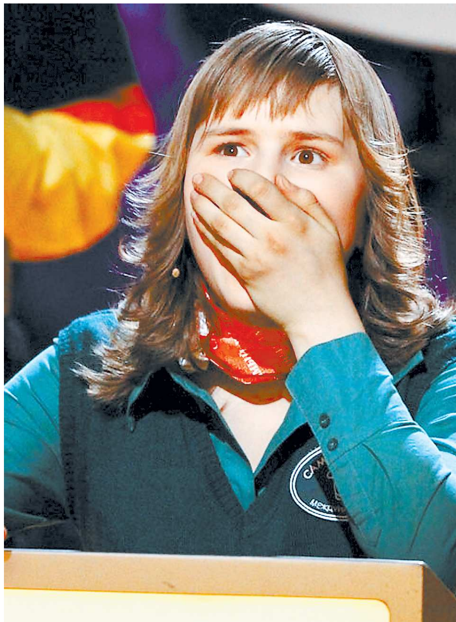
Кадр из телепрограммы «Самый умный»