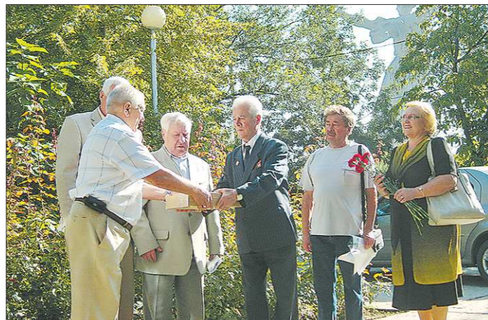
Делегация уральцев принимает священную землю, взятую с места самых ожесточённых боёв на Мамаевом кургане

После перестройки в бассейнах появилась зона отдыха, где можно в джакузи понежиться и в турецкой бане погреться. А как восхитительно вечером в ботаническом саду, когда все его экзотические растения и фонтаны переливаются в свете мириадов огней разноцветных лампочек».