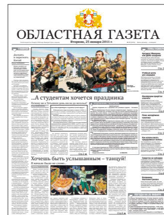
в январе 2011-го...