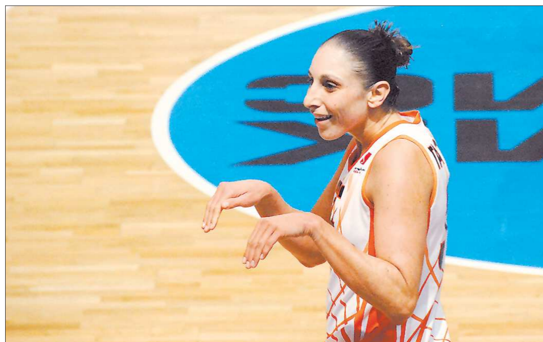
За два месяца до финала Евролиги у звезды «УГМК» Дайаны Таурази прекрасное настроение