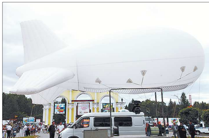
Екатеринбург, август 2012 года. Аэростат с видеокамерами на борту патрулирует парк имени Маяковского во время народных гуляний