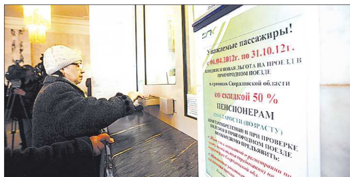
По новому постановлению правом льготного проезда отдельные категории граждан будут пользоваться круглогодично

Меры социальной поддержки по бесплатному проезду предоставляются гражданам, проживающим в Свердловской области: Получившим увечье или заболевание, не повлекшие инвалидности, при прохождении военной службы или службы в органах внутренних дел Российской Федерации в период действия чрезвычайного положения либо вооруженного конфликта. Проработавшим в тылу в период с 22 июня 1941 года по 9 мая 1945 года не менее шести месяцев, исключая период работы на временно оккупированных территориях СССР.