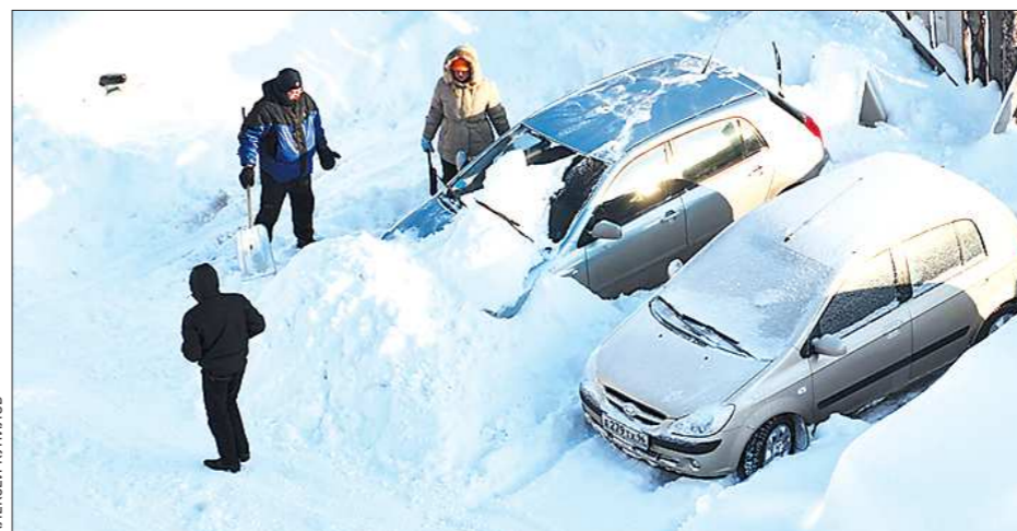
В таких условиях автомобилистам хочется поменьше на снегоход, а ещё лучше — на оленью упряжку