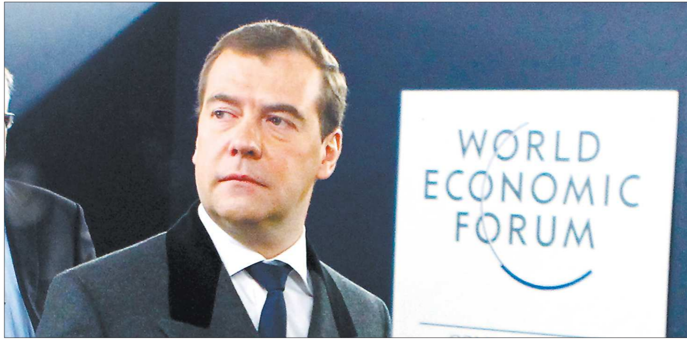
Дмитрий Медведев считает важным достижением полноценную интеграцию России в глобальные рынки

Интересно, что подобных екатеринбургскому павильонов стран-конкурентов (Объединённые Арабские Эмираты, Бразилия, Турция и Таиланд) на форуме в Давосе не оказалось, хотя представители этих государств в нём участвуют. Евгений Куйвашев объяснил это тем, что у каждого претендента на ЭКСПО-2020 — своя специфика, а значит, и своя стратегия.