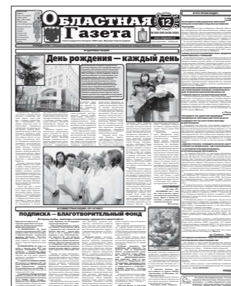
«ОГ»: в октябре 2010-го...

Преобразования в «ОГ», разумеется, не ограничатся только оформлением. Как и в прошлые годы, появятся новые рубрики, темы (особенно в ТВ-блоке). И, в частности, прямо сегодня мы запускаем масштабный проект под названием «Книга рекордов Свердловской области» (см. справа вверху). Надеемся Уверены, что он станет для «ОГ» не менее знаковым, чем «Этот день в истории области». Который, кстати, никогда не делся — вот он, как обычно, внизу справа.