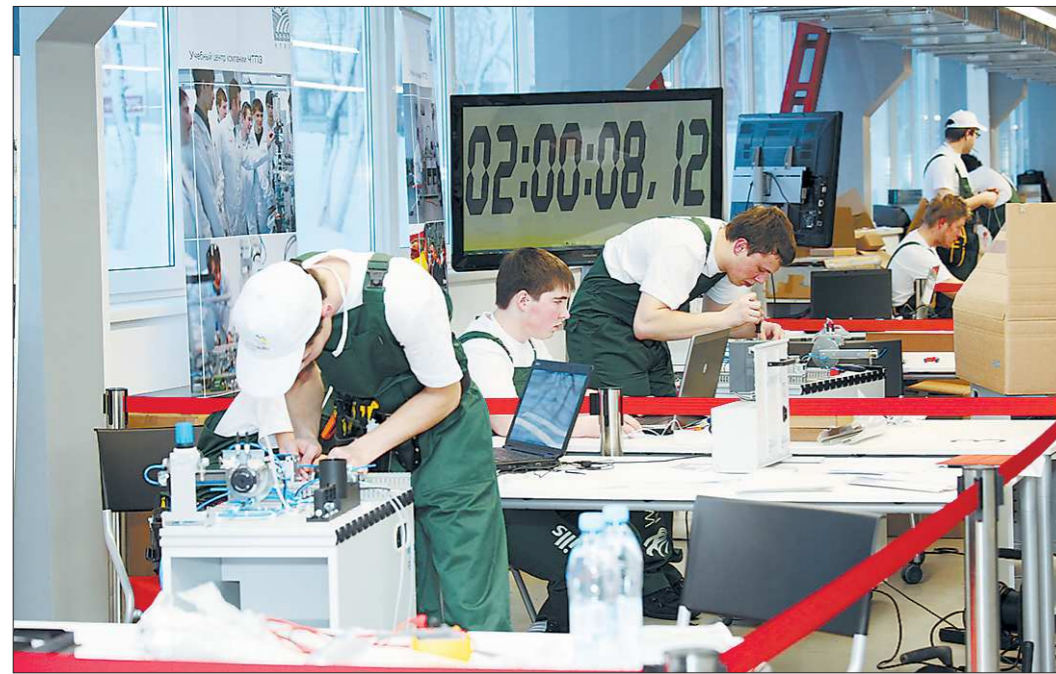
Победителей ждёт чемпионат мира WorldSkills, который состоится в Лейпциге в июле 2013 г.