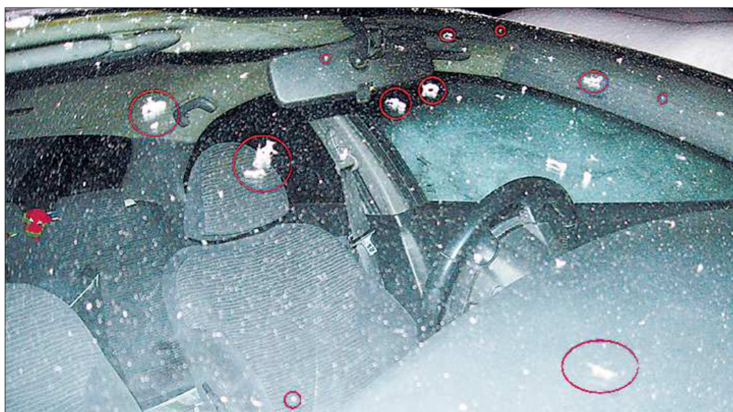
Такие волокна жители посёлка наблюдают на домах, деревьях и автомобилях. Отличить «вату» (обведено красным) от снежных хлопьев с первого взгляда непросто