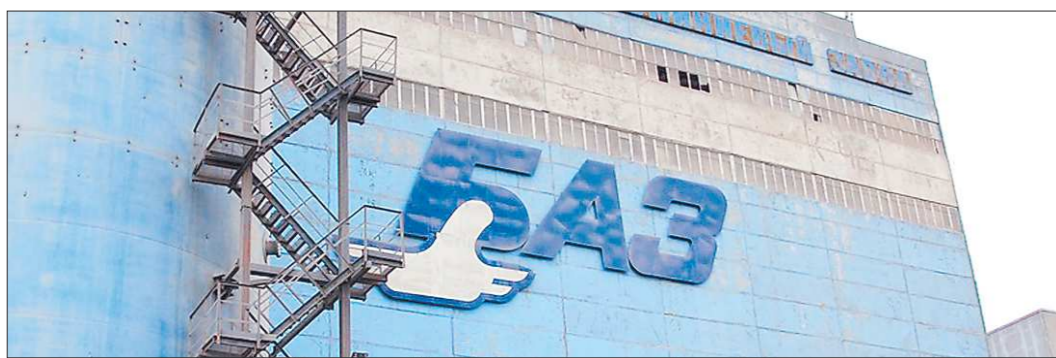
Цехам БАЗа предстоит модернизация

Кроме того, прогнозируется значительный приток в регион нового оборудования и технологий в связи с курсом на модернизацию экономики, развитие инновационных производств, привлечение инвестиций в областную