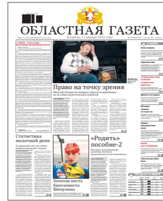
в январе 2012-го