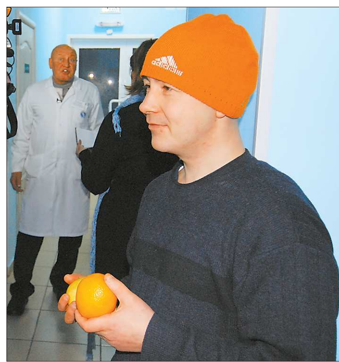
... другой уже собрал себя и готов предстать перед объективами и миром. И у обоих есть надежда на лучшее

Но проносов нет, и свободное общение с прежними знакомыми не разрешается. Только с родителями и членами семей. Выход за пределы центра — только с разрешения. Есть распорядок дня. Но нет телесных наказаний за его нарушение. Побегов тоже нет: от себя не убежишь, а от лечения, пребывания в центре можно просто отказаться. За нарушение