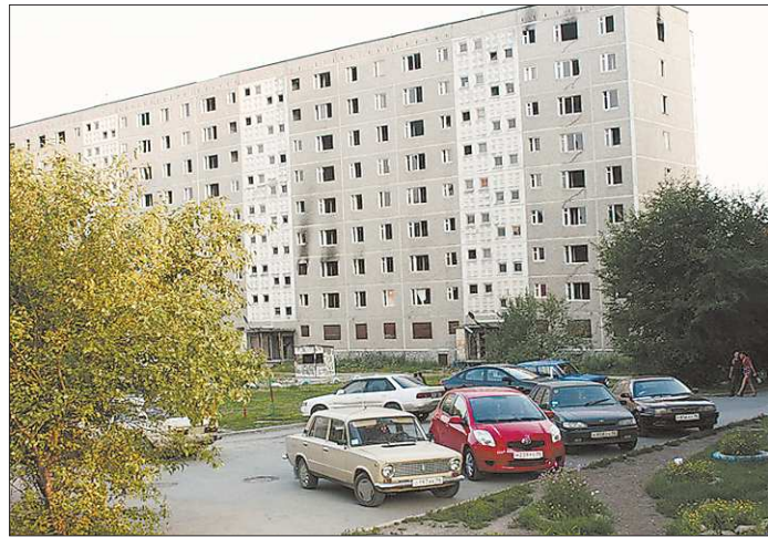
Новое общежитие возведут на месте, где до прошлой осени стояла эта девятиэтажка. Она была построена в 1980-е годы

ВМЕСТЕ www.uralinfoport.ru, сайт региональных СМИ