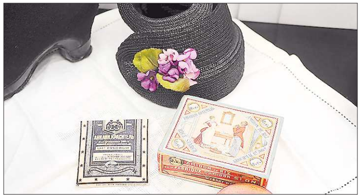
Среди новых экспонатов — соломенные шляпки, старинные коробочки, упаковки и даже платья

— Многие не догадываются, что Евгений Куйвашев, будучи главой ханты-мансийского посёлка городского типа Пойковский, организовывал международный турнир на призы Карпова, который в 2012 году прошёл уже в 12-й раз. На посту главы администрации Тюмени ввёл факультативный шахматный всеобуч. Так что его внимание к шахматам в Свердловской области неслучайно.