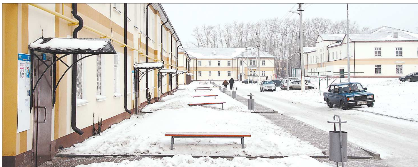
В историческом центре Верхней Пышмы, в который входит несколько улиц, старые дома и дворы уже «переделали» в XXI век

Зимой на «Хладокомбинате №3» в Екатеринбурге — «не сезон». А летом эта линия нагружена под завязку: она выпускает 20 тысяч порций пломбира в час