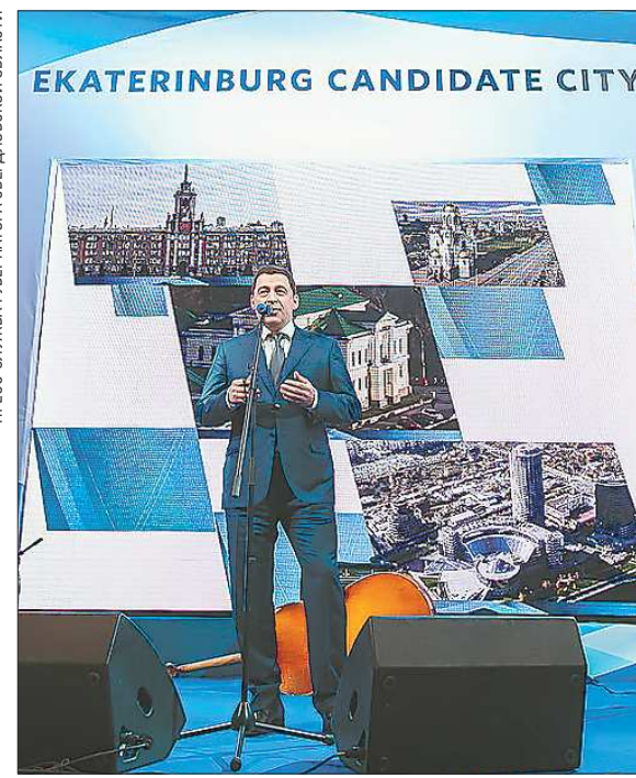
Евгений Куйвашев презентует заявку уральской столицы на проведение ЭКСПО-2020 послам стран, представленных в России