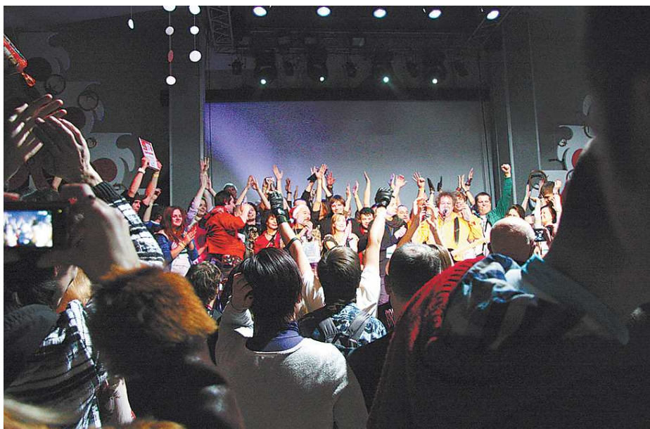
Финальную песню «СНР» – «Соня любит Петю» все знают наизусть, и голоса поющих на сцене сливаются с голосами зрителей.