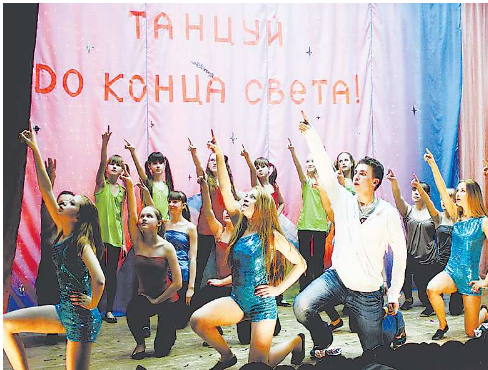
Женя редко выходит на сцену со своими подопечными – предпочитает наблюдать со стороны. Однако если потребуется, всегда готов присоединиться.

Наверное, кому-то покажется странным: как может парень учить девушек двигаться под