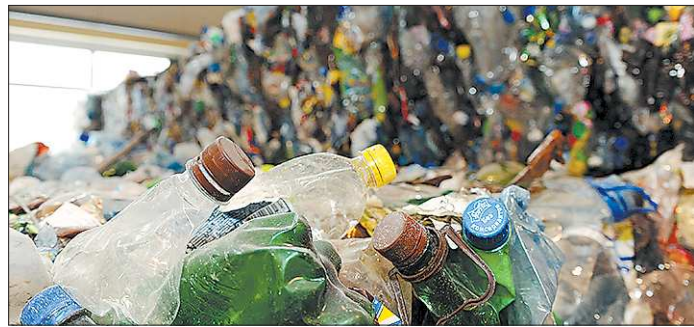
По данным Ростехнадзора, количество отходов и на Урале, и в России постоянно растёт, а процент их переработки — неуклонно снижается

Однако первоуральское предприятие так и не вышло на проектную мощность — 60 тысяч тонн мусора в год. Оно