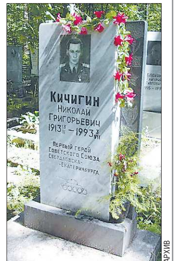
На могиле Кичигина надпись: «Первый Герой Советского Союза Свердловска-Екатеринбурга»

В 1940 году указом Президиума Верховного Совета СССР было присвоено звание Героя Советского Союза младшему лейтенанту Николаю Кичигину. Это был первый Герой Советского Союза из Свердловска.