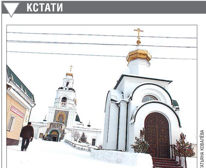
Православные приглашают в храм с любой проблемой, касающейся ребёнка

Пользуясь случаем, хочу поздравить работников комиссий по делам несовершеннолетних с круглой датой и пожелать всем успешной работы на благо наших детей.