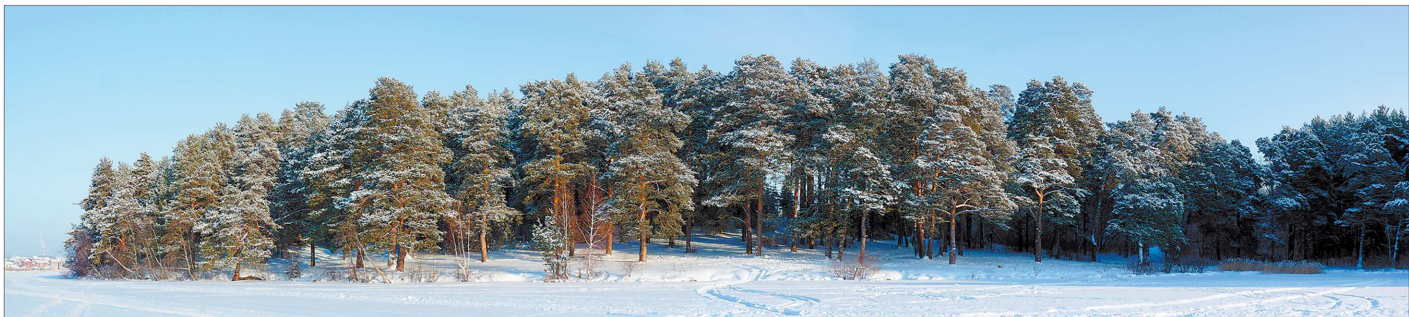
Как уверяет сысертское руководство, на отвоёванном у иностранцев берегу местного пруда всё-таки организуют освещённую лыжную трассу

В целом перспективы развития Дзержинского района получили одобрение горожан. Они надеются, что найдутся инвесторы для строительства не только поликлиники, но и других объектов.