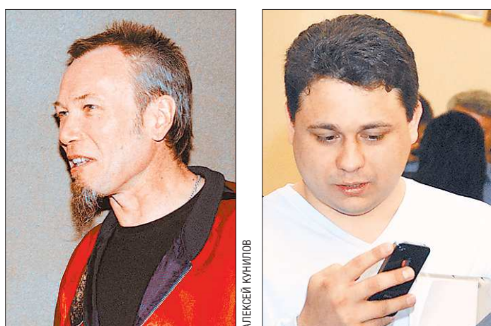
Музыкант (слева) и блогер (справа) поспорили из-за номера губернаторского телефона. Или, всё-таки, — по причине неудовлетворённых амбиций?..