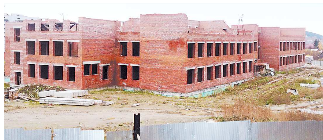
По последней информации сысертской мэрии, деньги из областного бюджета на строительство сысертской школы могут поступить в ближайшие дни. А возобновления работ на стройплощадке можно ожидать сразу после рождественских каникул