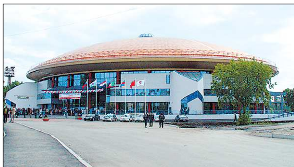
В течение трёх лет подряд (с 2004-го по 2006 годы) ДИВС признавался лучшим спортооружением на национальном конкурсе «Спортивная индустрия России». А с 2010 года дворец начал брать награды на конкурсах международного уровня

—Вполне. Маленький пример. Заключительная игра волейбольной «Уралочки» на групповом этапе женской лиги чемпионов была с французским «Канном». Так вот, гости жили именно у нас в отеле. Наш уровень их вполне удовлетворяет. Гости мини-футбольной «Синары» тоже у нас регулярно останавливаются.