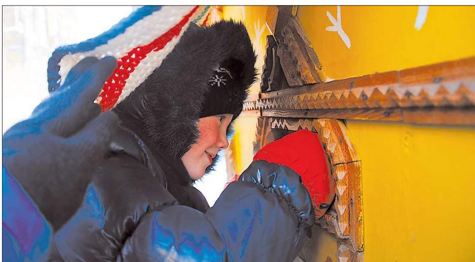
Каждый ребёнок получил волшебную звездочку, исполняющую одно, но самое заветное желание

Мальши хохочут и соглашаются (Деда Мороза они ещё никогда не разыгрывали). Посмотрев «Аленький цветочек», дети опять спешат в фойе — поиграть со Снегурочкой и самим хозяином Нового года. Ну, а потом все на улицу — в сказочный «Коляда-сад». Дети разучивают весёлые колядки, забыв про мороз. И даже взрослые участвуют.