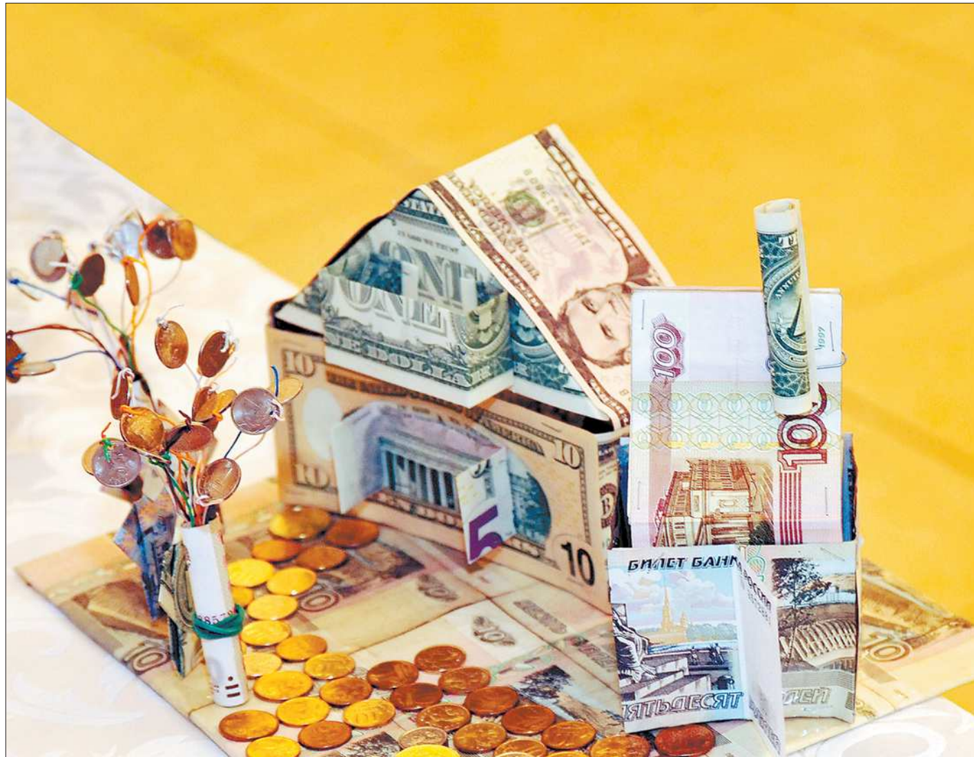
Дом хорош, да хозяин негож

Предполагалось, что до начала действия постановления федерального правительства, к 1 июля текущего года, во всех многоквартирных домах будут установлены узлы учёта потребляемых ресурсов. До этого официально определённого срока окончания оборудования жилых зданий приборами учёта допускалось учитывать все общедомовые расходы в графе «содержание жилья». Но если добросовестные управляющие компании и ТСЖ их оплачивали, то было немало и таких, которые эти деньги не перечисляли поставщикам электроэнергии, воды, тепла. Поэтому, чтобы пресечь злоупотребления, решено было разделить эти платежи, то есть выделить суммы по оплате общедомовых расходов на полученные ресурсы в отдельную строку.