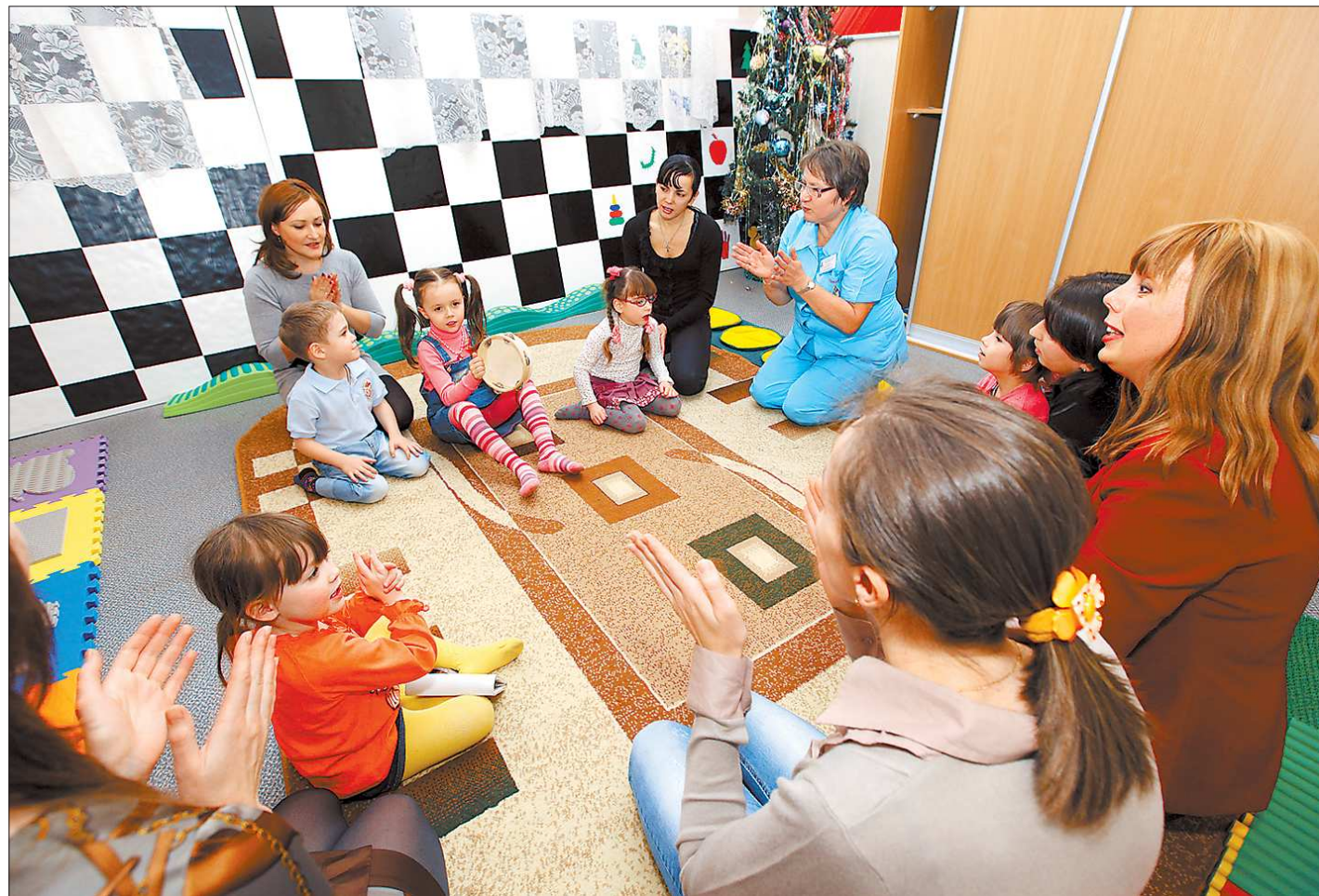
Специалисты утверждают, что игры для детей раннего возраста – это основной источник знаний, навыков и хорошего настроения

Подчеркнуто, что помощь детям и родителям в лекотеке реабилитационного центра «Талисман» будет оказываться бесплатно. Её смогут получить дети от двух лет с нарушениями развития.