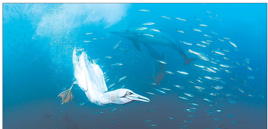
Фотографы показали природу такой, какой её видит не каждый