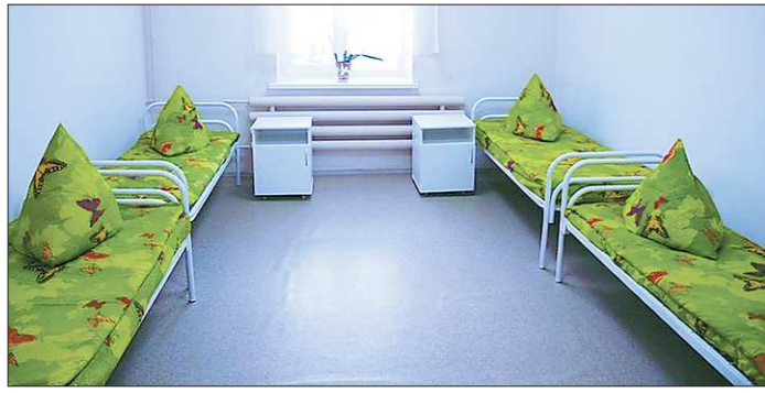
Врачи считают, что для создания душевного комфорта в комнатах нужно поддерживать порядок