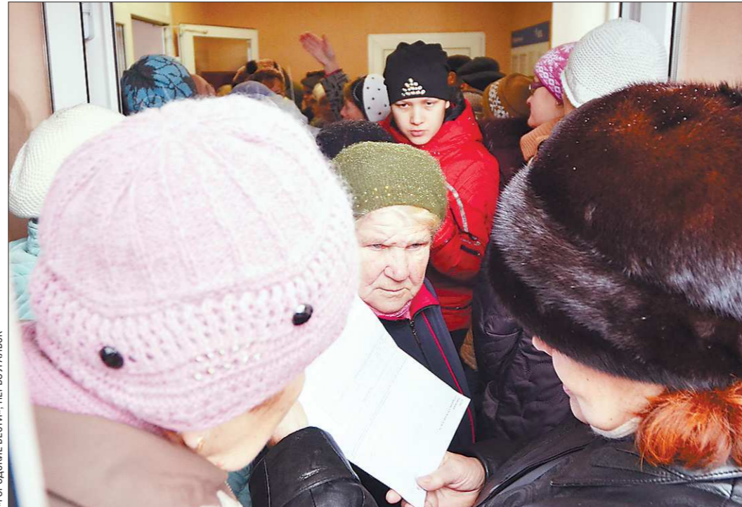
«Городские вести», Первоуральск

Народ кинулся за разъяснениями в расчётный центр «Свердловэнерго», в свои управляющие компании и в местную администрацию. Оказалось, что расчёты произведены за два месяца. Но даже и с учётом этого суммы были огромными. Распльчатые формулировки 354-го постановления, в частности, определяющие понятия «места общего пользования» и «общедомовые нужды», позволили коммунальщикам заняться «самодельностью» в начислении предоставляемых гражданам сумм. Иные УК при расчёте стоимости электроэнергии, воды и тепла по статье «общедомовые» нуж-