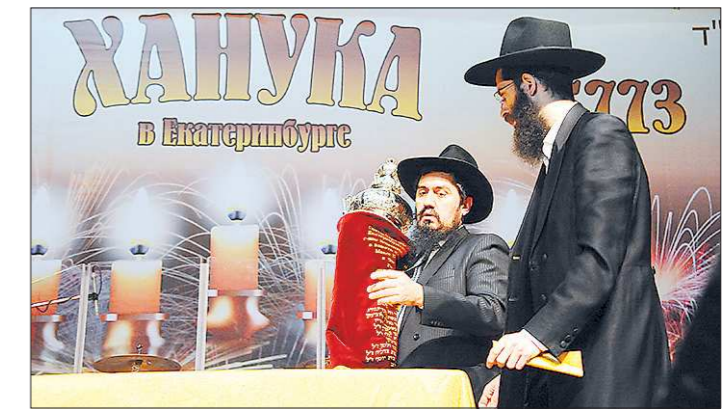
В дни Хануки устраивают многолюдные застолья, одна из задач которых — мирить людей, поссорившихся между собой