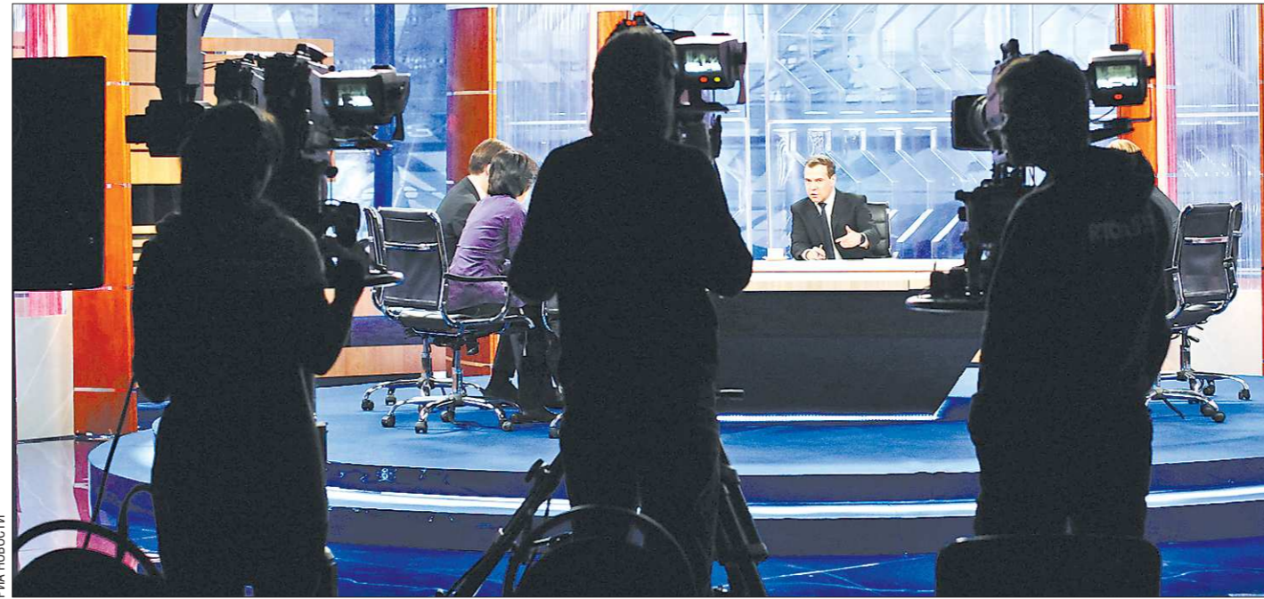
Чёрные тени операторов ТВ не помешали Дмитрию Медведеву ответить на сложные вопросы журналистов

исполнением этого решения проследит Управление государственной жилищной инспекции Свердловской области, которое, кстати, уже получило около восьмисот жалоб от уральцев, имеющих претензии к управляющим компаниям по поводу качества коммунального обслуживания и сомнительной правильности начисления платежей за эти услуги.