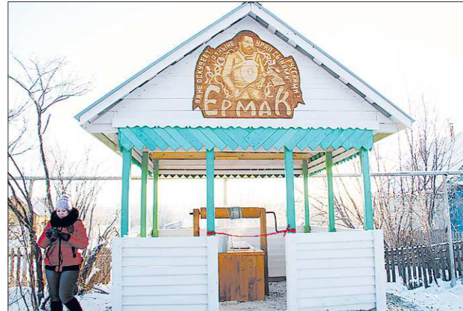
Это самый глубокий колодец в Монетном. Его глубина достигает 13 метров

Второе рождение пережил колодец посёлка Монетного Берёзовского городского округа, пишет газета «Золотая горка».