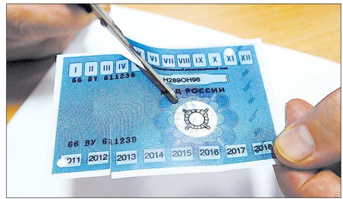
Прощай, заветный талон. Ты долго компостировал мозги водителям...

Выданные талоны техосмотра действуют до 1 августа 2015 года, а машины моложе трёх лет в нём не нуждаются.