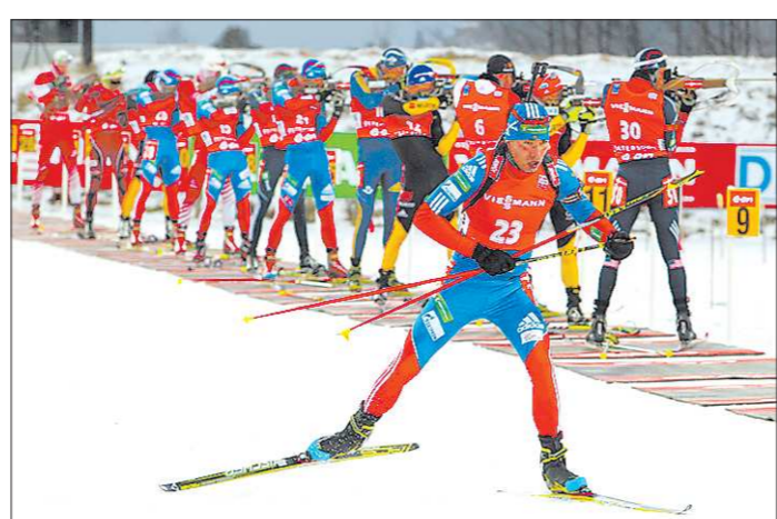
В мужской биатлонной гонке преследования Антон Шипулин прорвался на третье место с 23-й стартовой позиции

Жители посёлка постепенно приспособились к новым условиям жизни. Некоторые ездят на работу за 80 километров в Верхнюю Салду, на ВСМПО. Другие занимаются предпринимательством. Смирнулись басыновцы с потерей больницы. Теперь их обслуживает фельдшерско-акушерский пункт, в котором есть процедурный кабинет, аппаратура для ЭКГ, машина для доставки заболевших в город. Благодаря энтузиазму местных активистов был проведён ремонт узкоколейной железной дороги. На областные средства ведётся асфальтирование дороги до Верхней Салды. На встрече с представителями администрации прозвучало много претензий по работе ЖКХ, были эмоциональные выступления с требованием решить вопрос об открытии бани. Банно-прачечных услуг местные жители не могут дожидаться несколько лет. Чиновники ответили предложением оборудовать для общего пользования несколько душевых кабинок.