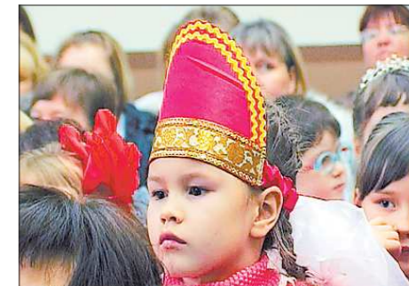
Немного фантазии и экологический мусор превращается в экологический парад

УЧРЕДИТЕЛИ И ИЗДАТЕЛИ: Губернатор Свердловской области, Законодательное Собрание Свердловской области. Адрес: 620031, г. Екатеринбург, пл. Октябрьская, 1