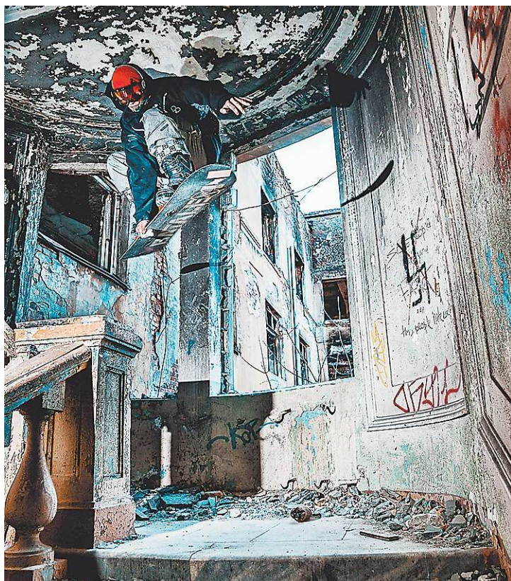
Так развлекают себя ребята, когда на улице нет снега.