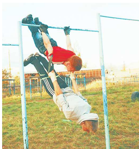
Новые трюки парни ищут в Интернете.