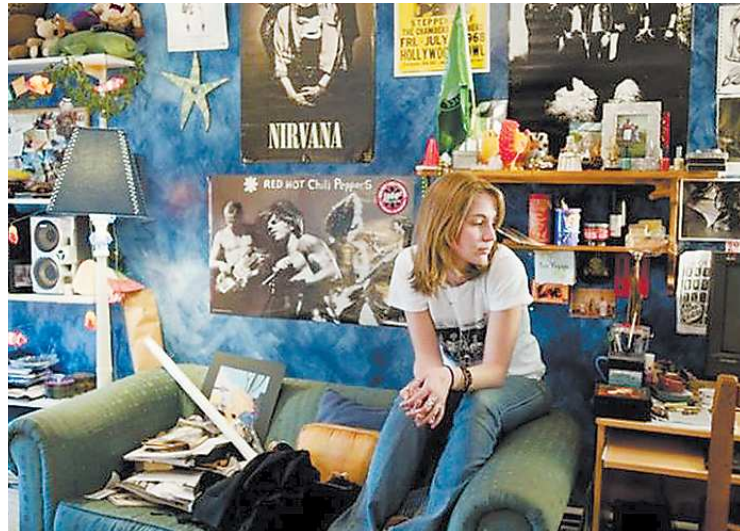
Чтобы личное пространство чувствовалось по-настоящему своим, в ход пойдут любые мелочи: любимые вещи, плакаты...

не отказывайте себе в удовольствии использовать увлечения в интерьере. Можно оформить дорогие вам мелочи в рамочки и повесить все их на стенку над столом. Ваши рамочки получатся разнокалиберные, а от того