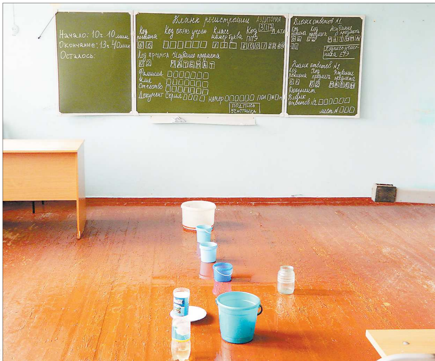
Протёкшие потолки и осыпавшаяся штукатурка — не редкость в учебных заведениях нашей области. Только в этом году памяти ЧП в качканарской школе №7 и школе №30 Каменска-Уральского