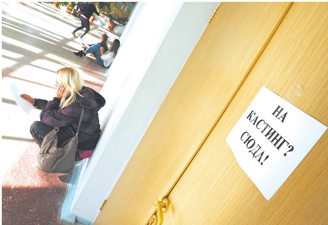
Желающих ходить в театр среди школьников и студентов всё меньше. Тех, кто мечтает попасть в театральные студии, тоже единицы.

Большинство из опрошенных сверстников не прочь посетить любительское представление. Театральная студия или кружок есть в любом населённом пункте. Школьники и студенты часто