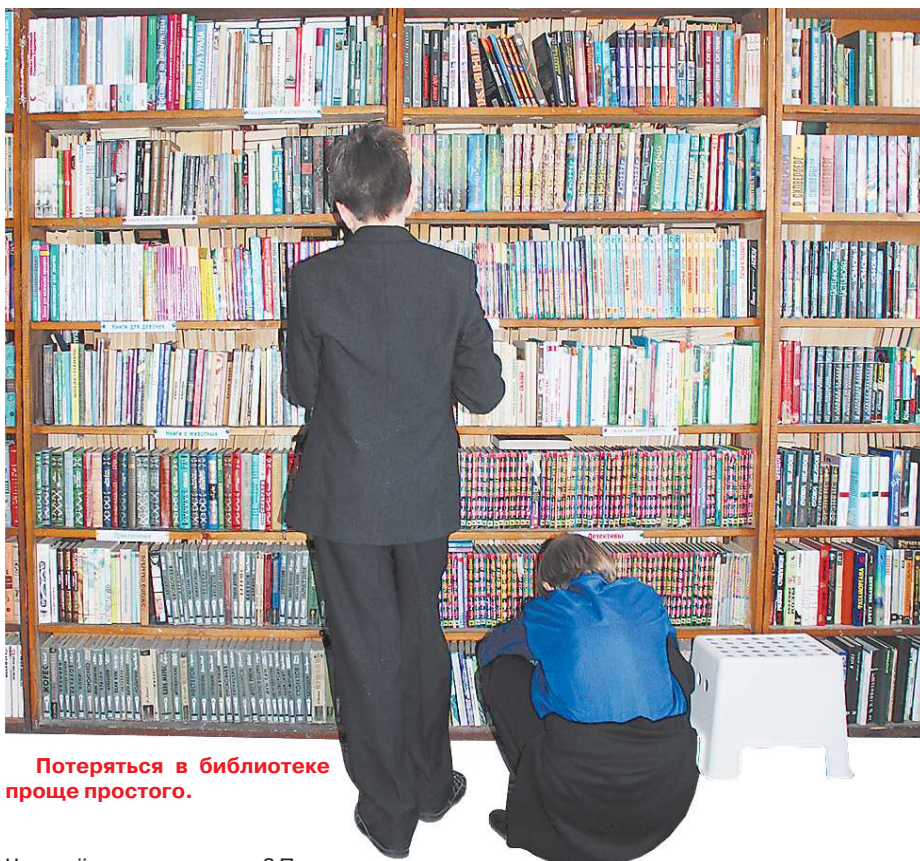
Потеряться в библиотеке проще простого.

Представьте, что вы держите в руках книгу, у которой эффектный дизайн, роскошное оформление, комфортный шрифт.