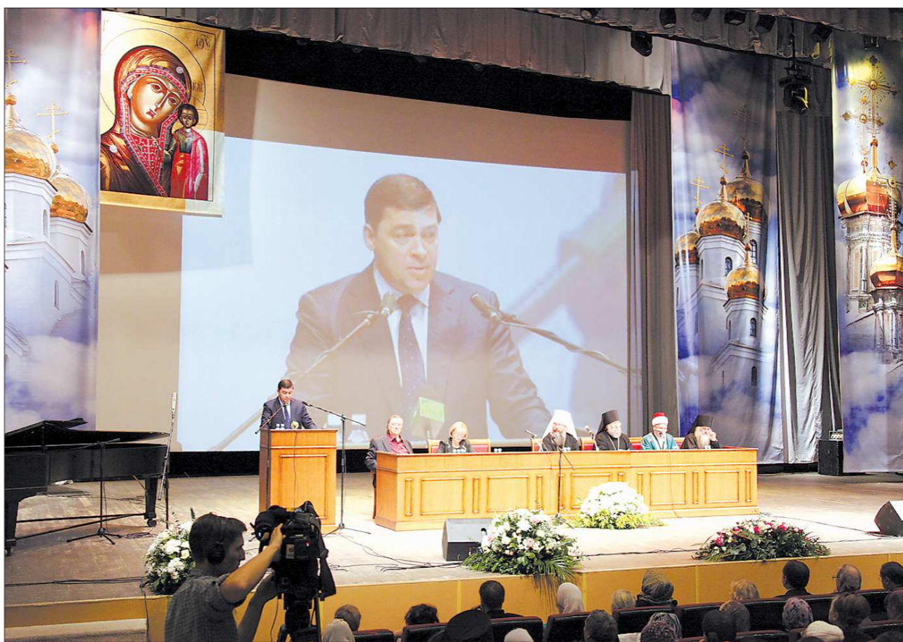
Губернатор Евгений Куйвашев подчеркнул, что потенциал Урала — в единстве народов, живущих здесь издревле

И действительно, России это место принадле-