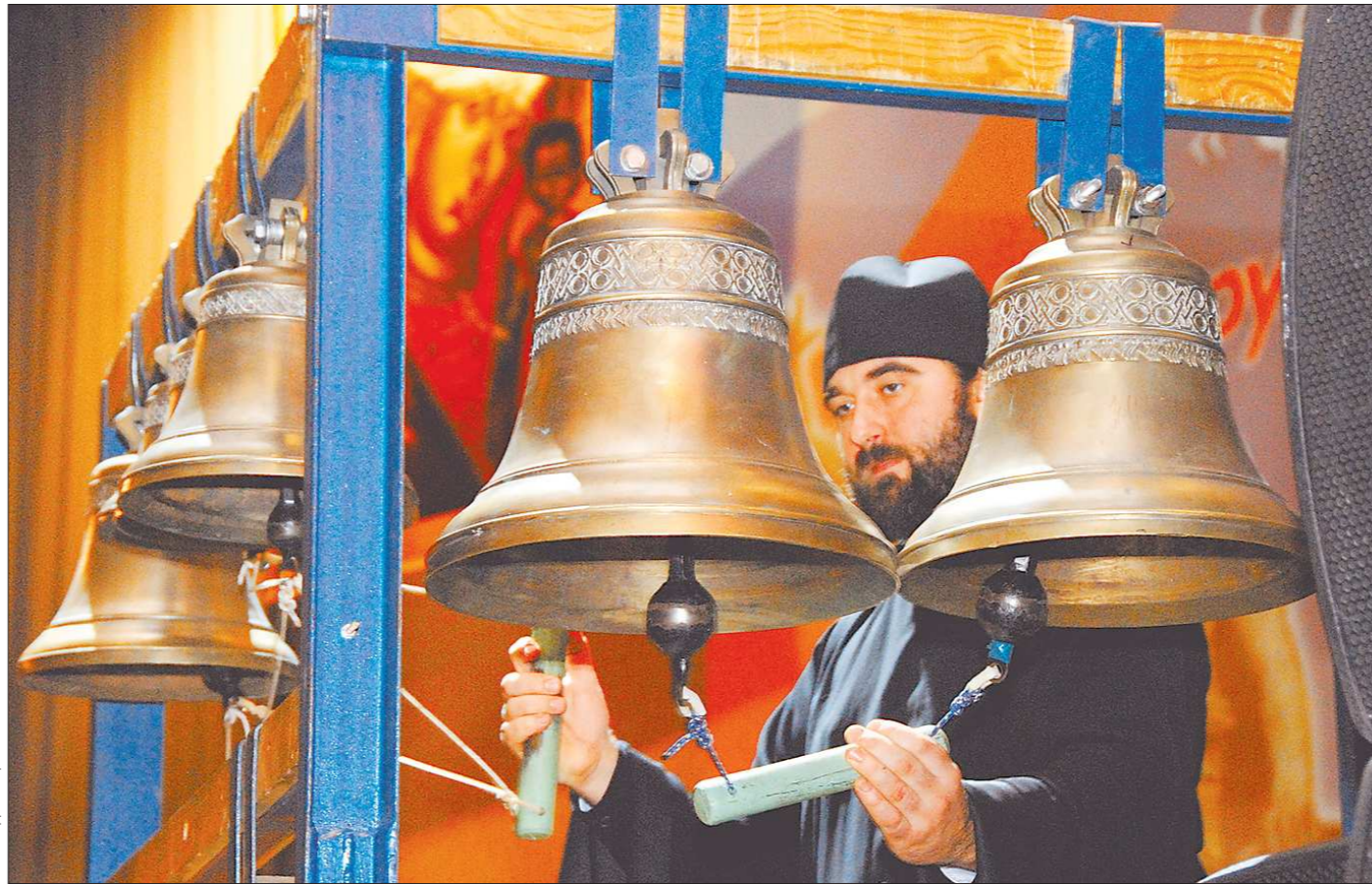
Звоном колоколов открылся в Екатеринбургском форуме общенационального Среднего Урала «Единство – оружие нашей Победы»

На наш взгляд, партии активизировались. Это хорошо. Вопрос в другом: что они предлагают обществу. А вот «внесистемная оппозиция» - о ней даже говорить не хочется.