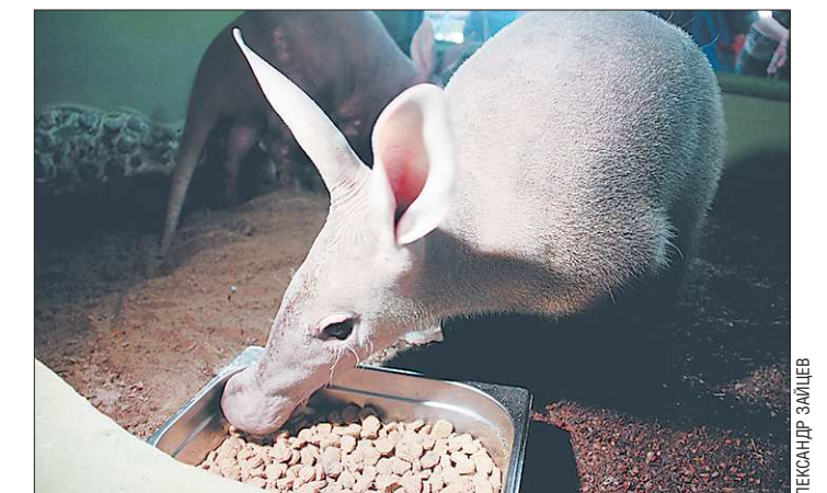
Африканские трубокозубы прибыли на Средний Урал весной, в коллекциях других российских зоопарков этих зверьков нет

В понедельник в зоопарке стартует проект онлайн вещания «EkaZoo» – самые активные и общительные животные попали под круглосуточное наблюдение.