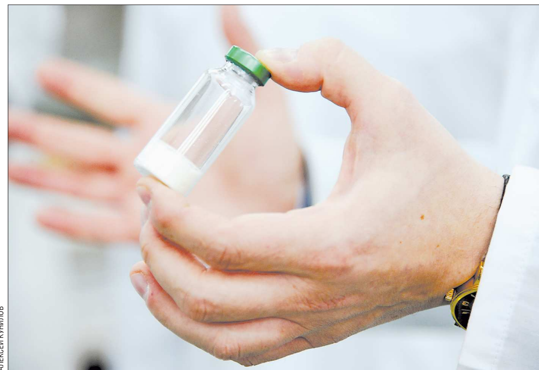
Стоимость этой бактерии на мировом рынке — 50 миллионов евро

В мае 2012 года, после четырёхлетних исследований, уральские учёные запатентовали свою бактерию — за покупку аналогичного микроорганизма французам, к примеру, запрашивали 50 миллионов евро.