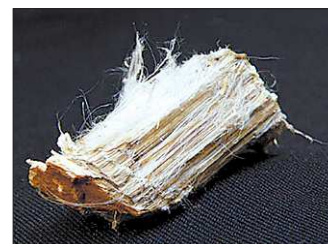
Волокна асбеста в 100 раз тоньше, чем волос