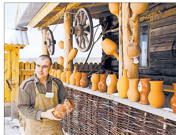
Если найти удачный компромисс между рублием и творчеством — дело пойдёт

В 33 субъектах РФ уже приняты местные законы и программы поддержки народных промыслов, разрабатывается такой закон и в нашей области.