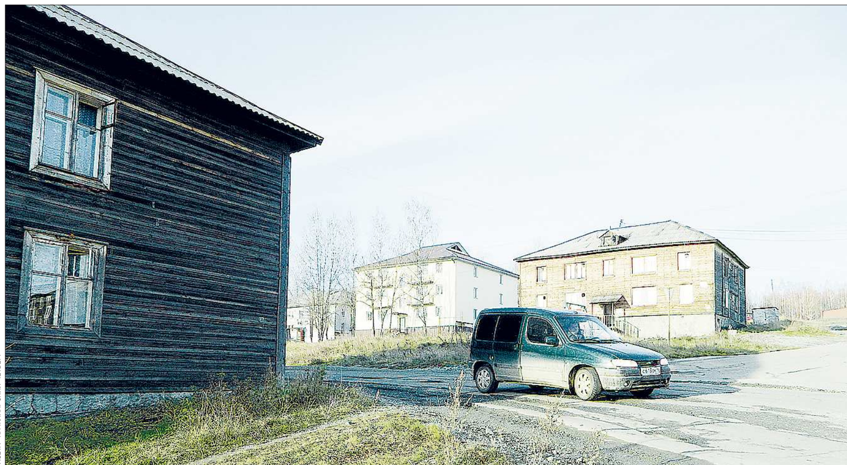
ГАЗЕТА «КАЧКАНАРСКИЙ ЧЕТВЕРГ»

В мае 2012 года администрация Горноуральского городского округа не продлила с фирмой договор аренды. Объявленный конкурс выиграла другая организация. Новые хозяева сделали за лето в помещении аптеки хороший ремонт, расширили площадь торгового зала, закупили современную мебель, завезли большой ассортимент лекарственных препаратов. Появилась у них и услуга предварительного заказа препаратов.