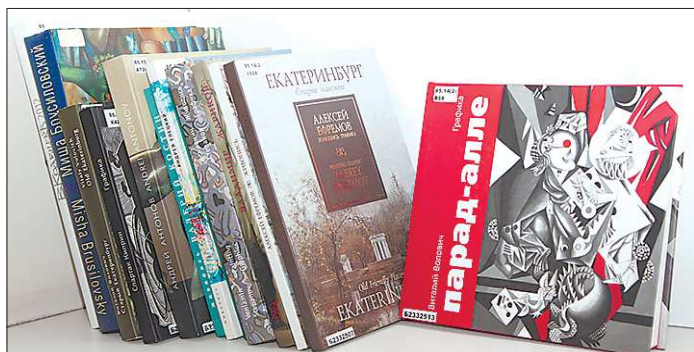
Под обложкой любой книги – масса образов. Целый... парад-алле