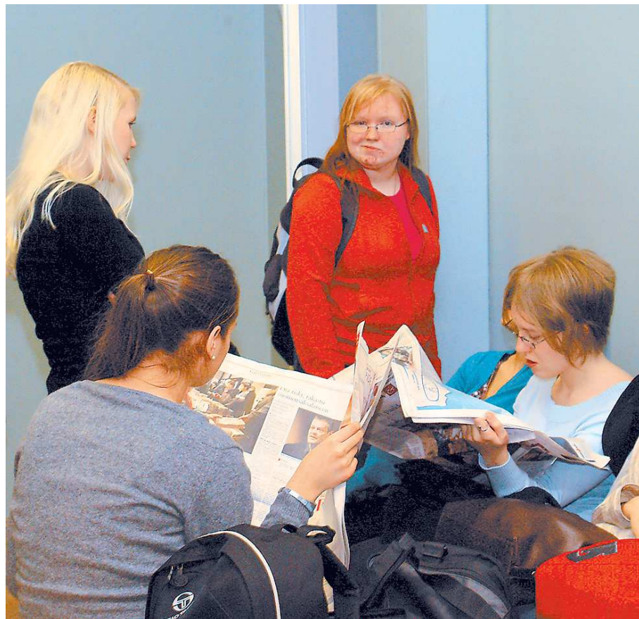
Почитать свежие новости в очередном номере газеты – ещё одна возможность скоротать перемену в школе.