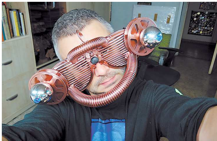
Эту модель художник закончил как раз перед выходом этого номера «НЭ», сам померили и прислали нам фото.