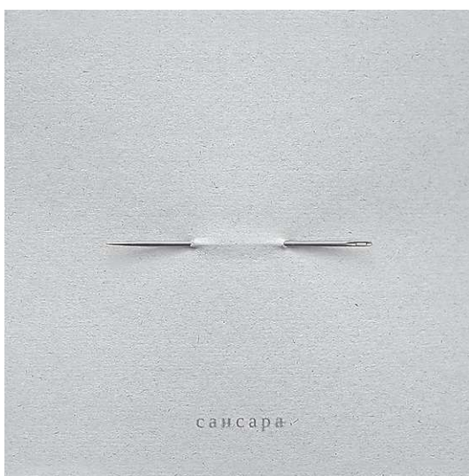
Обложка нового альбома группы.

—Раз уж «Сансара» постоянно меняется — что дальше?