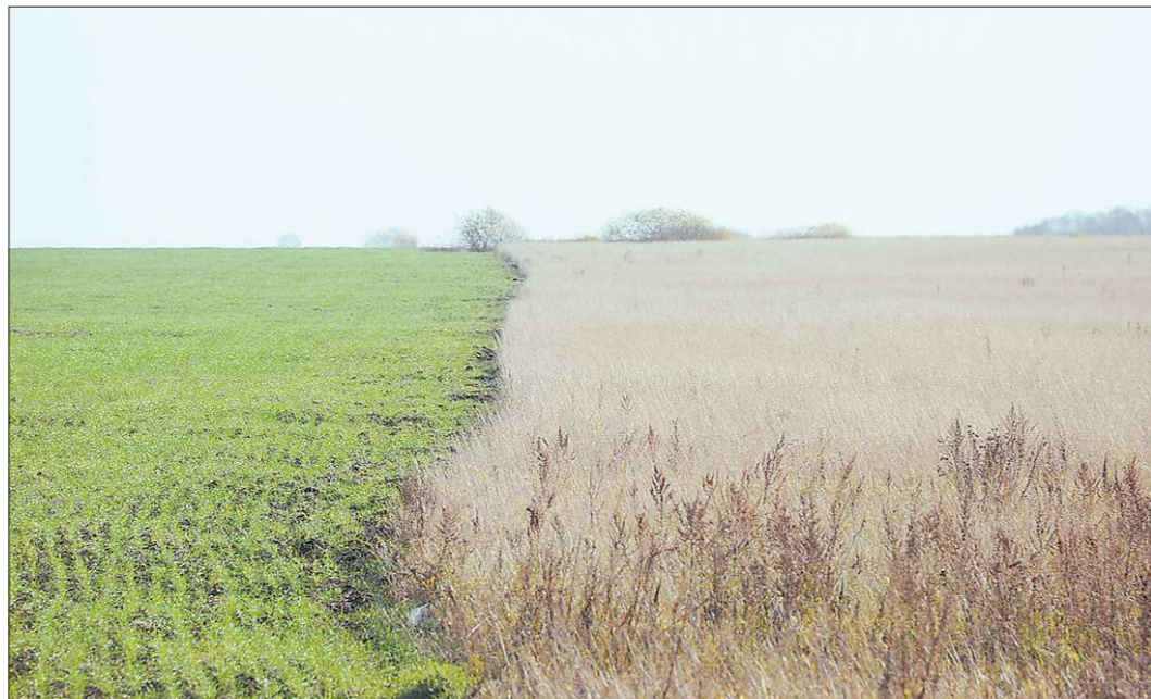
Контраст между обрабатываемыми землями и брошенными разнотелен; на снимке справа — специалисты птицефабрики «Свердловская» и местного управления АПК определяются на месте с участком, выставленным на аукцион

С формальной стороны всё было сделано правильно, законность соблюдена. Но если посмотреть на ситуацию шире, получается форменное издевательство. Почему закон у нас работает против того, кто пытается что-то сделать на земле? Почему к собственникам брошенной земли те же уважаемые ведомства не предъявляют столь же рьяно претензий по её неиспользованию? Ведь по закону через три года у таких горе-собственников землю можно даже изъять. Но ни гектара никто не изъять. Заме-