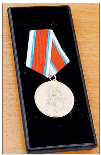
Готовы даже медали лауреатов, но вот кому, а главное когда они будут вручены?

круг детской литературы «схлопнулись копы» на двух событиях. Днём – на камерной церемонии оглашения списка финалистов Крапивинской премии, которую постарались не заметить даже те люди, что призваны замечать это (лучшее в нашей литературе!). Вечером того же дня – на форуме блогеров, которые на сей раз обсуждали инициативу Уральского родительского комитета по поводу... как раз детской литературы. За несколько дней до того стало известно, что комитет направил Уполномоченному при Президенте РФ по правам ребёнка Павлу Астахову обращение-требование относительно ряда детских книг по поводу... как раз детской литературы. За несколько дней до того стало известно, что комитет направил Уполномоченному при Президенте РФ по правам ребёнка Павлу Астахову обращение-требование относительно ряда детских книг по поводу... как раз детской литературы. За несколько дней до того стало известно, что комитет направил Уполномоченному при Президенте РФ по правам ребёнка Павлу Астахову обращение-требование относительно ряда детских книг по поводу... как раз детской литературы.