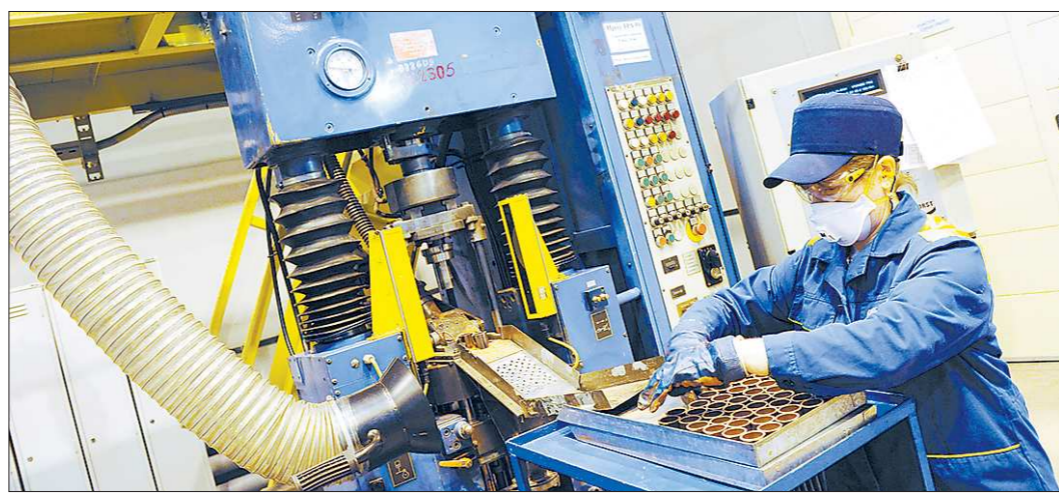
Своевременная выплата зарплаты и безопасность труда — вот что важно труженику уральских предприятий

Если пункт с требованием о непременно тайном голосовании по ключевым должностям в парламенте появится в тексте нового регламента, то сегодняшние депутаты рискуют создать проблемы для своих коллег, которых изберут через несколько лет.