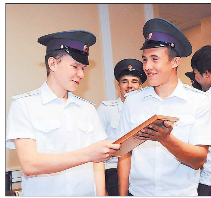
На голове фуражка, на белой рубашке – погоны... Свердловские казачата получили первые заслуженные награды