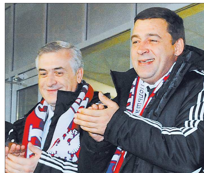
Футбол для губернатора Свердловской области Евгения Куйвашева (на фото — справа) превратился в магистральную тему, которая будет стоять особняком на повестке дня ближайшие шесть лет