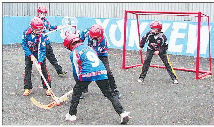
Тренировка у юных хоккеистов проходит в два этапа: на роликах и без них. Владение клюшкой пока отрабатывают в удобной обуви

ВМЕСТЕ www.uralinfoport.ru, сайт региональных СМИ