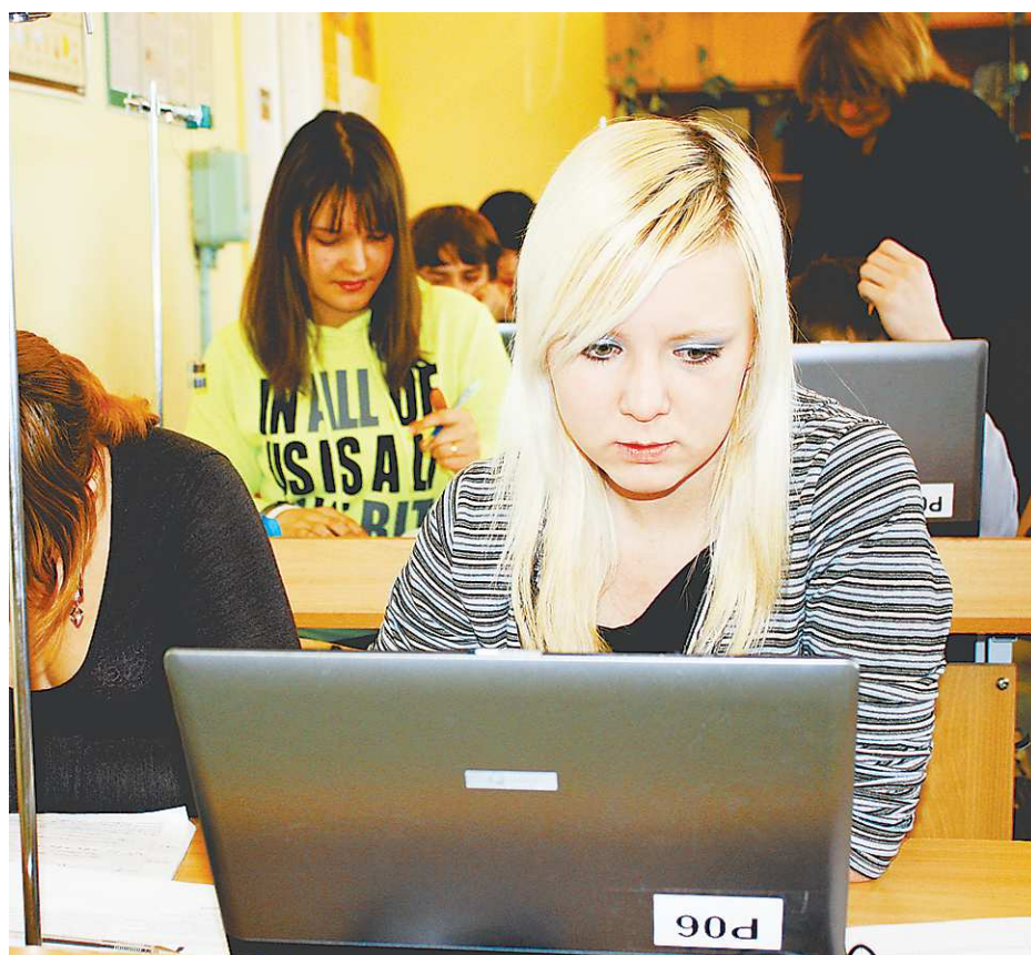
Пользоваться компьютером и Интернетом многие могут только в школе, но и здесь скорость низкая и компьютеры наперецёт.

–Скорость нашего Интернета 128 килобит в секунду. Но на деле оказывается, что ещё ниже. Небольшая картинка может загружаться от 10 до 20 минут. А это почти пол-урока. Чтобы сохранить какой-то файл или таблицу, нужно тоже запастись терпением. Поэтому, несмотря на большие возможности, связанные с Интернетом, работа с ним сводится к минимуму –