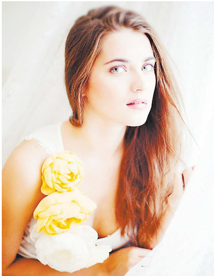
«На конкурсе я просто показывала себя, такую, какая я есть. И я очень рада, что мне удалось сделать это».

Конечно, в 2009-м я расстроилась, что не выиграла. Но сейчас я понимаю, насколько это было правильно. Просто тогда было время не для этого, а для других вещей. Время поехать в город мечты — Токио, время уехать на годовую стажировку в Испанию, время осоз-