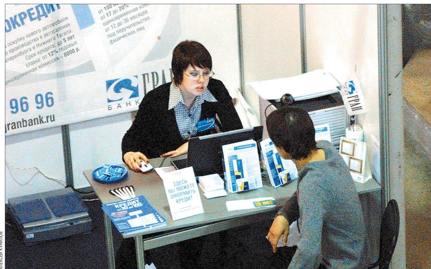
«Деньги без финансовой разумности — это те деньги, что вскоре пропадут». Роберт Кийосаки, предприниматель