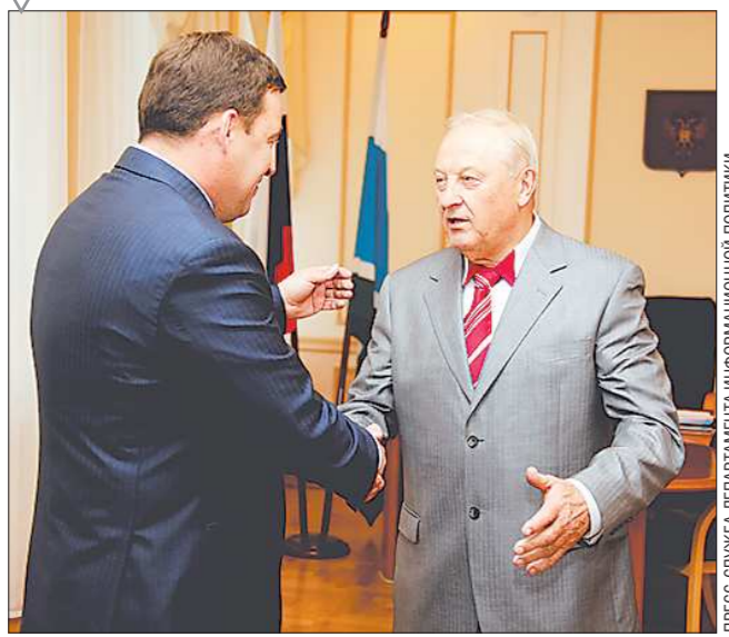
ПРЕСС-СЛУЖБА ЦЕНТРАЛЬНЫХ ИНФОРМАЦИОННОЙ ПОЛИТИКИ

Вчера губернатор Евгений Куйвашев поздравил с 75-летием первого губернатора Свердловской области, члена Совета Федерации Федерального Собрания РФ Эдуарда Росселя. Крупный промышленный регион он руководил долгие годы. С его деятельностью связан социально-экономический рост Среднего Урала, множество преобразований и начинаний. При Э.Росселе Урал открыли иностранные партнёры, познакомились с его огромным экономическим, научным, культурным потенциалом. Поздравляя Эдуарда Росселя, Евгений Куйвашев подчеркнул: — Мы искренне рады, что у нас в области был такой губернатор, а теперь такой сенатор. Несмотря на то что вроде бы и возраст уже не юношеский — 75 лет, уверен, для вас это только начало, мы ещё с вами поработаем, принесём немало пользы уральцам. Продолжайте радовать нас своим неугомонным характером, своей работой. — Это я вам обещаю, — заверил Э.Россель. Желая юбиляру крепкого здоровья, оптимизма, Е.Куйвашев заметил, что власти региона всегда готовы подставить плечо сенатору во всех его начинаниях на благо Среднего Урала.