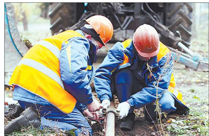
От быстроты действий специалистов зависит безопасность пятиэтажного дома

По легенде в подвале находился человек без сознания. Спасатели быстро нашли пострадавшего, оказали ему доврачебную помощь и передали врачам скорой помощи. В это время пожарные расчёты уже были приведены в боевую готовность, а дорожная полиция перекрыла движение автотранспорта вблизи дома. Тем временем газовики установили место прорыва. Для того, чтобы ликвидиро-