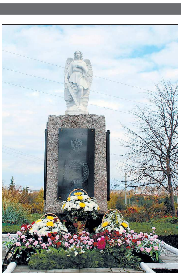
ПРЕСС-СЛУЖБА ПРАВИТЕЛЬСТВА СVERДЛОВСКОЙ ОБЛАСТИ

А тем временем настоящая убийца чуть было не попала в Ачиче настоярились и вызвали участкового. Тот явился и стал... в нерешительности топтаться перед закрытой дверью. Не зная, что кроме хозяйки, в комнате ещё была и убийца. Блестит так и не решился взломать дверь. Сегодня говорит: его, мол, не фанера останавливала,