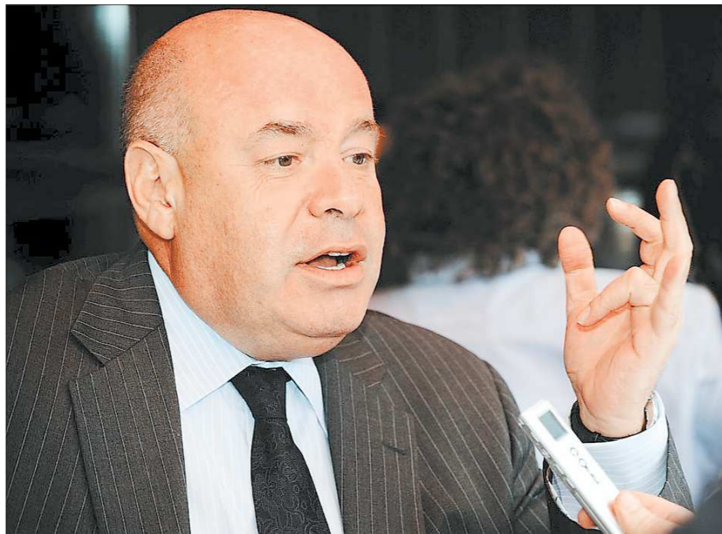
Михаил Швыдкой в программе «Акцент»

Буквально две недели тому назад мы провели в Казахстане «ТЭФИ-Содружество». Это