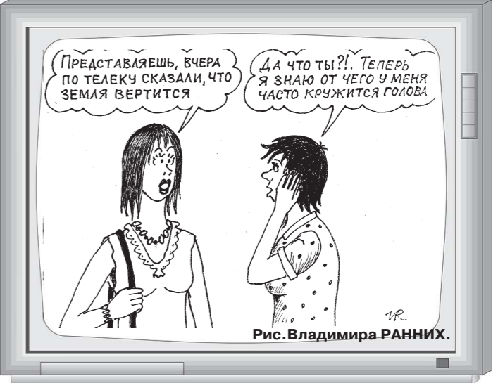
Рис. Владимира РАННИХ.

18.00 Х-версии. Другие новости (12+) 18.30 Д/ф «Охотники за привидениями» (12+) 19.00 Т/с «Я отменяю смерть» (12+)