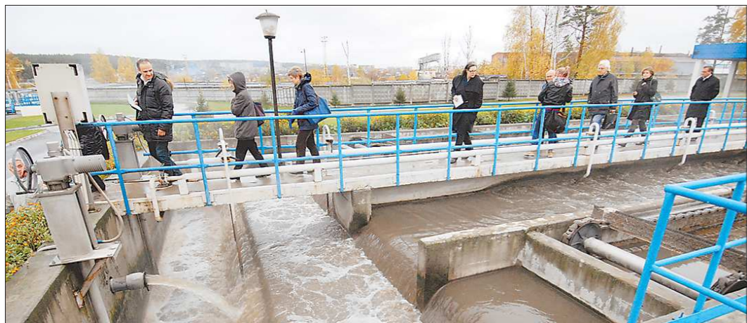
Международным экологам показывают активный ил – биологическую очистку сточных вод